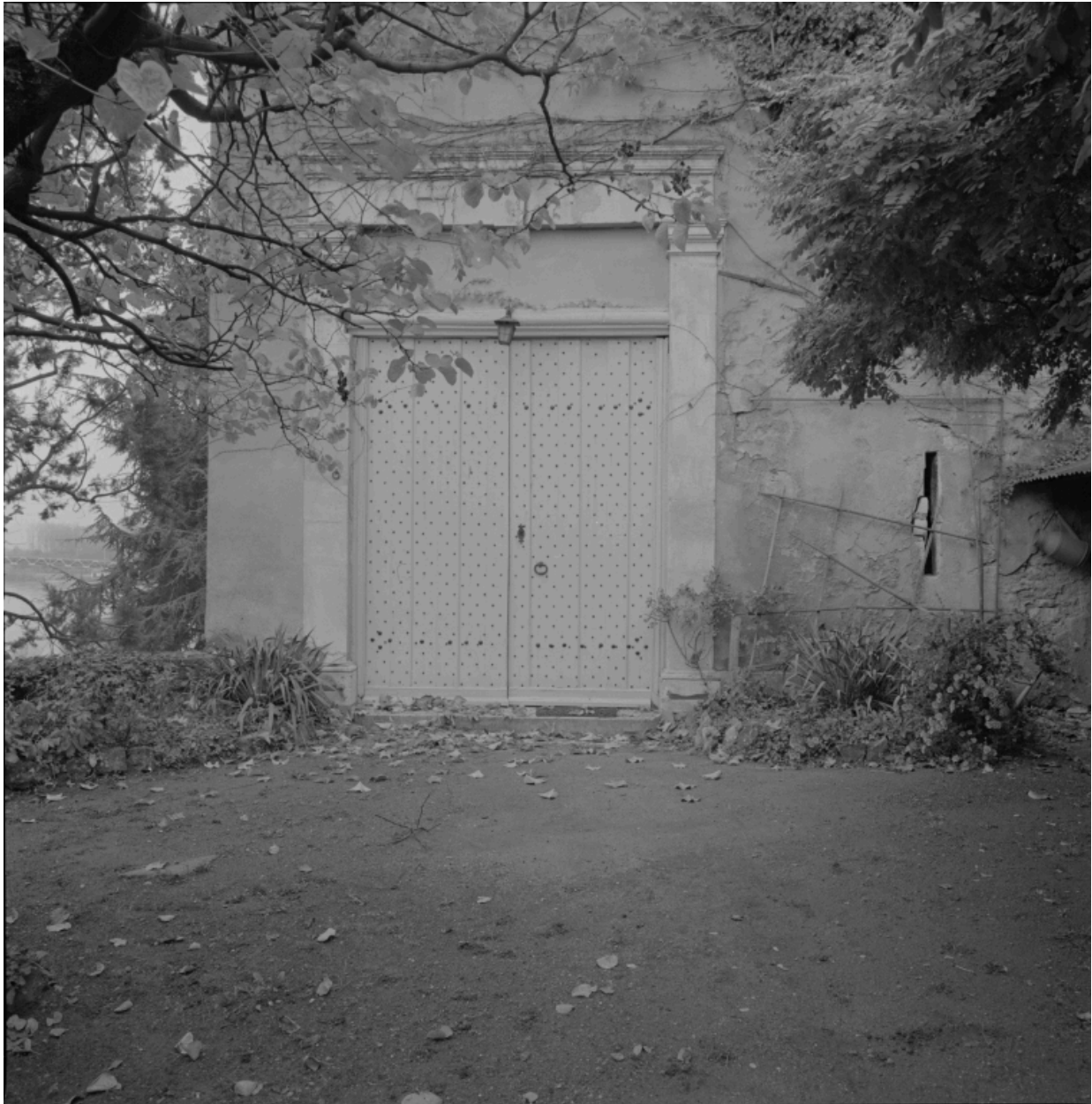
Portail de dépendance, ouvrant sur le jardin.