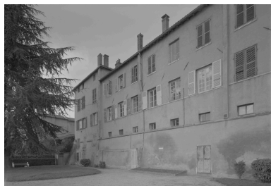
Elévation sur le quai. IVR82_19900100402P