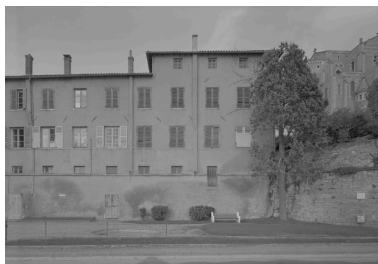
Elévation sur le quai, partie droite. IVR82_19900100403P