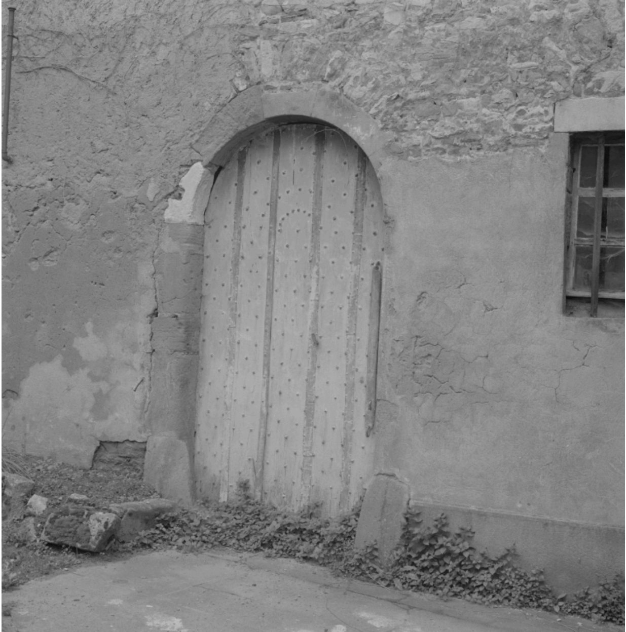
Porte du grenier à sel ouvrant sur la cour.