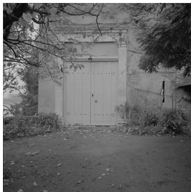
Portail de dépendance, ouvrant sur le jardin.