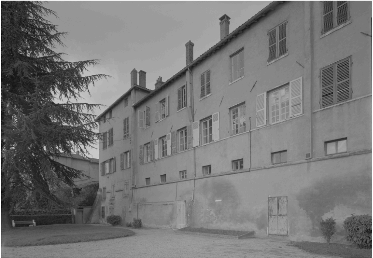
Elévation sur le quai.