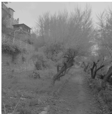
Jardin en terrasse, vue partielle. IVR82_19900100400X