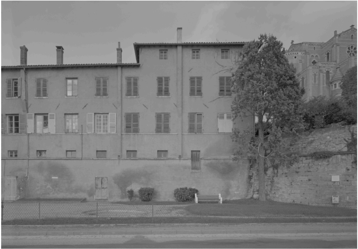
Elévation sur le quai, partie droite.