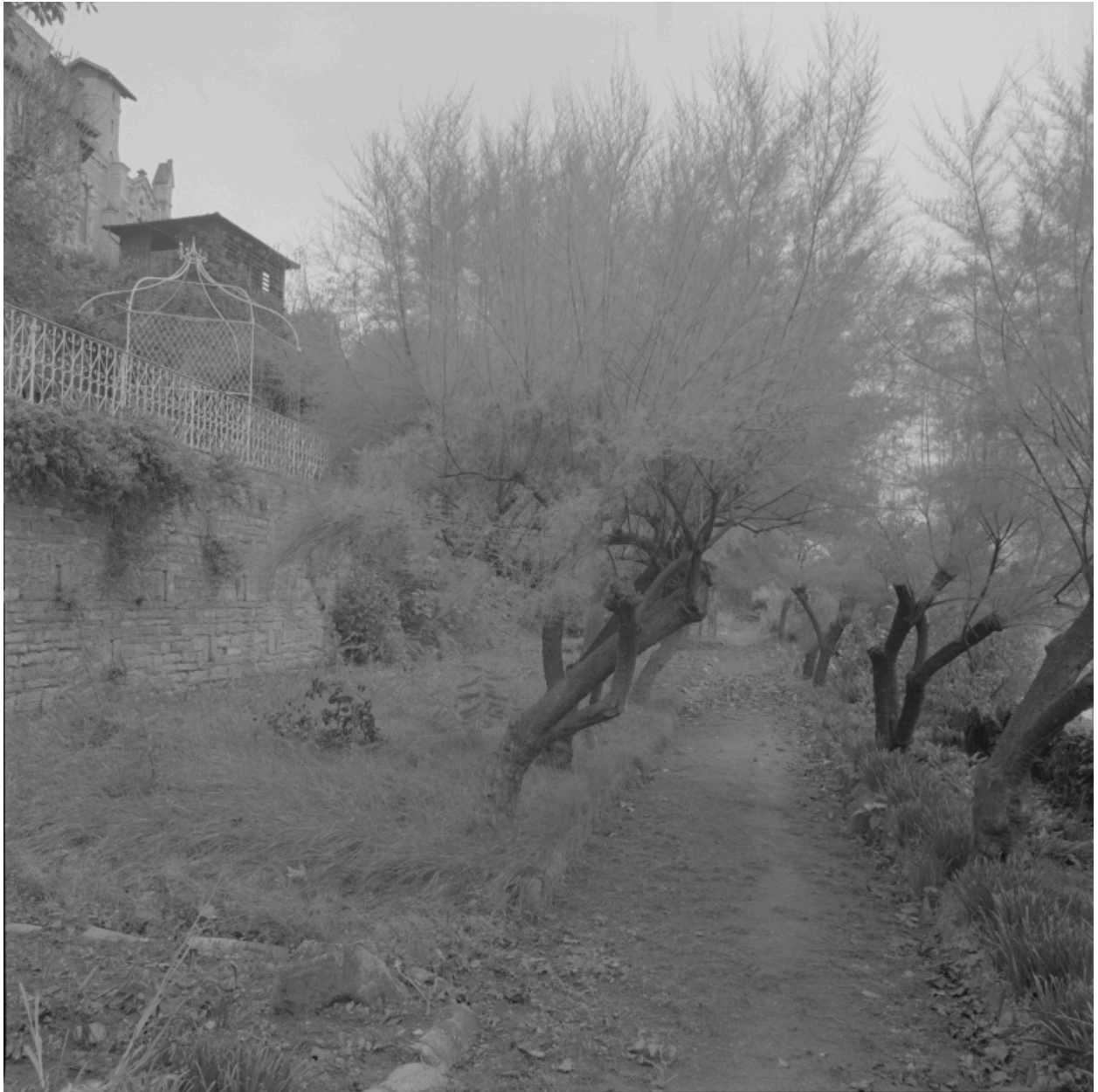
Jardin en terrasse, vue partielle.