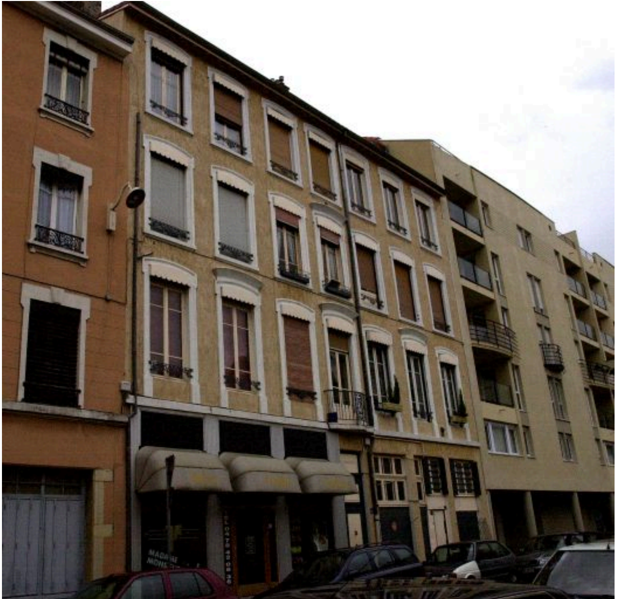
Vue générale, rue Smith, depuis le nord