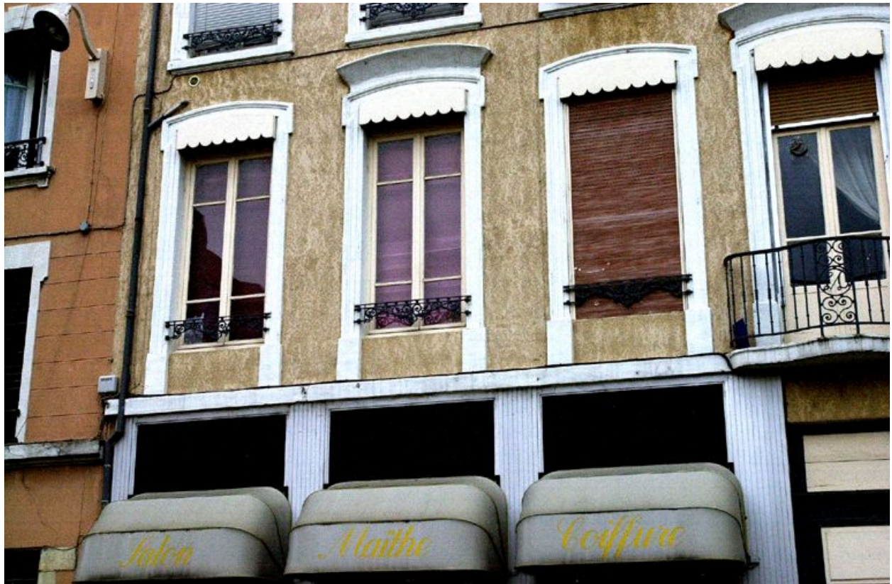
Élévation principale, détail des fenêtres du 1er étage