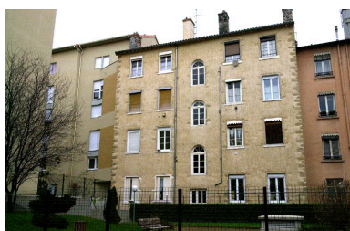
Elévation postérieure IVR82_20016900190NUCA