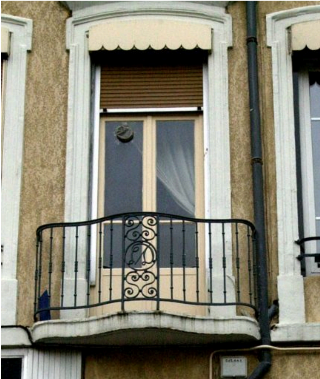
Elévation principale, détail du balcon au-dessus de la porte d'entrée