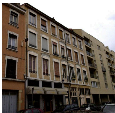
Vue générale, rue Smith, depuis le nord IVR82_20016900162NUCA