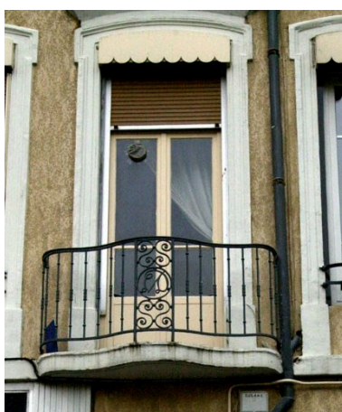
Elévation principale, détail du balcon au-dessus de la porte d'entrée IVR82_20016900163NUCA