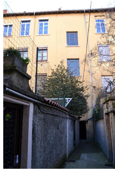
Façade ouest