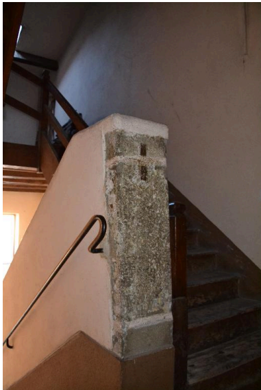
Escalier dernier niveau IVR82_20156900204NUCA