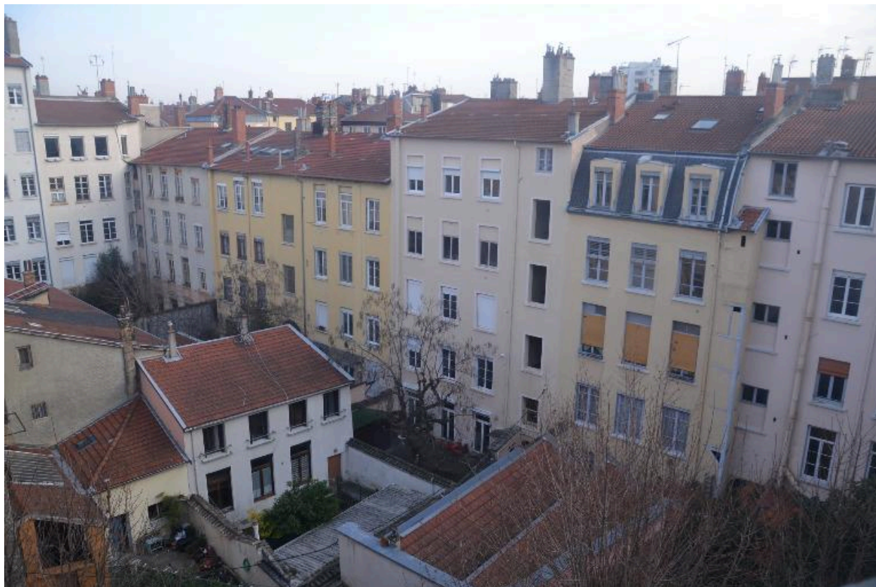
Vue d'ensemble façade ouest