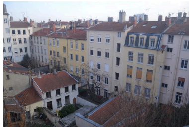
Vue d'ensemble façade ouest IVR82_20156900153NUCA