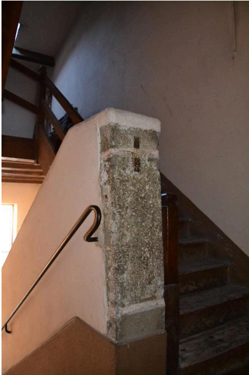
Escalier dernier niveau