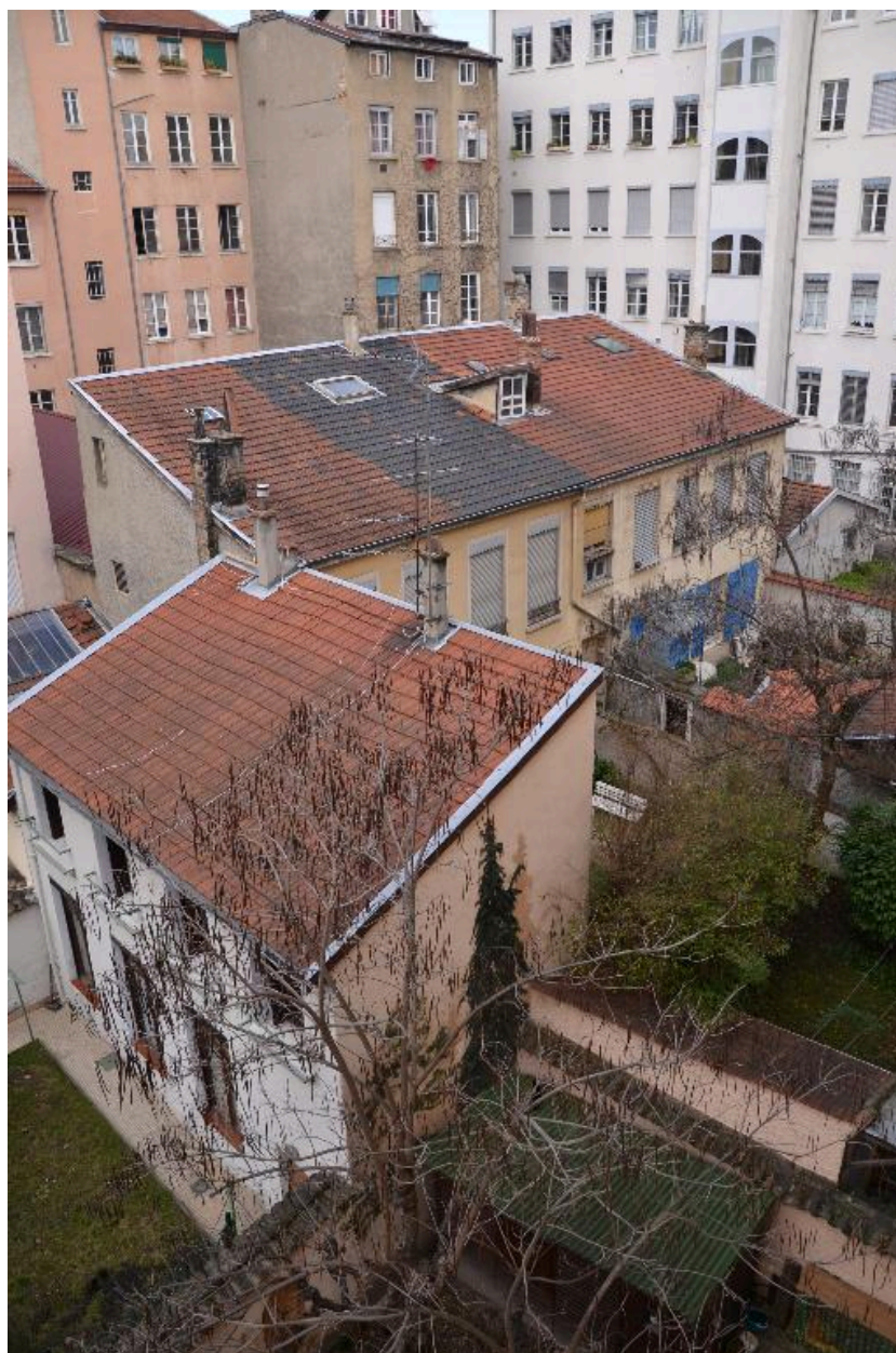
Vue général coeur de l'ilot