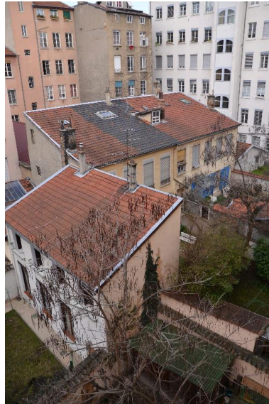
Vue général coeur de l'îlot IVR82_20156900188NUCA