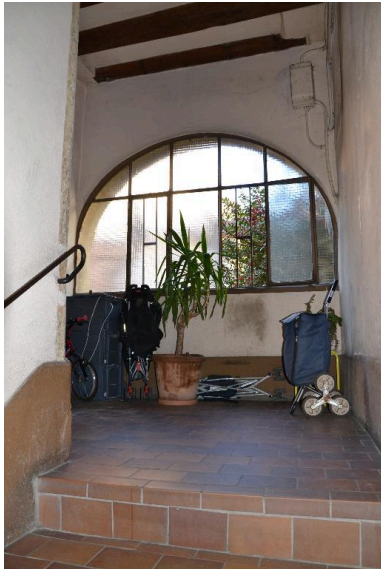
Baie escalier