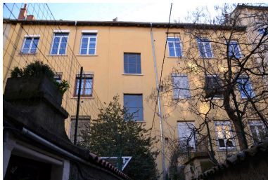
Façade ouest IVR82_20156900197NUCA