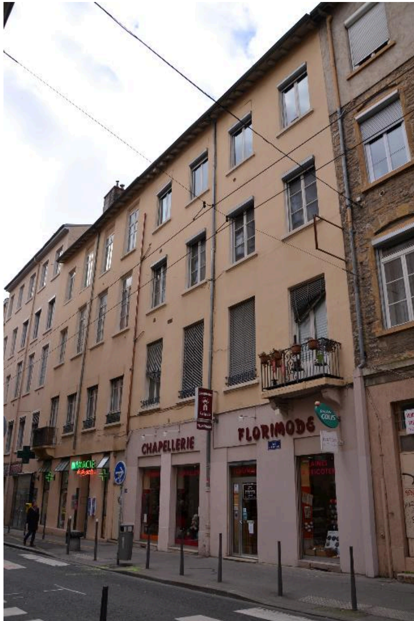
Vue d'ensemble façade est