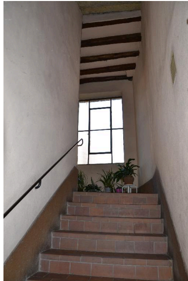
Escalier IVR82_20156900199NUCA