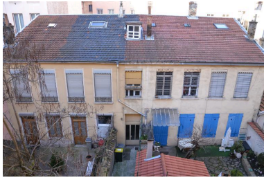
Immeuble en coeur d'îlot IVR82_20156900202NUCA