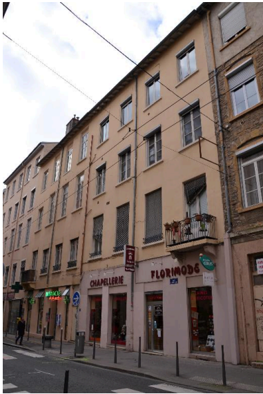
Vue d'ensemble façade est IVR82_20156900192NUCA