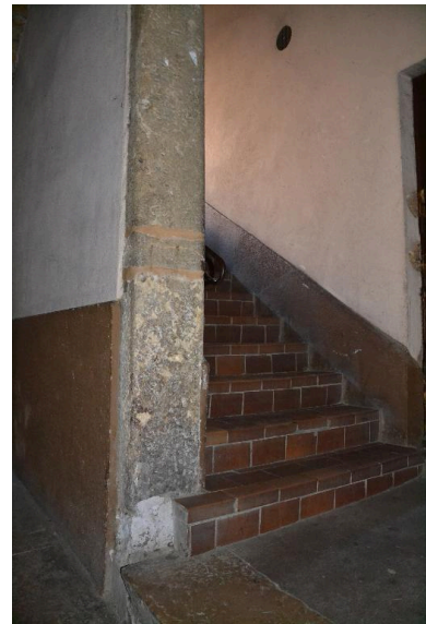
Départ escalier