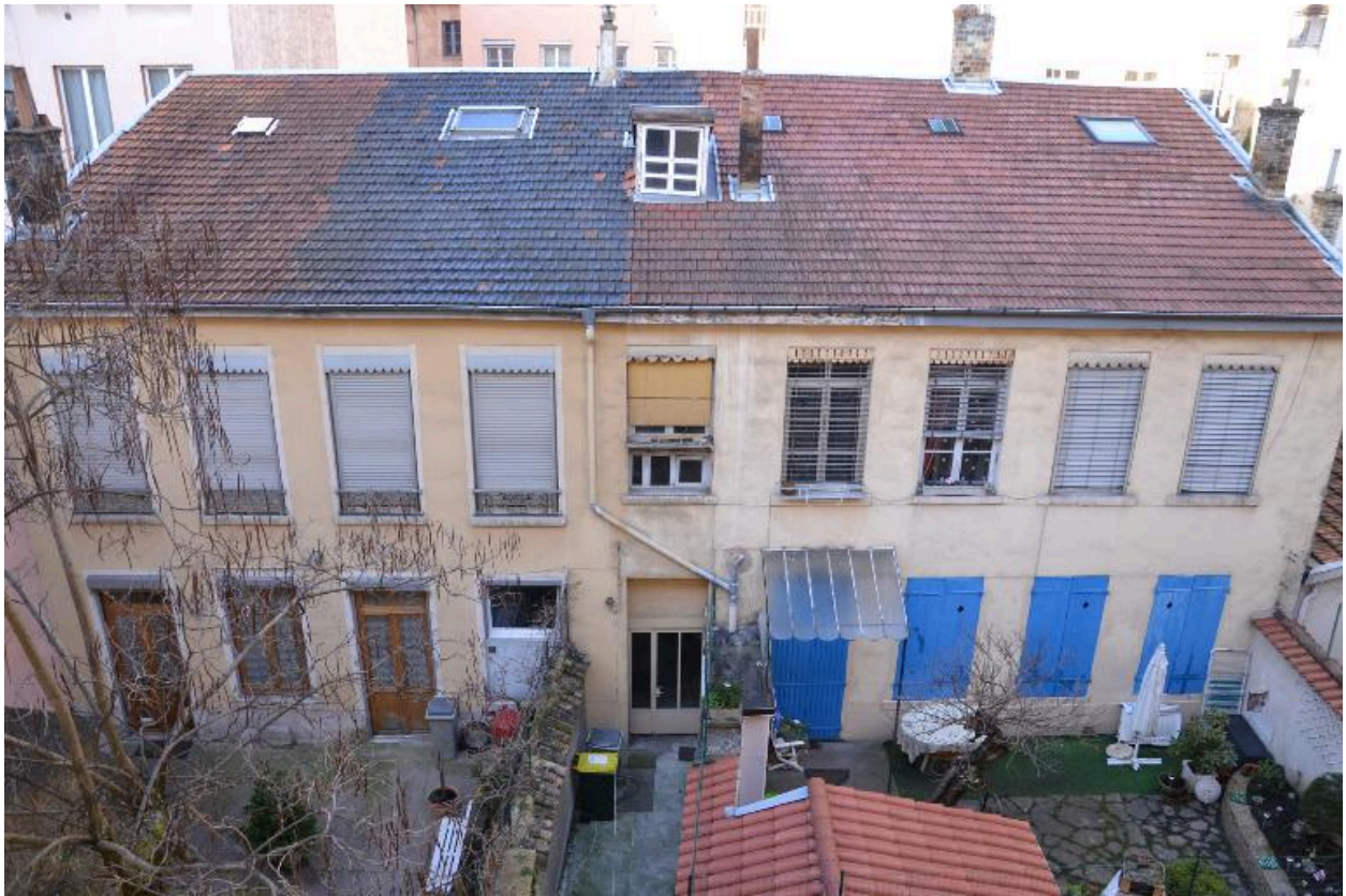
Immeuble en coeur d'ilot