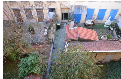
Jardins IVR82_20156900203NUCA