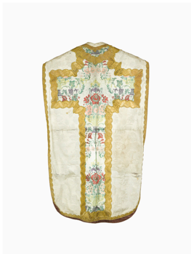
Vue du dos de la chasuble IVR84_20181500356NUC4A