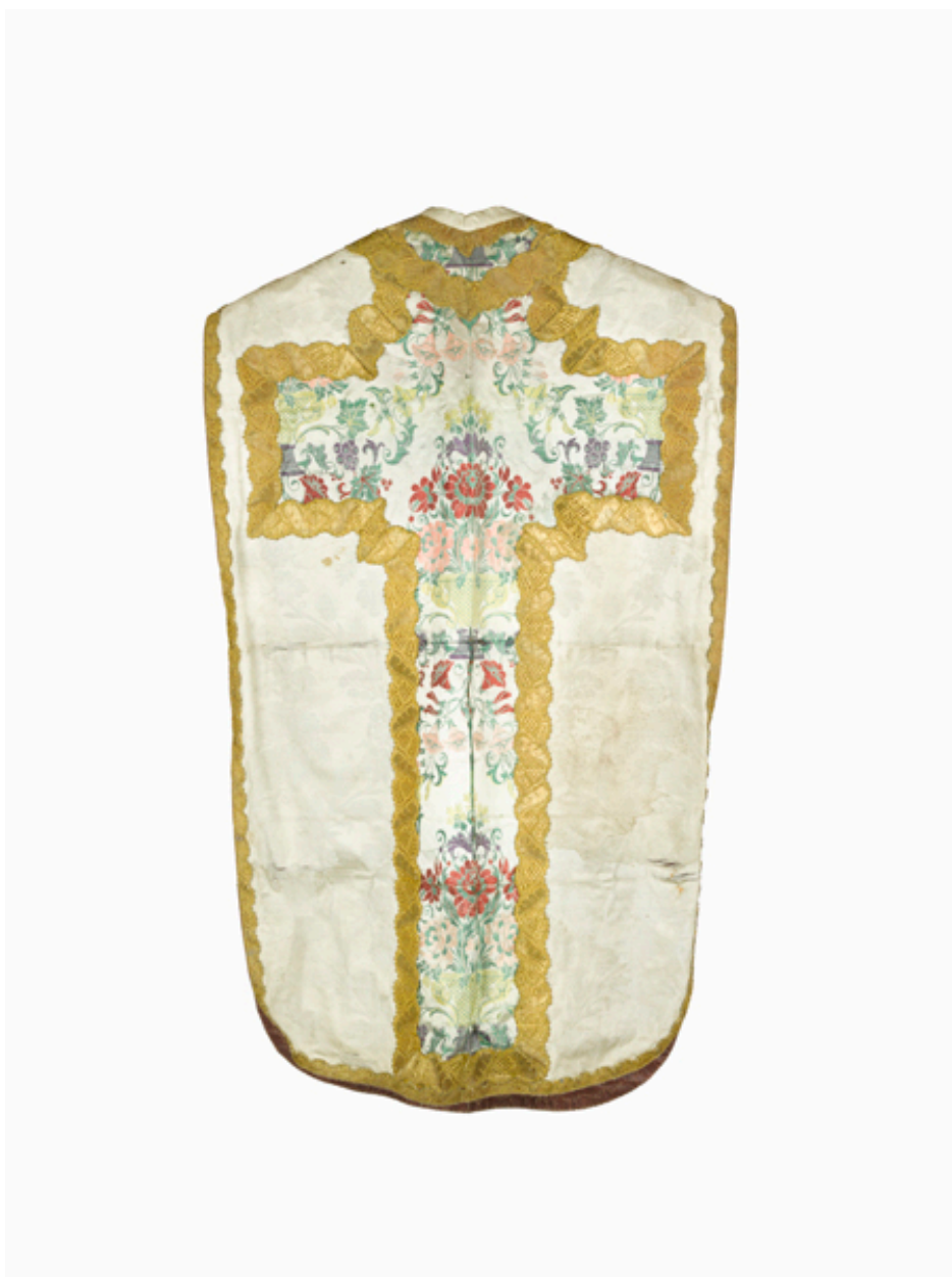
Vue du dos de la chasuble