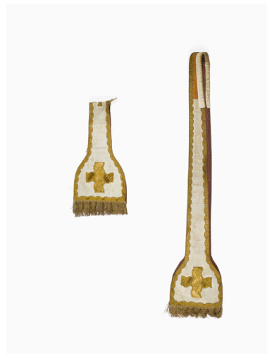
Vue de l'étole et du manipule IVR84_20181500360NUC4A