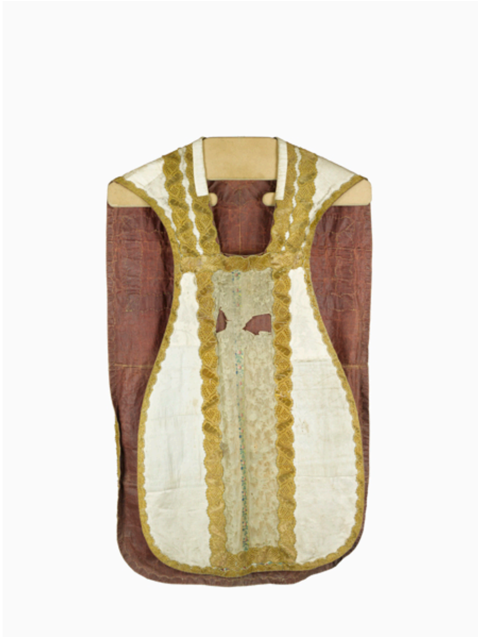
Vue du devant de la chasuble