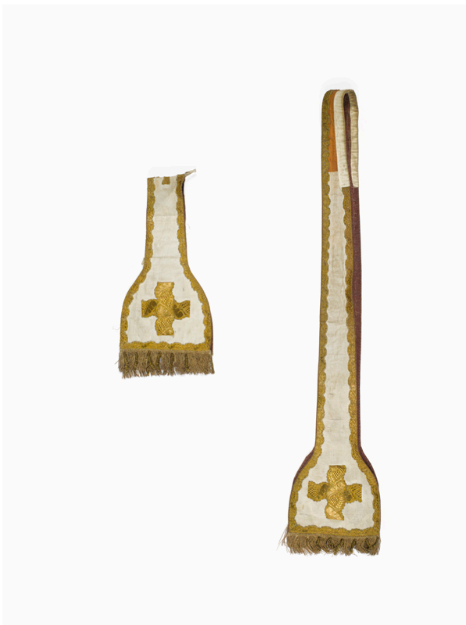
Vue de l'étole et du manipule