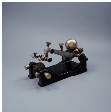
Scie à diamant.