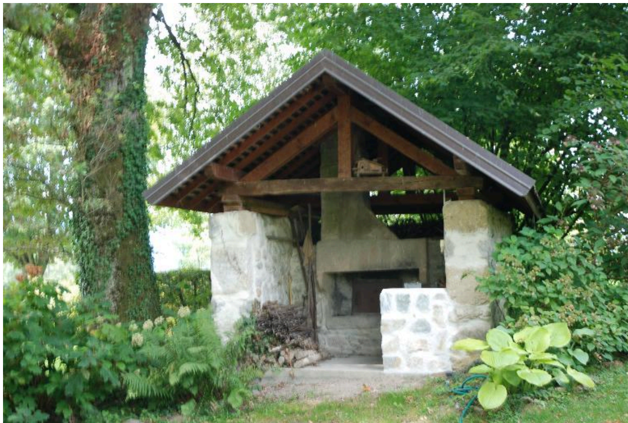
Four à pain au Gaillo (2015 A2 96), non repéré.