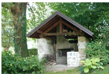
Four à pain au Gaillo (2015 A2 96), non repéré.