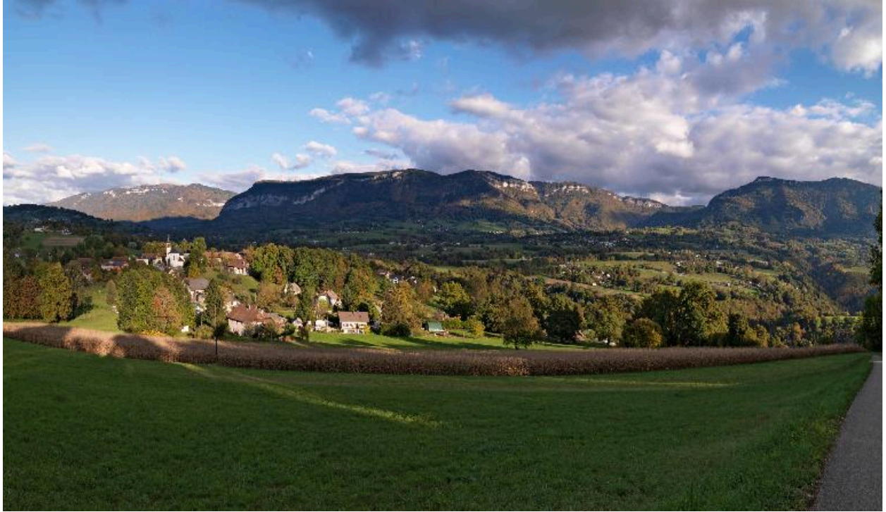
Vue générale de la partie nord-est de la commune depuis la route montant à la ferme des Donchettes.