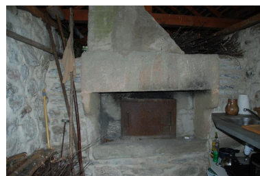
Four à pain au Gaillo (2015 A2 96), non repéré : détail.