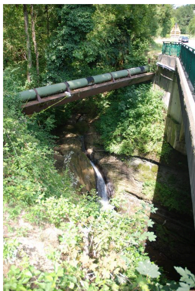
Vue du pont de la Monderesse, Chez Prima (près du moulin de la Verdasse).