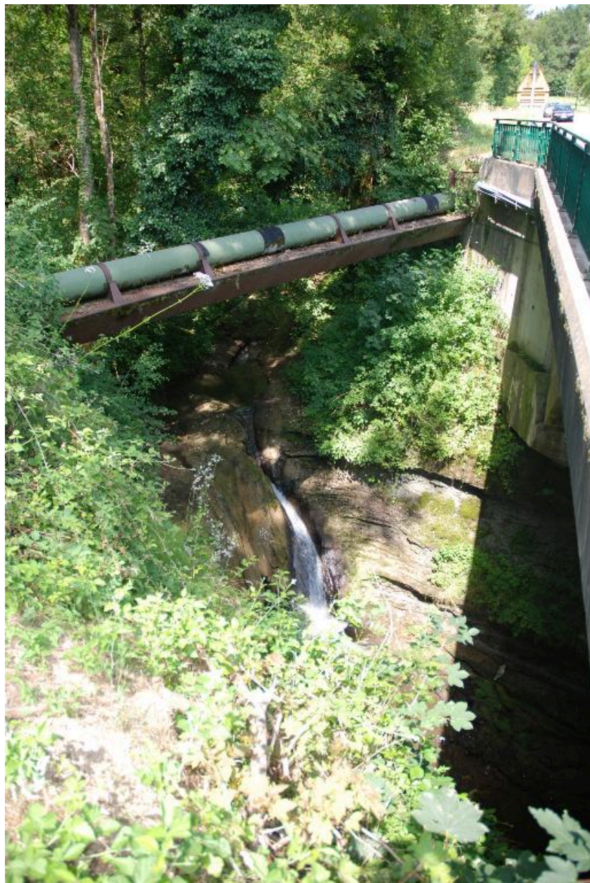
Vue du pont de la Monderesse, Chez Prima (près du moulin de la Verdasse).