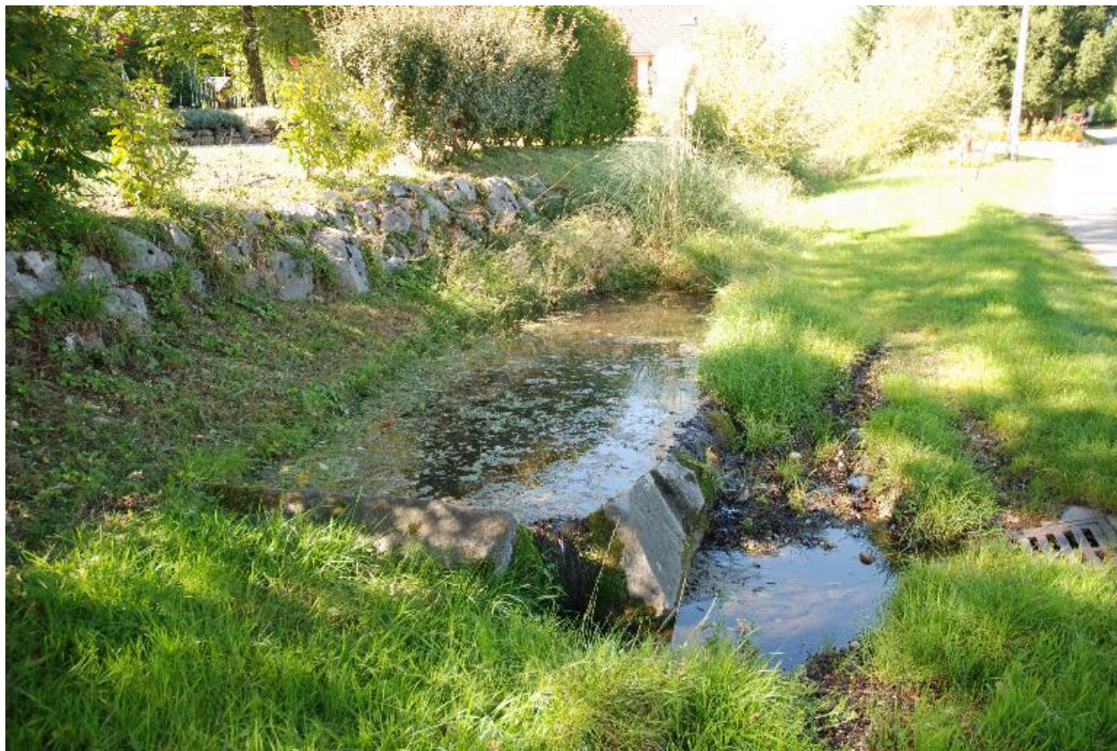
Vue du lavoir au Novelet (vers 2015 A5 1631).