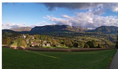
Vue générale de la partie nord-est de la commune depuis la route montant à la ferme des Donchettes. IVR84_20167303789NUCAQ