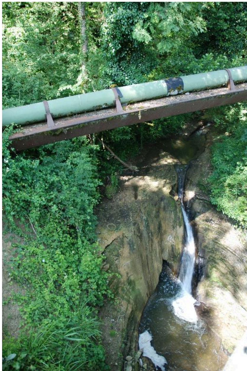
Vue du pont de la Monderesse, Chez Prima (près du moulin de la Verdasse).