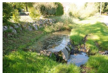
Vue du lavoir au Novelet (vers 2015 A5 1631).