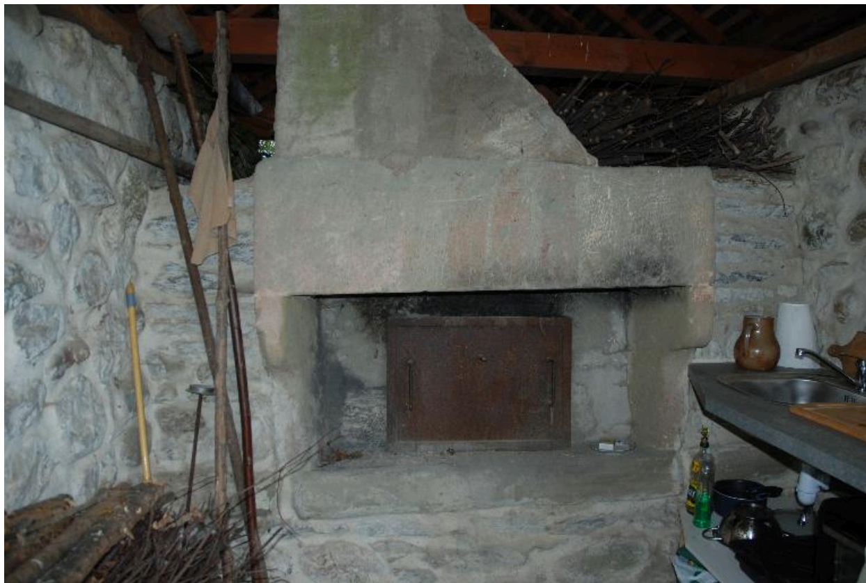
Four à pain au Gaillo (2015 A2 96), non repéré : détail.