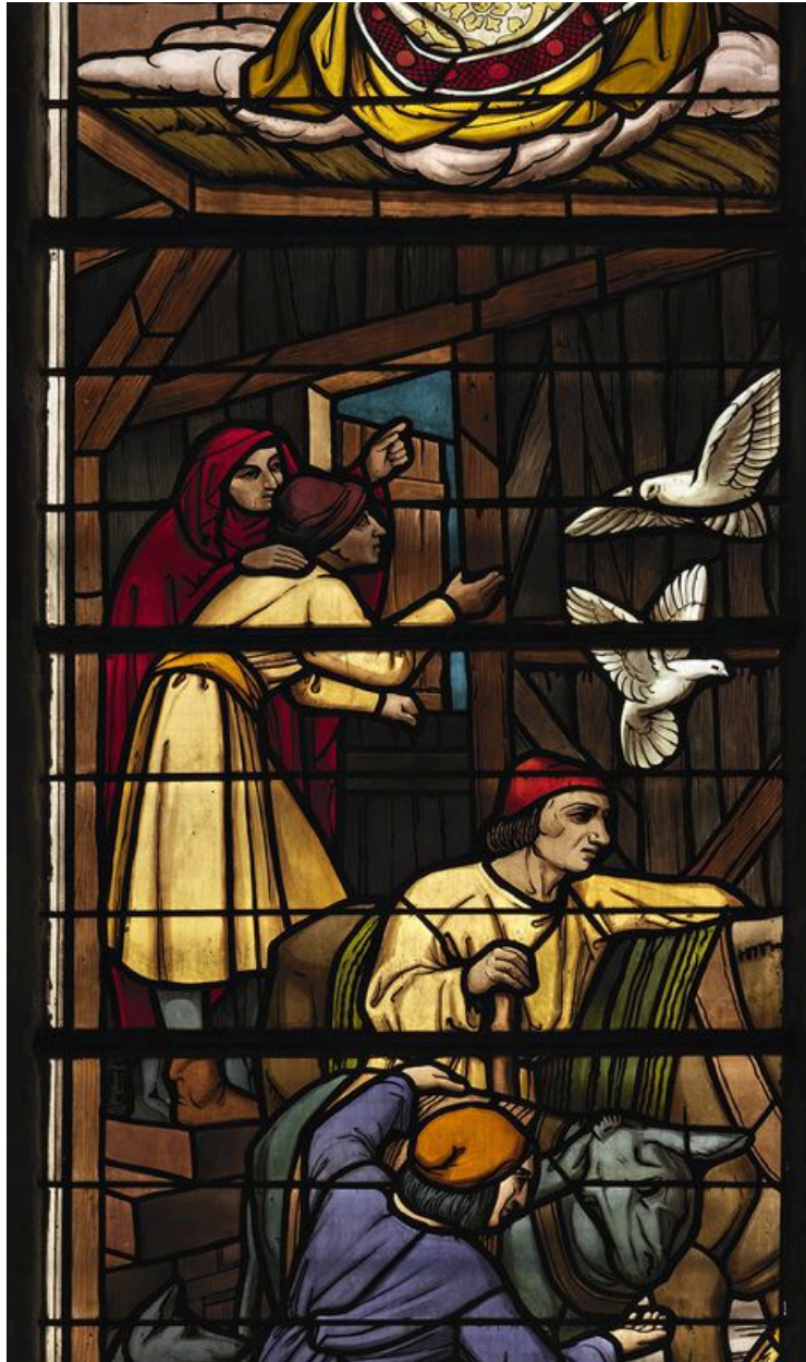
Détail des bergers.