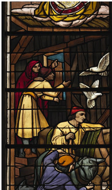
Détail des bergers. IVR82_20126901706NUCA