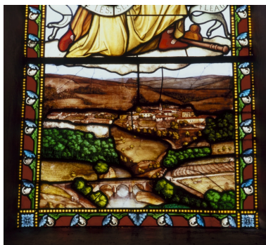
Détail de la partie basse du vitrail : village de Leigneux.