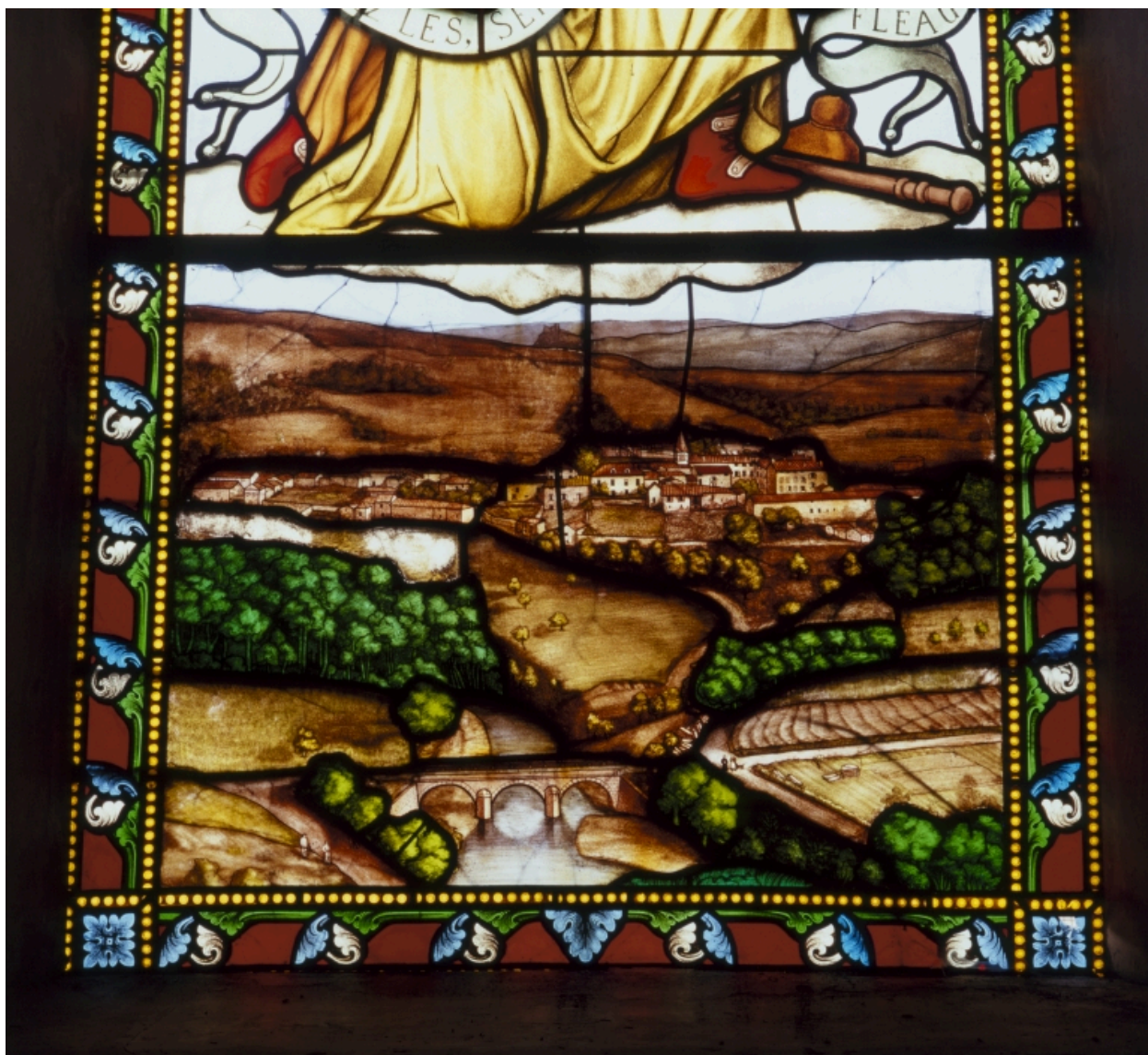
Détail de la partie basse du vitrail : village de Leigneux.