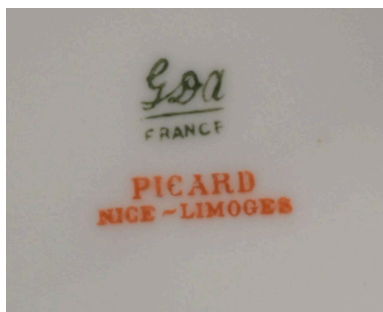
Détail - marque GDA IVR84_20226302693NUC4A