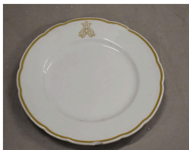
Vue générale IVR84_20226302690NUC4A