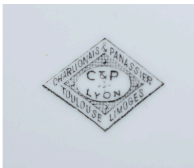
Détail - marque Panassier IVR84_20226302691NUC4A