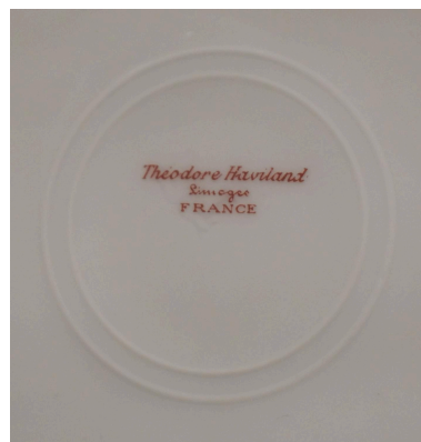
Détail - marque Haviland IVR84_20226302692NUC4A