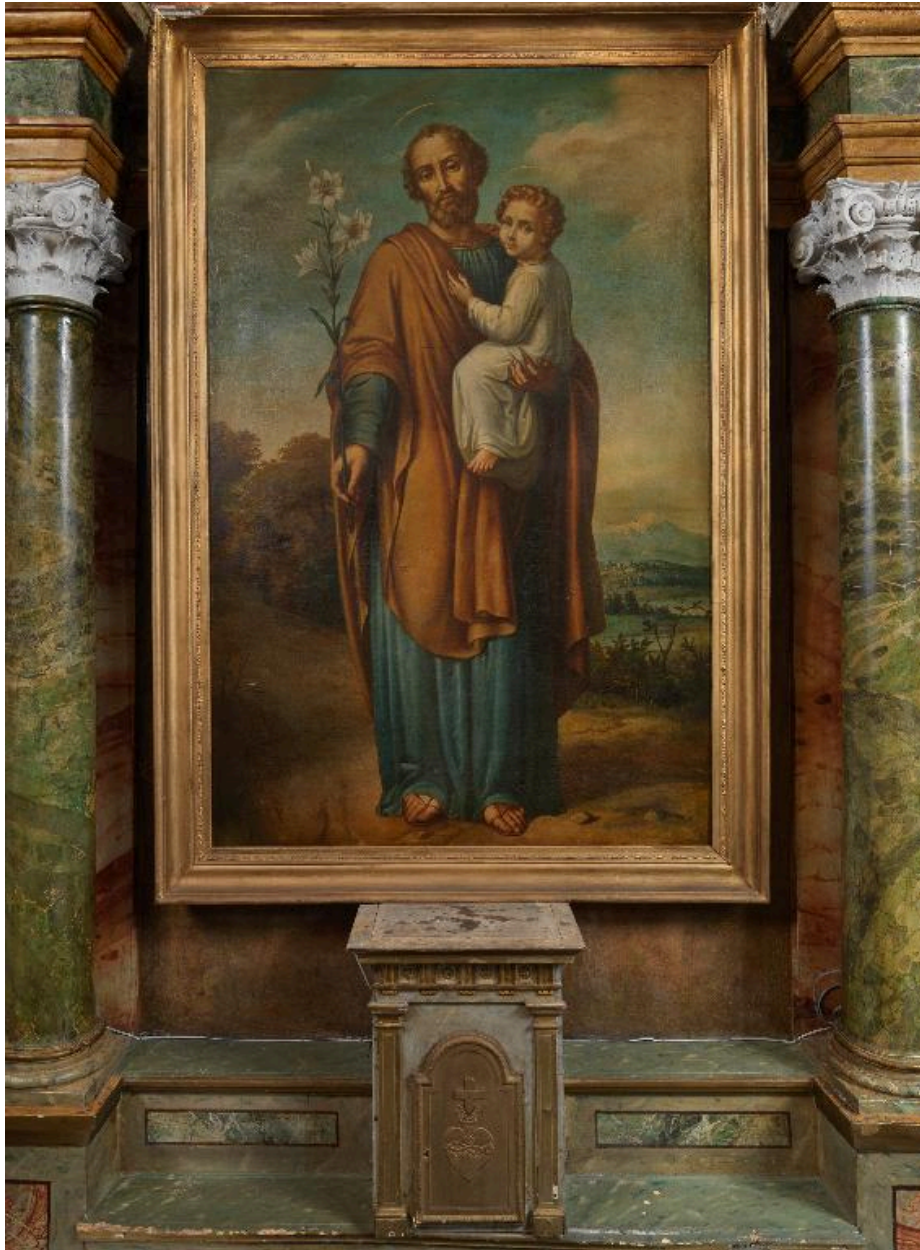
Vue du tableau de saint Joseph et l'Enfant.