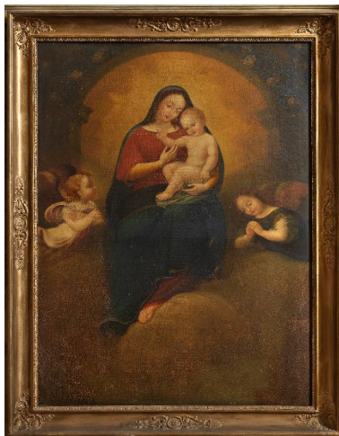
Vue du tableau de la Vierge à l'Enfant. IVR82_20157303601NUCAQ