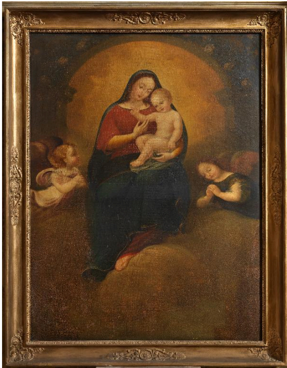
Vue du tableau de la Vierge à l'Enfant.