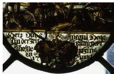
Baie 3