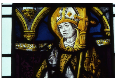
Baie 3 IVR82_19847400158ZA