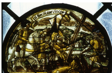
Baie 3 IVR82_19847400138ZA