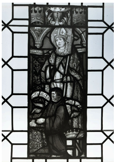
Baie 3