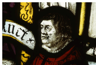
Baie 3 IVR82_19847400160ZA