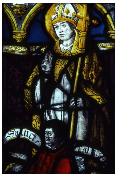
Baie 3 IVR82_19847400156ZA