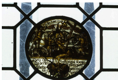
Baie 3 IVR82_19847400137ZA