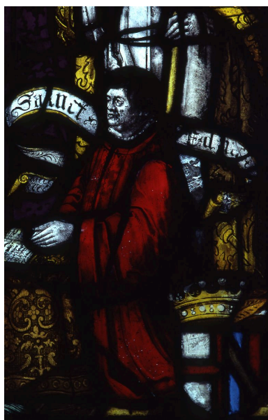
Baie 3 IVR82_19847400155ZA