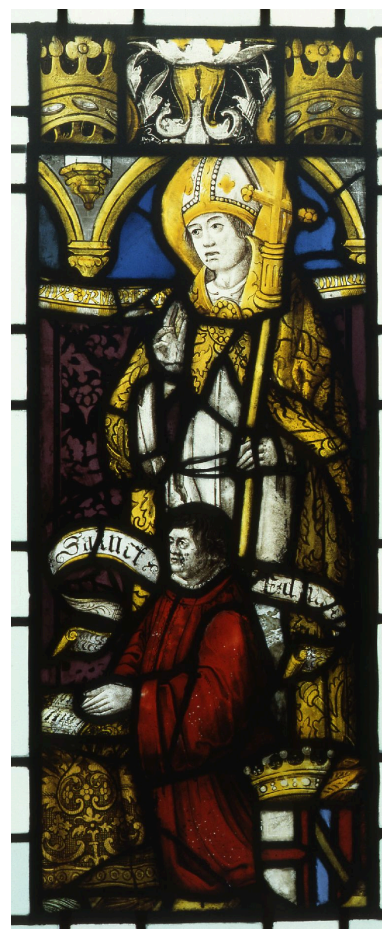
Baie 3 IVR82_19847400134XA