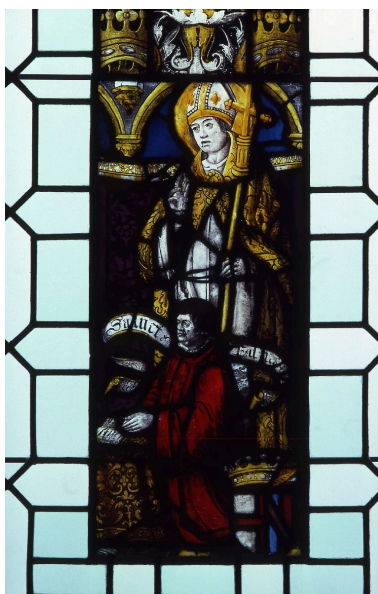
Baie 3