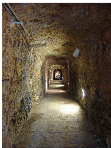
Galerie d'accès à la source IVR82_20067300417NUCA