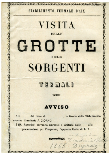
Affichette pour visite IVR82_20117300660NUCB