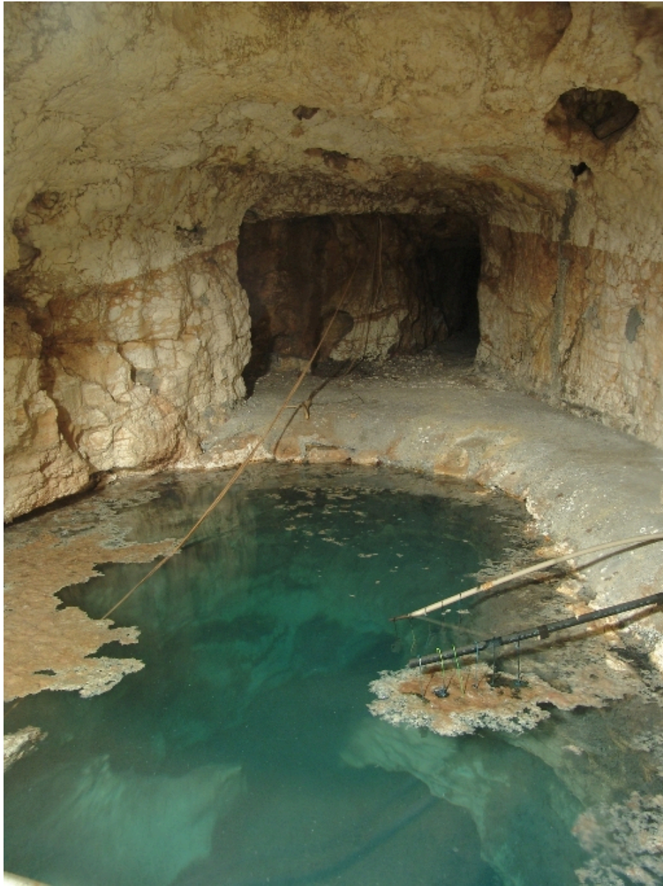
Captage de la source