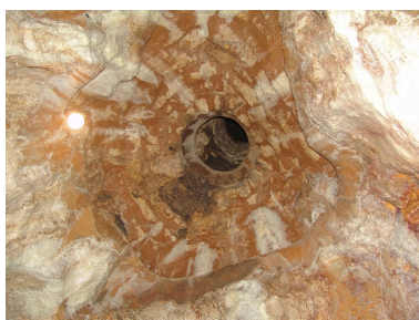
Puits d'enfer IVR82_20067300419NUCA