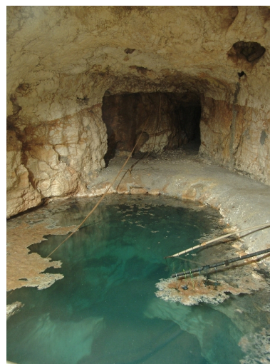
Captage de la source