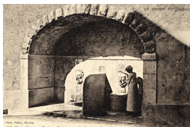
Vue d'ensemble IVR82_20087300805NUCB