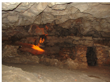
Vue intérieure IVR82_20087300838NUCA