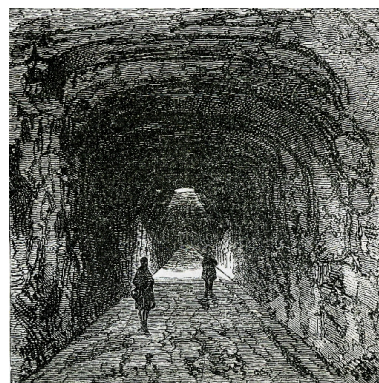
Galerie de captage de la source Saint-Paul.