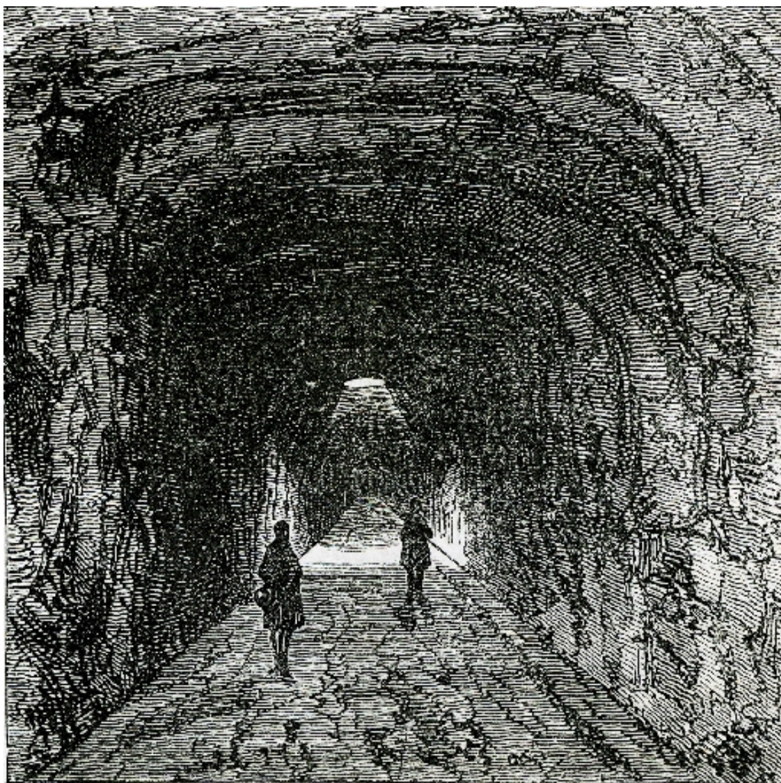
Galerie de captage de la source Saint-Paul.