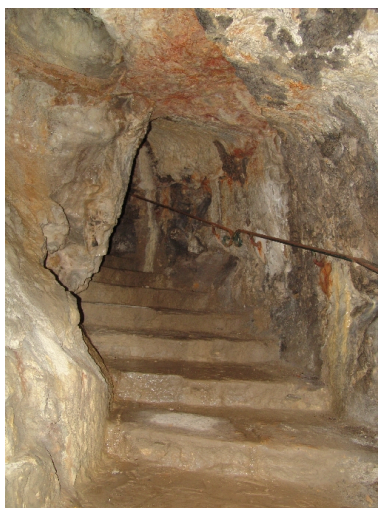
Escalier intérieur