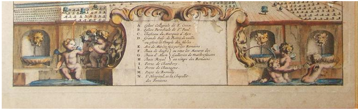
Détail du cartouche du Theatrum Sabaudiae, 1674