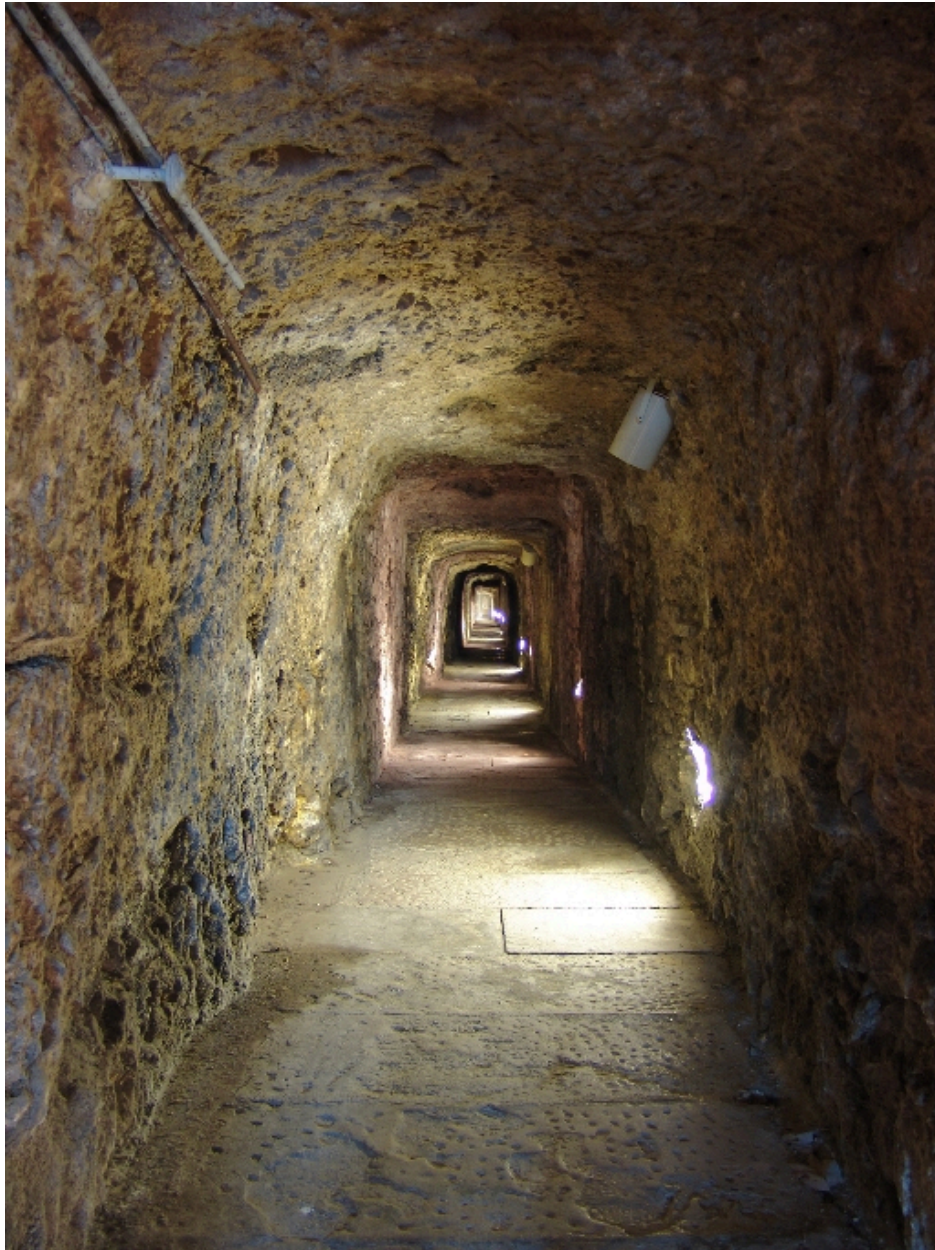
Galerie d'accès à la source