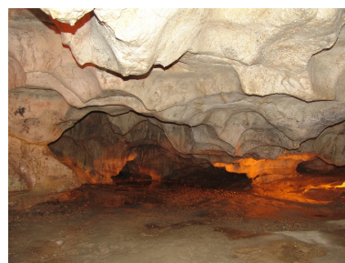
Grotte IVR82_20067300420NUCA