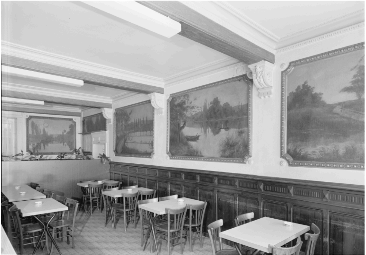
Vue depuis l'entrée, 3/4 droit.