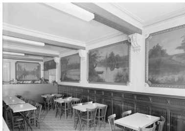
Vue depuis l'entrée, 3/4 droit. IVR82_19910100537P