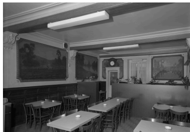
Vue depuis l'entrée, 3/4 gauche. IVR82_19910100538P