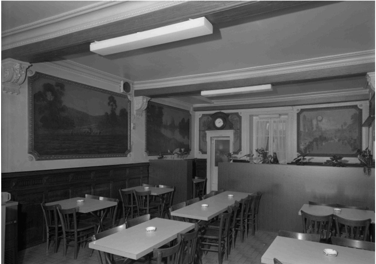
Vue depuis l'entrée, 3/4 gauche.