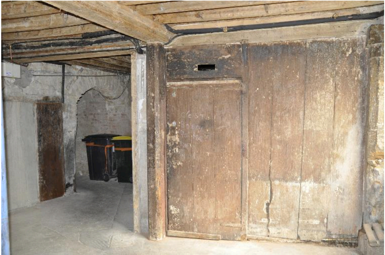
Vue de l'allée depuis le départ de l'escalier