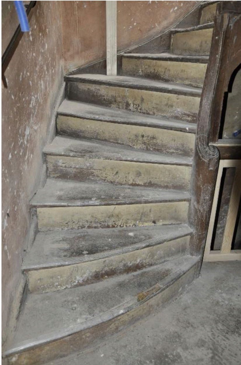
Vue de la seconde volée de l'escalier