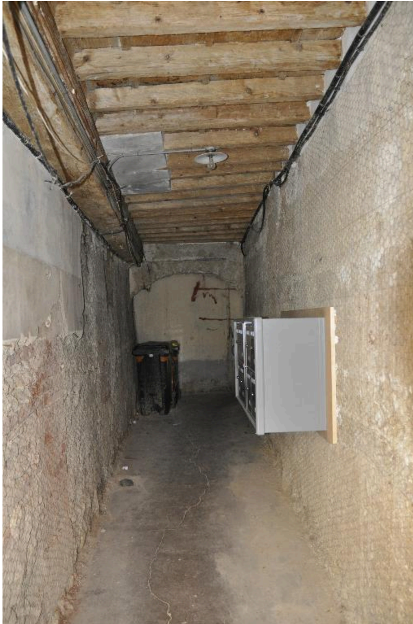
Vue de l'allée depuis l'entrée