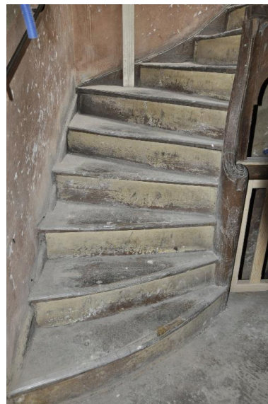
Vue de la seconde volée de l'escalier IVR82_20146900330NUCA