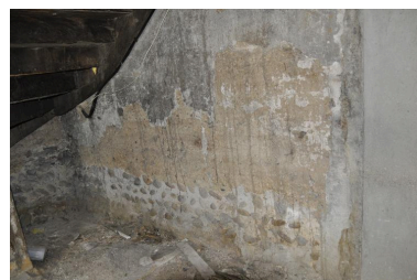
Vue sous l'escalier de la structure en pisé