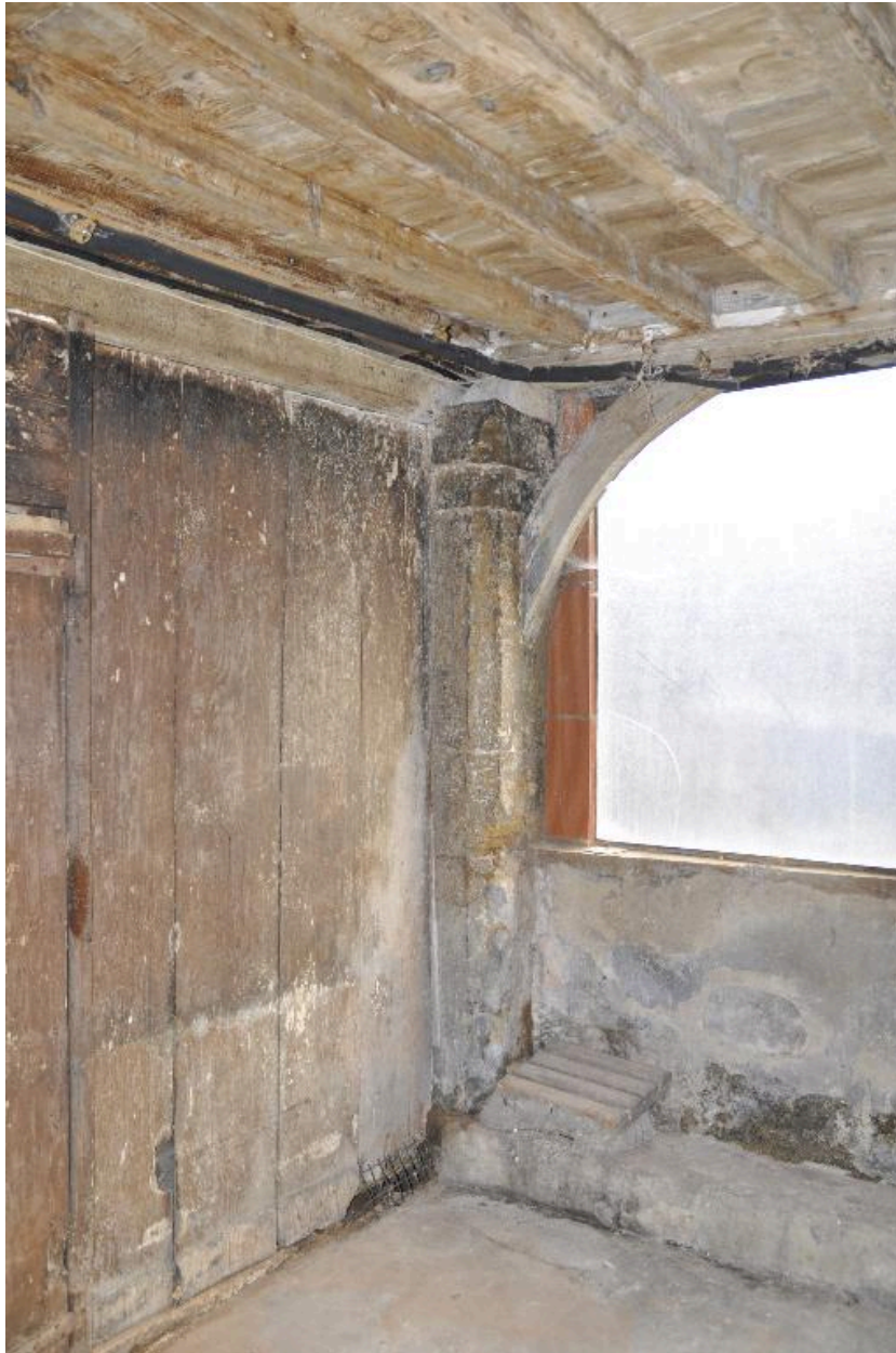
Vue de l'allée depuis l'escalier