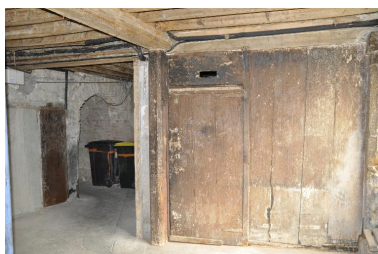
Vue de l'allée depuis le départ de l'escalier