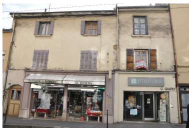
Vue d'ensemble ouest de l'immeuble d'une travée IVR82_20146900520NUCA