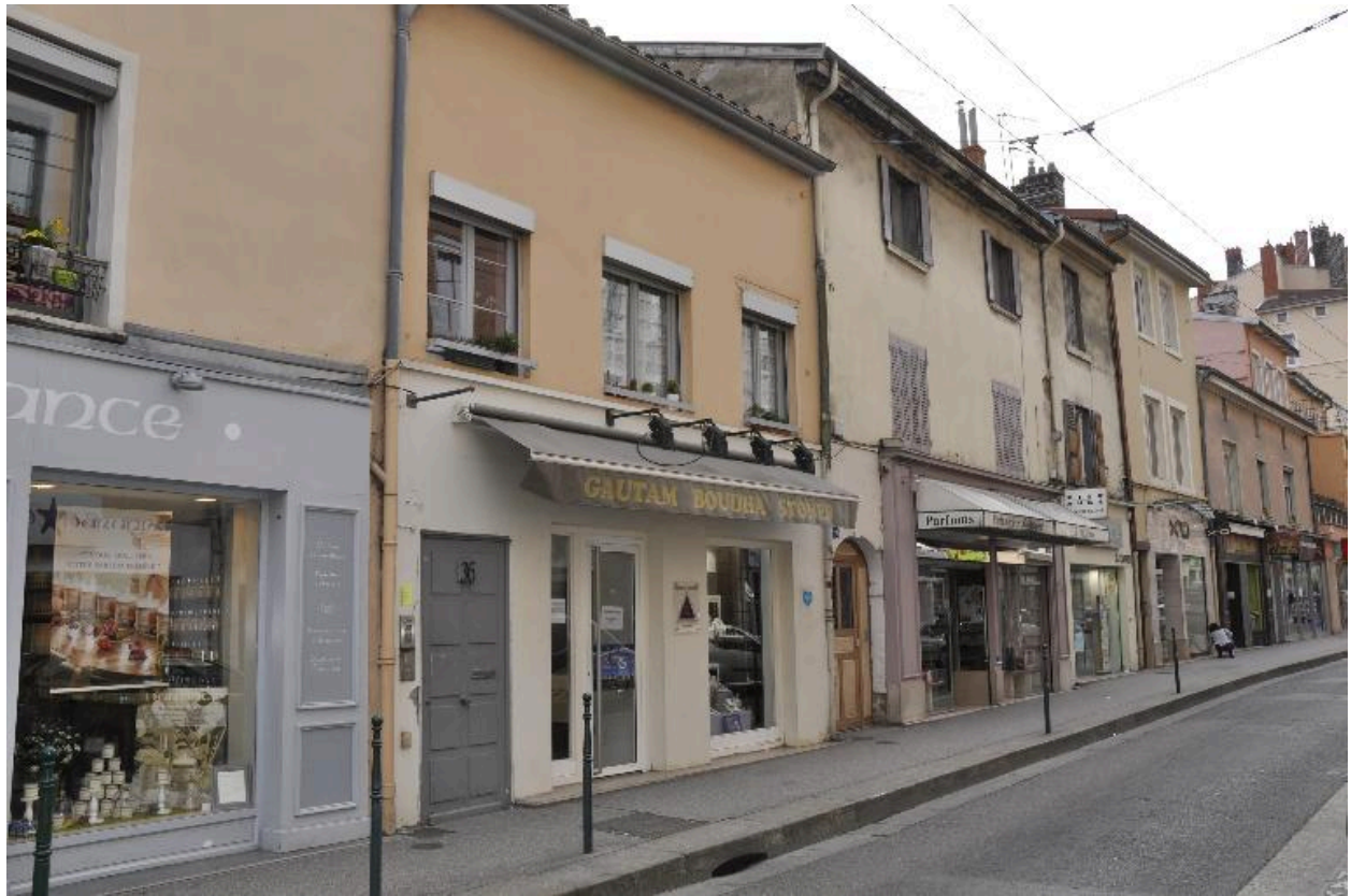
Vue d'ensemble nord ouest de l'immeuble de deux étages