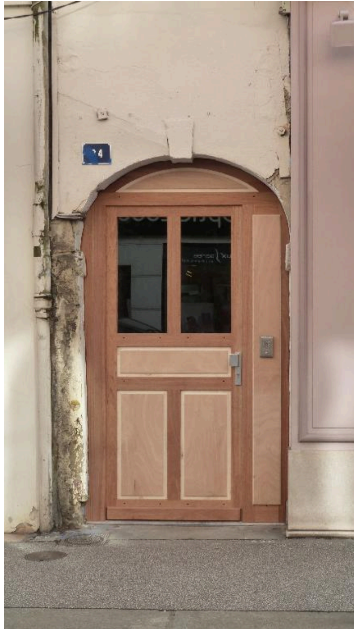
Vue de la porte