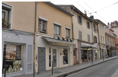
Vue d'ensemble nord ouest de l'immeuble de deux étages IVR82_20146900321NUCA