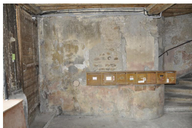
Vue de l'allée