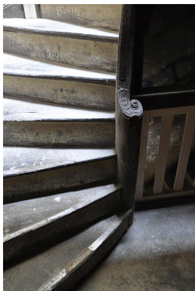
Vue de la rampe de l'escalier IVR82_20146900331NUCA