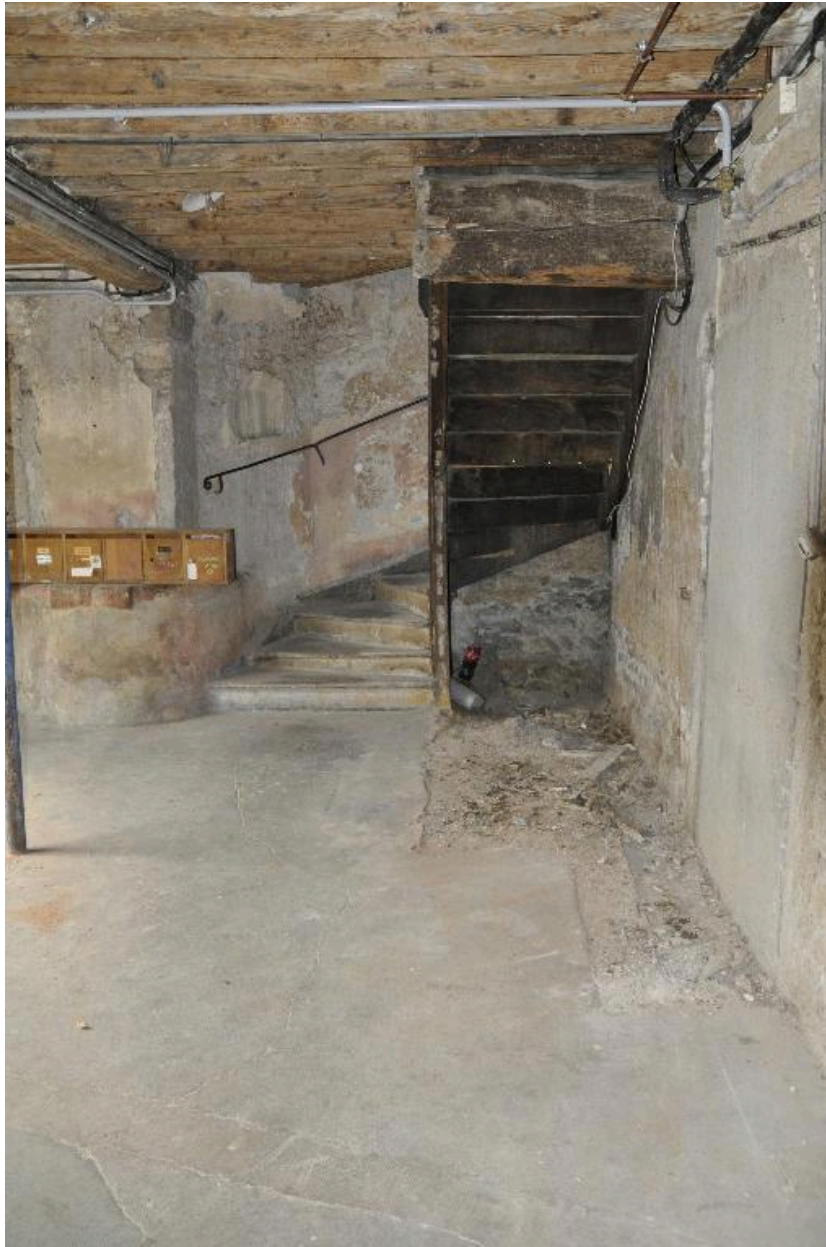
Vue du départ de l'escalier depuis l'allée