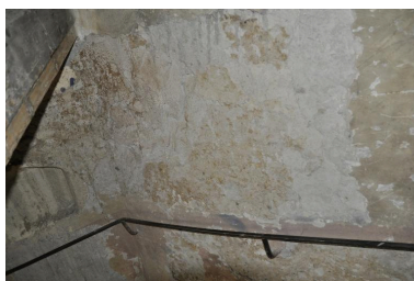
Détail du mur de la cage d'escalier