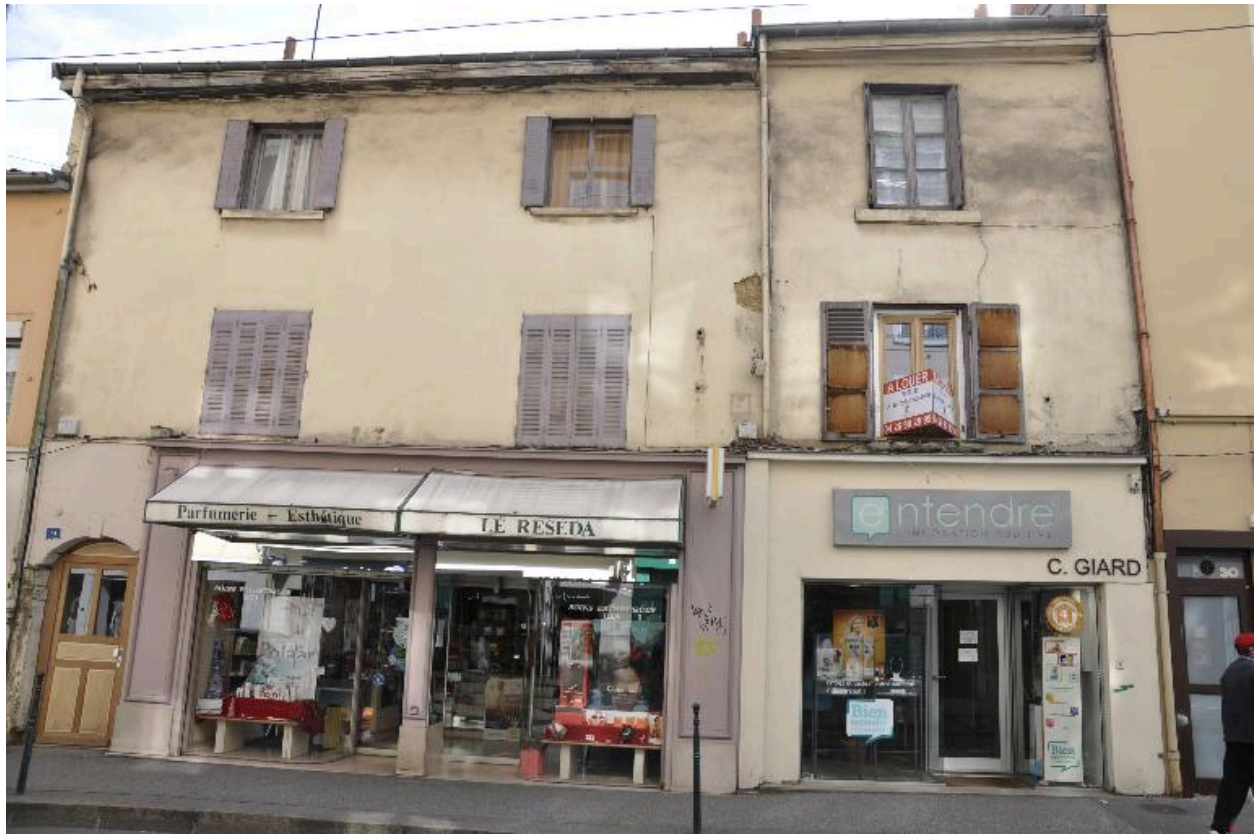
Vue d'ensemble ouest de l'immeuble d'une travée