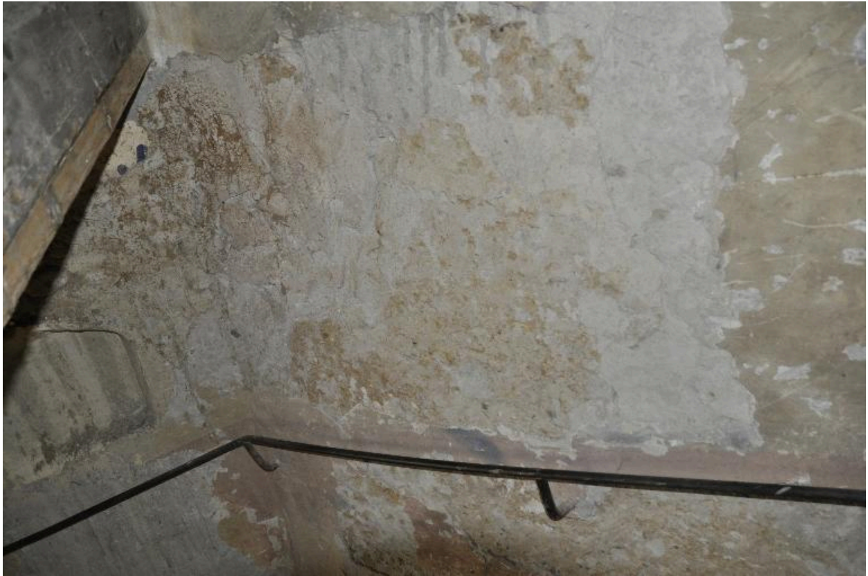
Détail du mur de la cage d'escalier