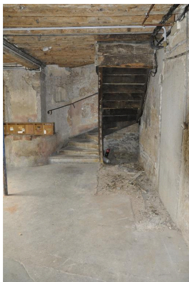
Vue du départ de l'escalier depuis l'allée IVR82_20146900324NUCA