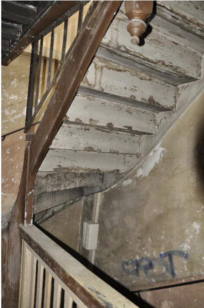
Vue de l'escalier depuis le palier