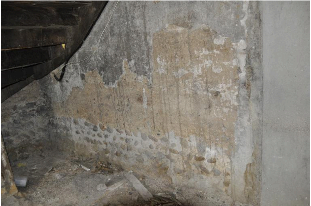
Vue sous l'escalier de la structure en pisé