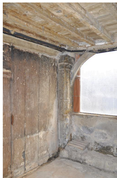
Vue de l'allée depuis l'escalier IVR82_20146900333NUCA