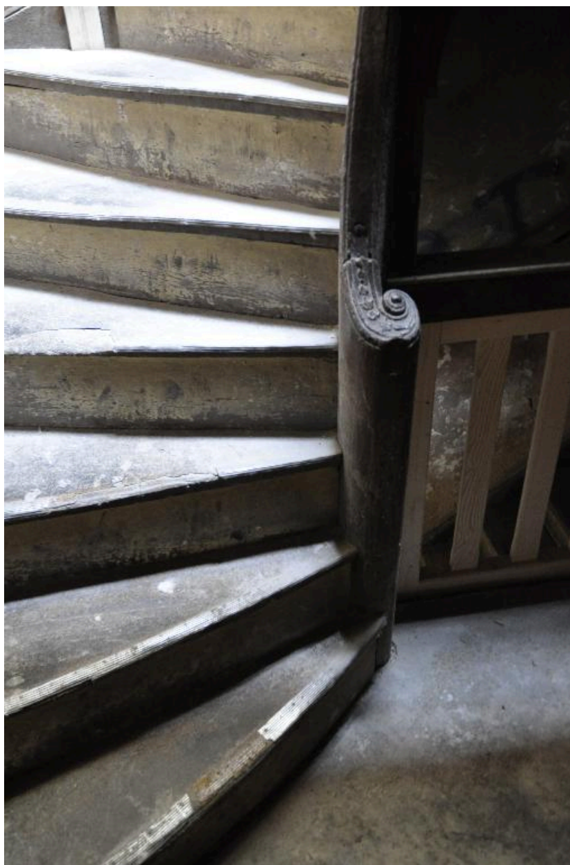
Vue de la rampe de l'escalier