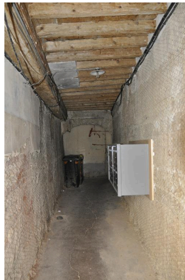
Vue de l'allée depuis l'entrée