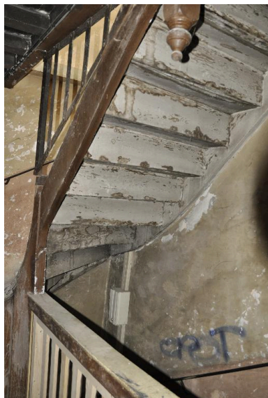
Vue de l'escalier depuis le palier IVR82_20146900327NUCA