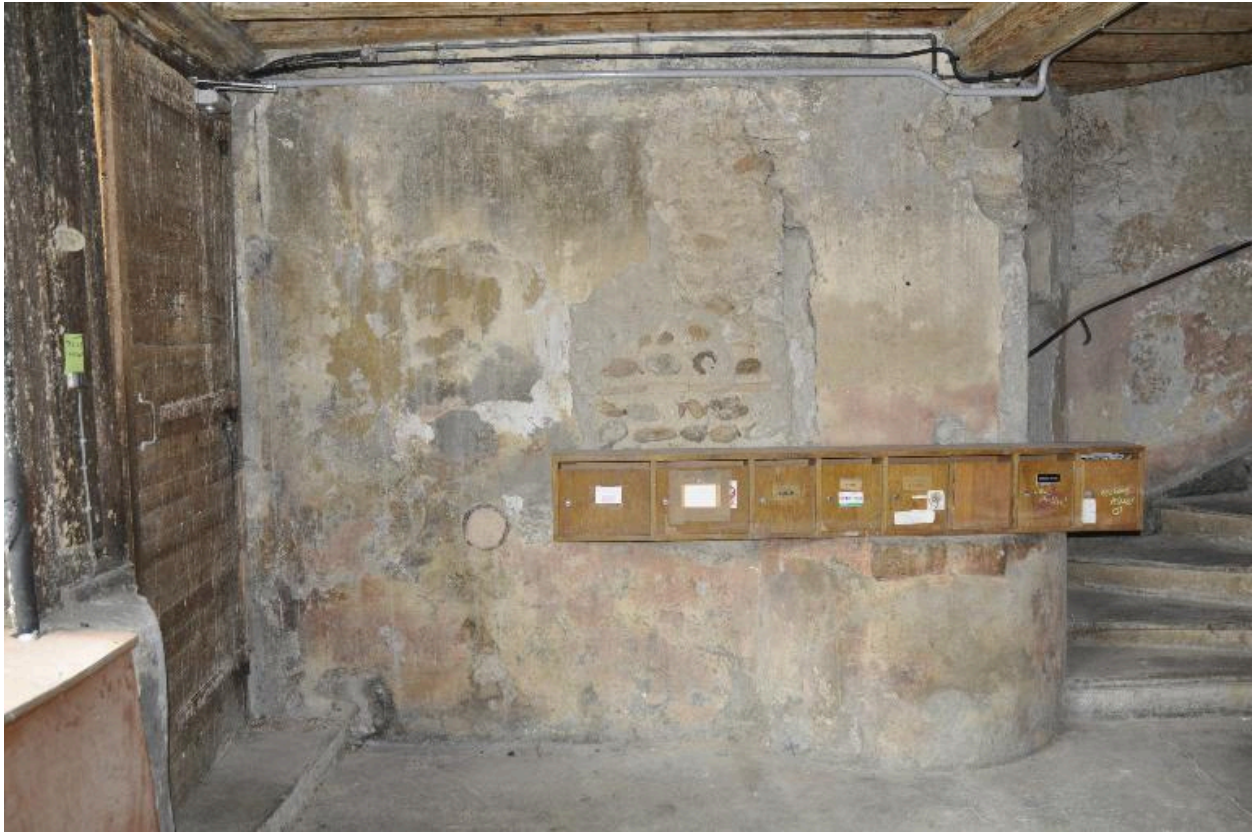
Vue de l'allée