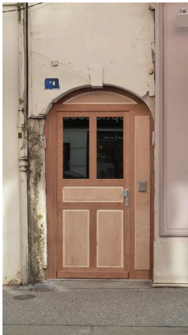
Vue de la porte