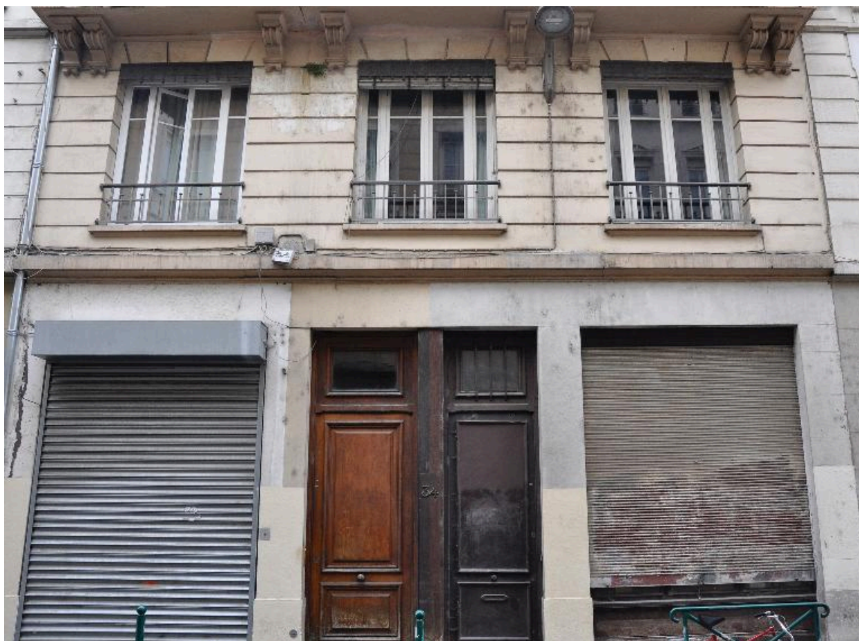
Vue rapprochée du rez-de-chaussée