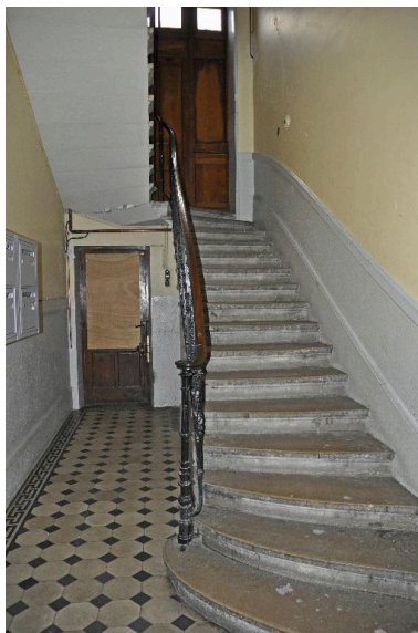
Vue intérieure : le départ de l'escalier