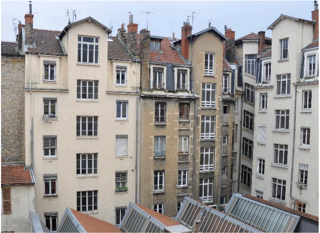
Vue d'ensemble de l'élévation sur cour