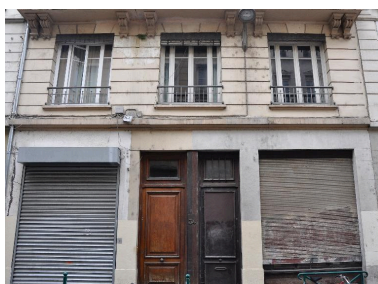
Vue rapprochée du rez-de-chaussée