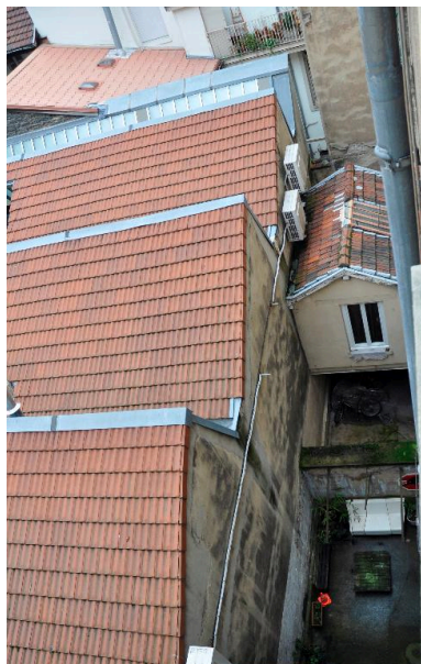
Vue de la cour et de la loge en encorbellement IVR82_20146902920NUCA