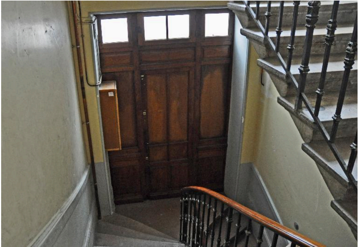
Vue intérieure : porte de la loge de concierge au niveau du premier repos