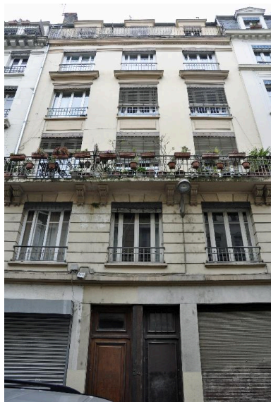
Vue générale de l'élévation sur rue