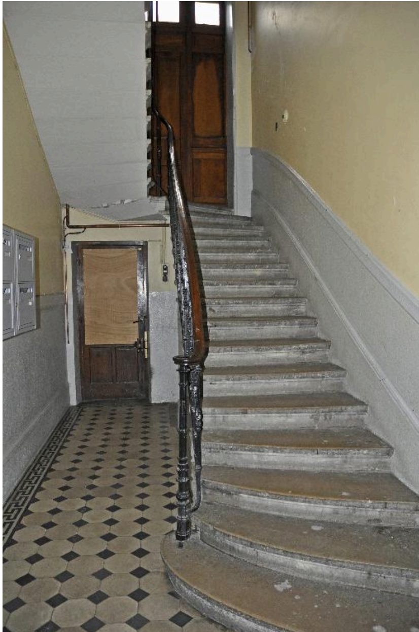
Vue intérieure : le départ de l'escalier