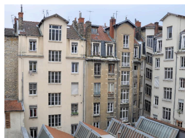
Vue d'ensemble de l'élévation sur cour IVR82_20146902943NUCA