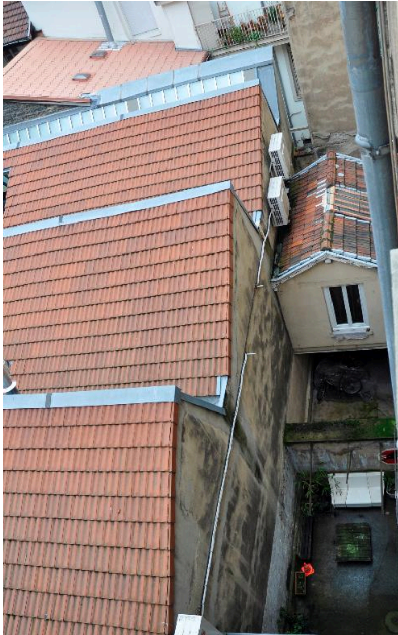
Vue de la cour et de la loge en encorbellement