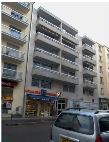
Elévation antérieure, depuis le sud-ouest IVR82_20116904085NUCA