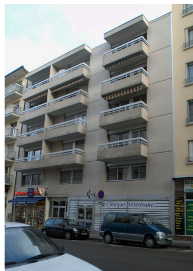
Elévation antérieure, depuis le sud-est IVR82_20116904086NUCA