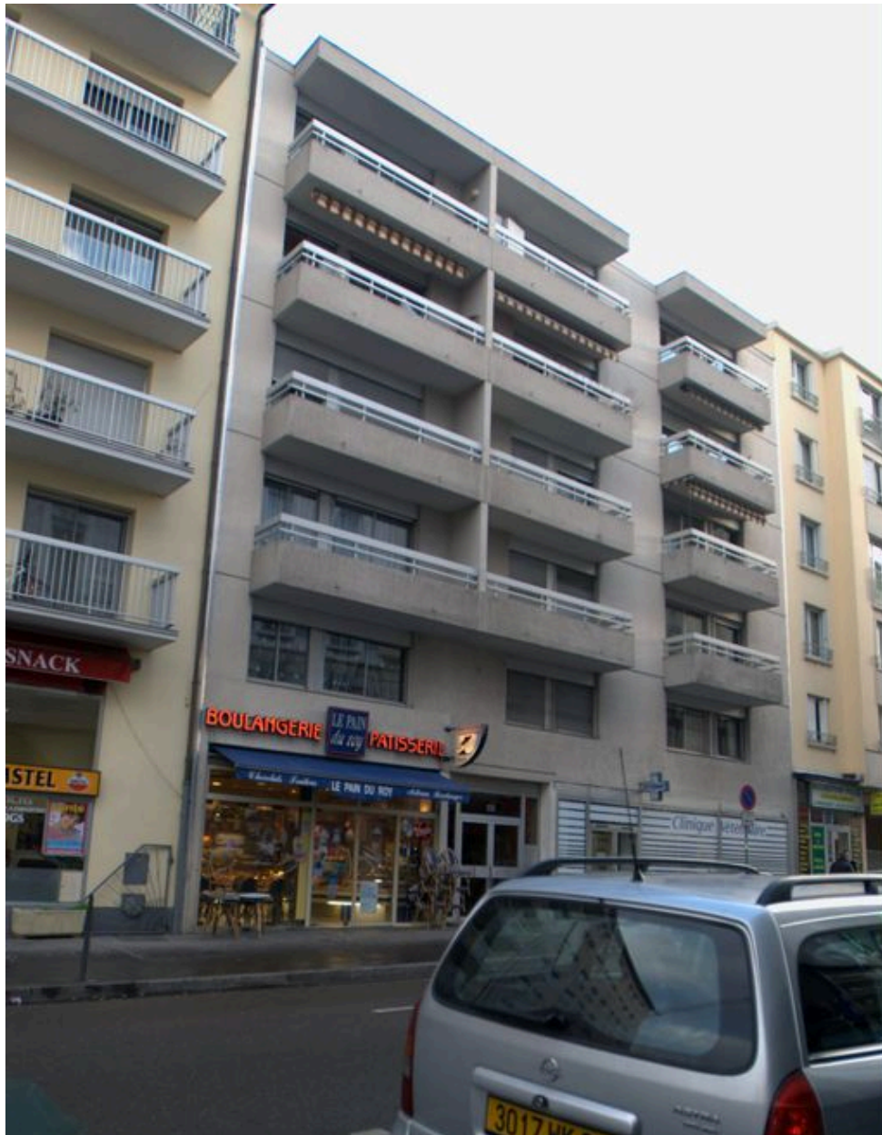
Elévation antérieure, depuis le sud-ouest