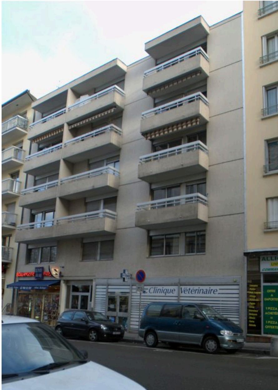
Elévation antérieure, depuis le sud-est