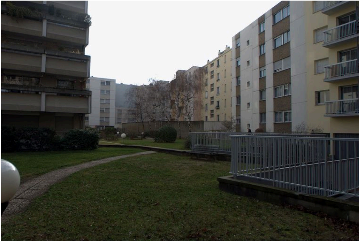
Elévation postérieure (la seconde en partant de la droite)