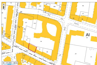
Plan masse et de situation, extrait de http://cadastre.gouv.fr IVR82_20136902350NUDA