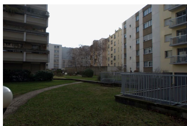
Elévation postérieure (la seconde en partant de la droite) IVR82_20116904112NUCA