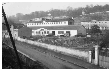
Vue de la minoterie Milliat rue Mouillard à Vaise (archive privée) IVR84_20216900145NUC