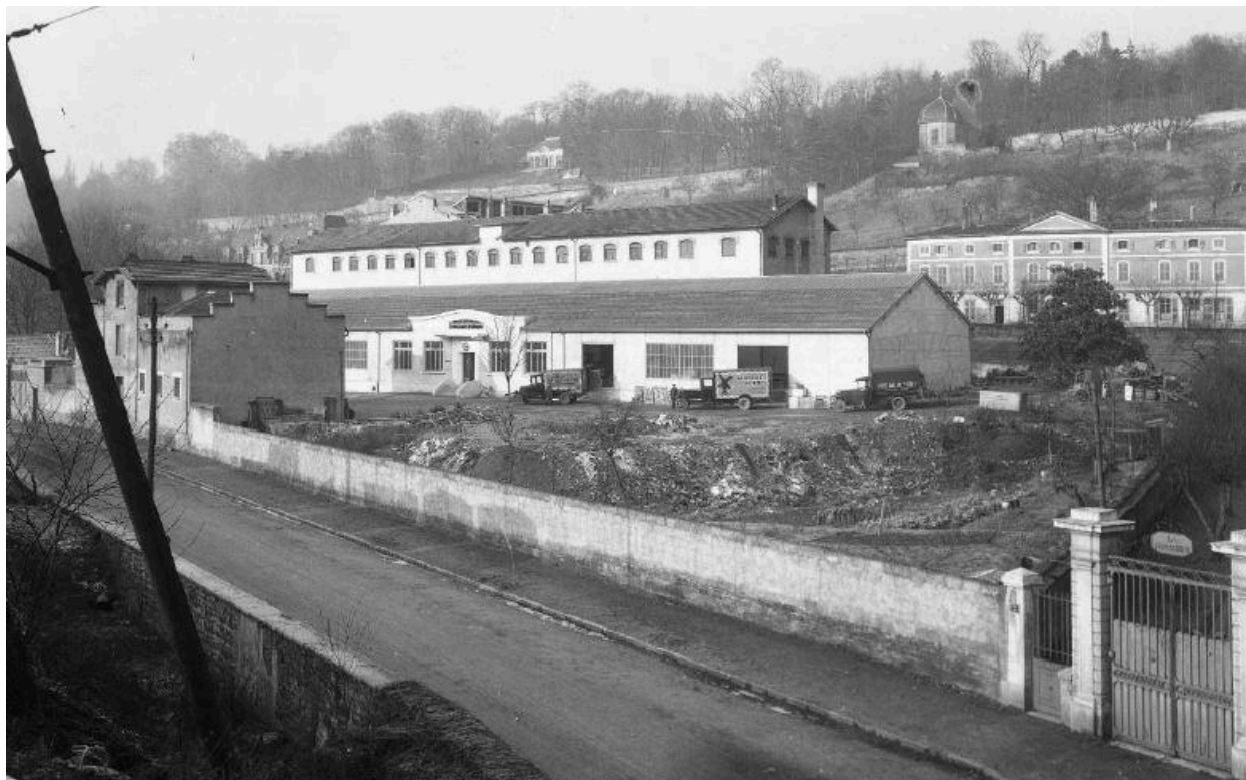
Vue de la minoterie Milliat rue Mouillard à Vaise