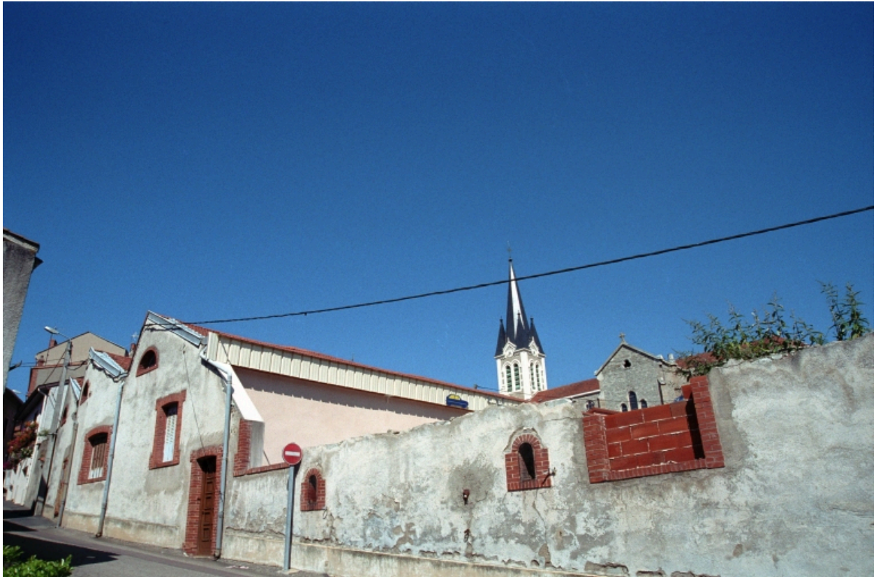
Vue générale des bâtiments industriels.