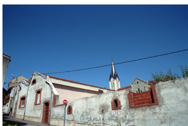
Vue générale des bâtiments industriels. IVR82_20024201750ZE