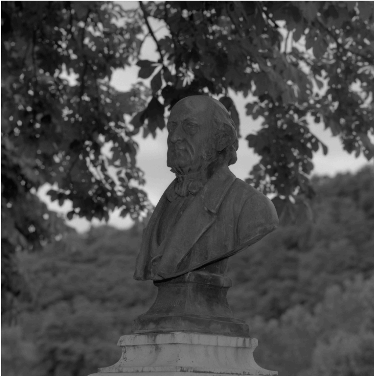
Buste de Jean-Baptiste David et piédestal. Détail du buste.