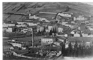
28.- BOËN - s - LIGNON / Vue d'ensemble de l'Usine David", vers 1900.