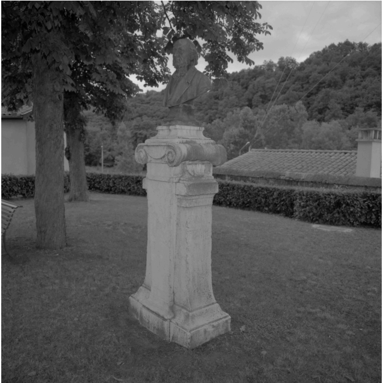
Buste de Jean-Baptiste David et piédestal. Vue d'ensemble.