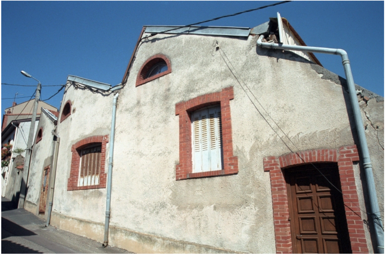
Vue générale des bâtiments industriels.