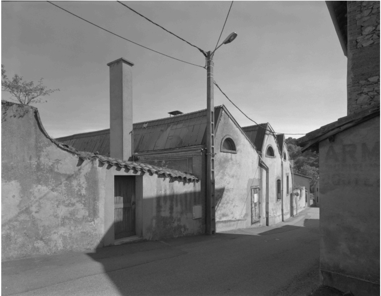
Vue générale des ateliers subsistants dans la rue Jean-Baptiste David, du nord.