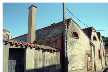
Vue générale des bâtiments industriels. IVR82_20024201748ZE