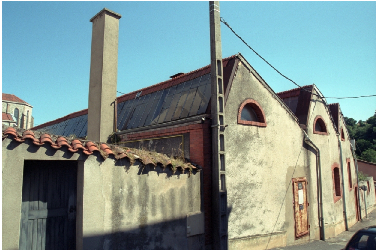
Vue générale des bâtiments industriels.