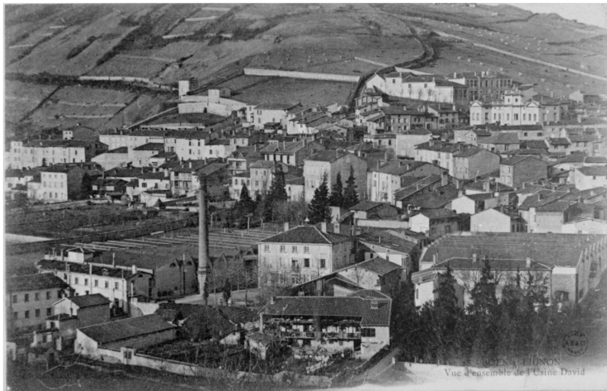
28.- BOËN - s - LIGNON / Vue d'ensemble de l'Usine David", vers 1900.