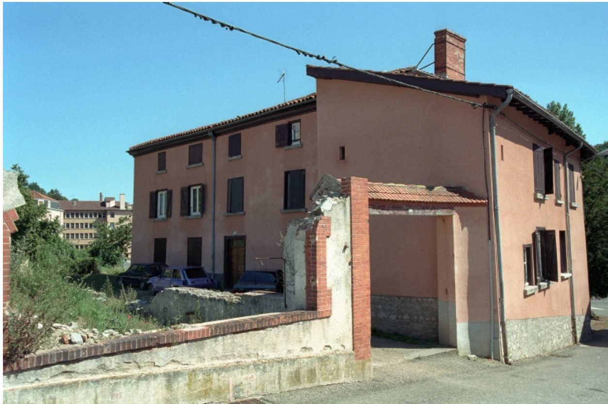
Vue générale des bâtiments industriels.