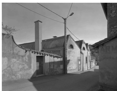
Vue générale des ateliers subsistants dans la rue Jean- Baptiste David, du nord.