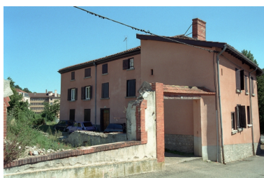
Vue générale des bâtiments industriels. IVR82_20024201751ZE