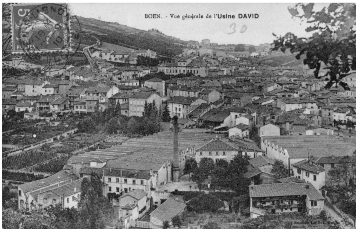
BOEN. - Vue générale de l'Usine DAVID", vers 1910 (cachet de la poste).