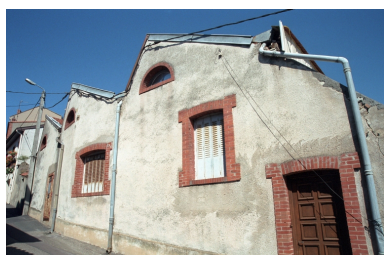
Vue générale des bâtiments industriels. IVR82_20024201749ZE