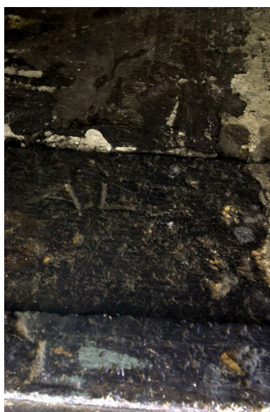
Marque AL gravée sur la pierre