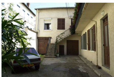
Vue générale depuis l'entrée de la cour IVR82_20106903684NUCA