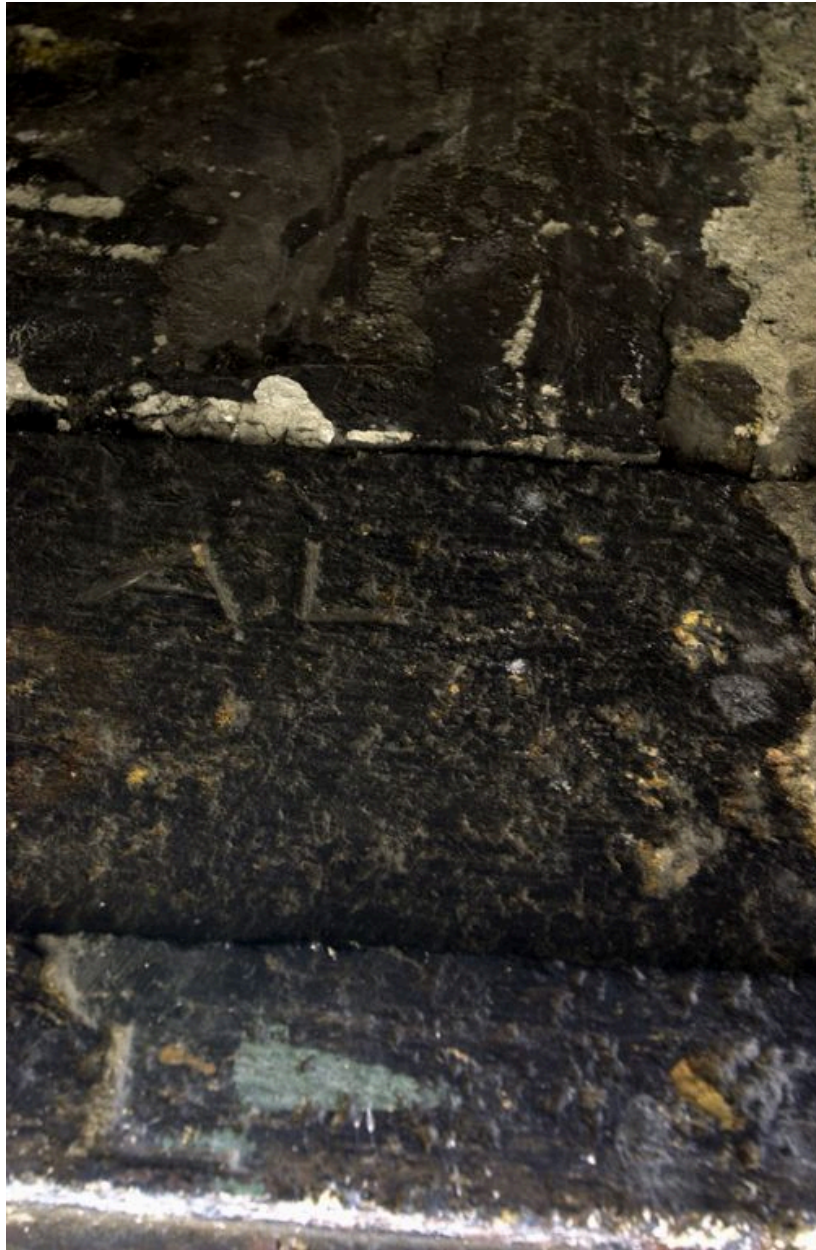
Marque AL gravée sur la pierre