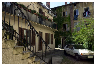
Vue d'ensemble depuis le nord-ouest IVR82_20106903679NUCA