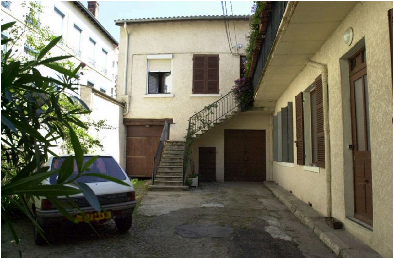
Vue générale depuis l'entrée de la cour