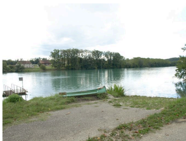
Vue générale de l'emplacement supposé IVR82_20100100259NUCA