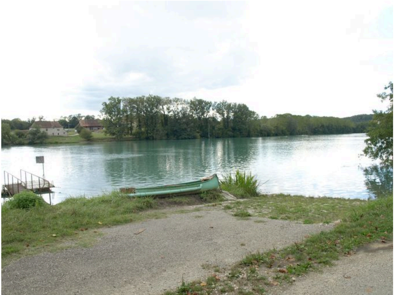
Vue générale de l'emplacement supposé