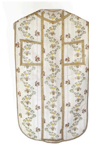
Vue générale du dos de la chasuble. IVR83_20136300629NUC4A