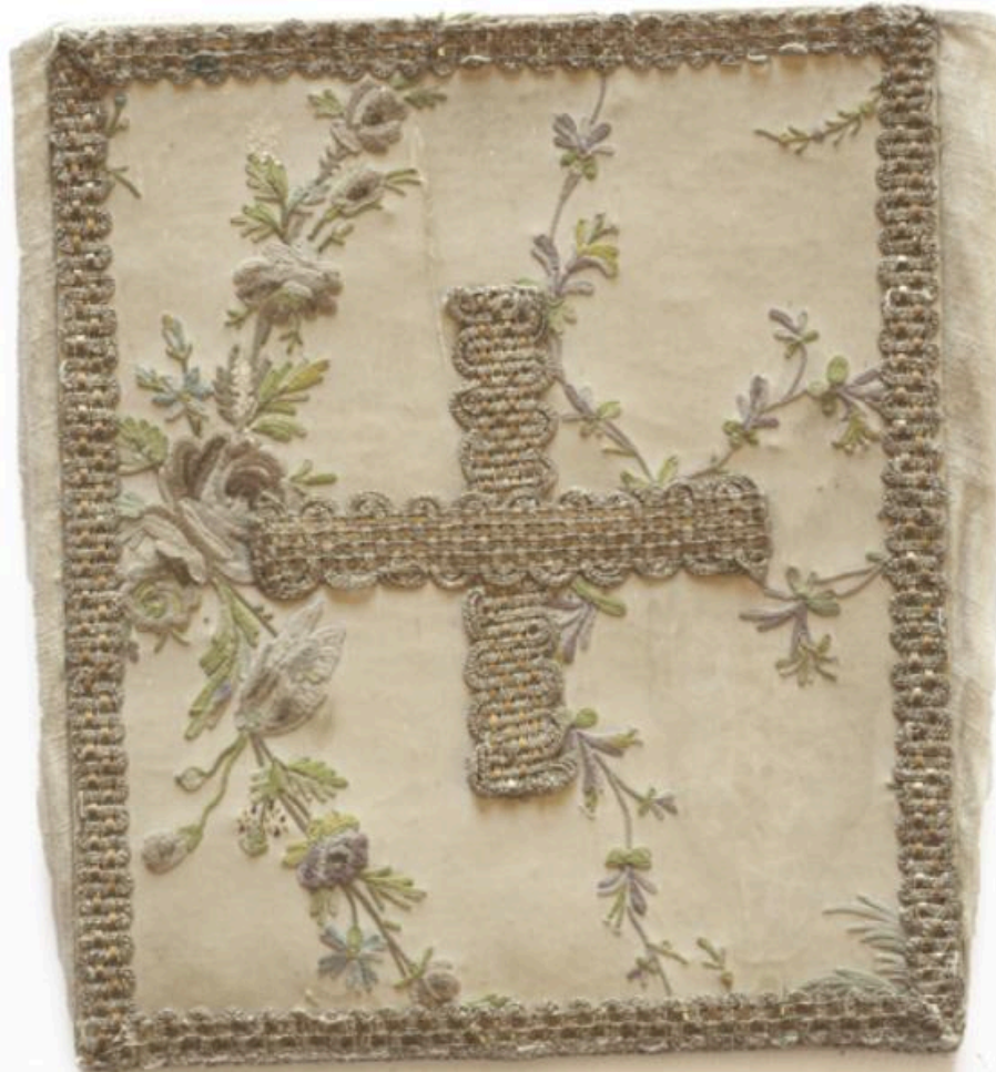
Vue générale de la bourse de corporal.