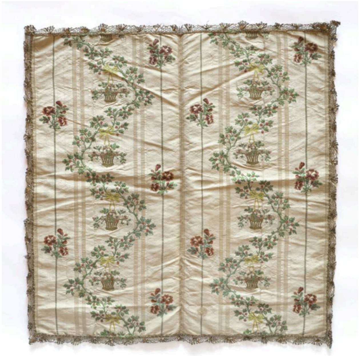
Vue générale du voile de calice.