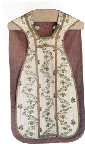
Vue générale du devant de la chasuble. IVR83_20136300628NUC4A