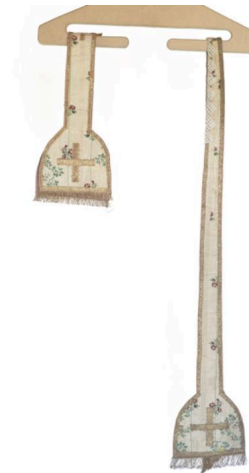
Vue générale de l'étole et du manipule. IVR83_20136300630NUC4A