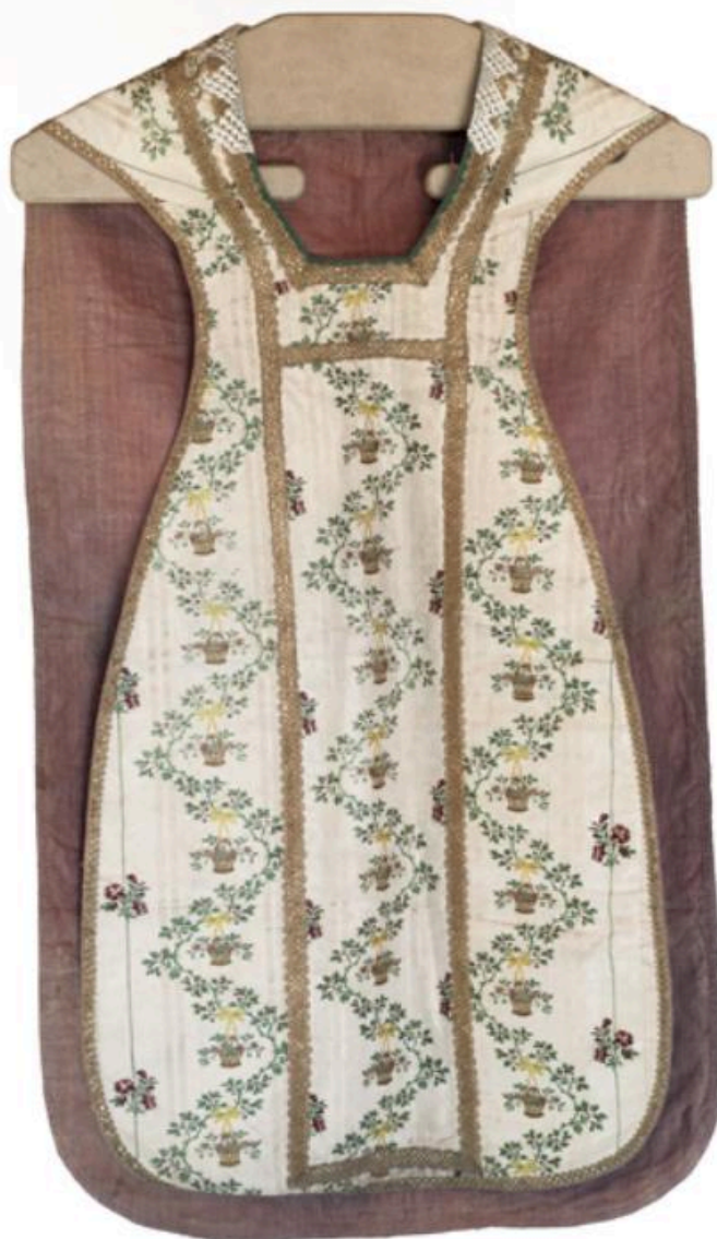
Vue générale du devant de la chasuble.