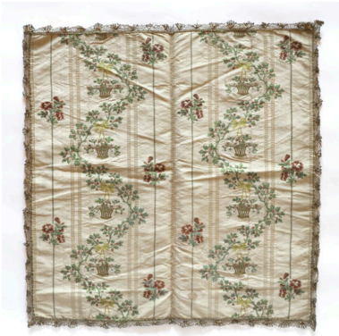
Vue générale du voile de calice.