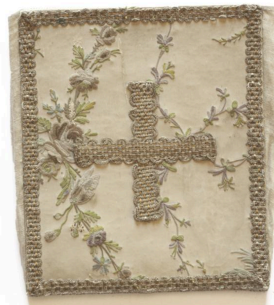
Vue générale de la bourse de corporal. IVR83_20136300632NUC4A