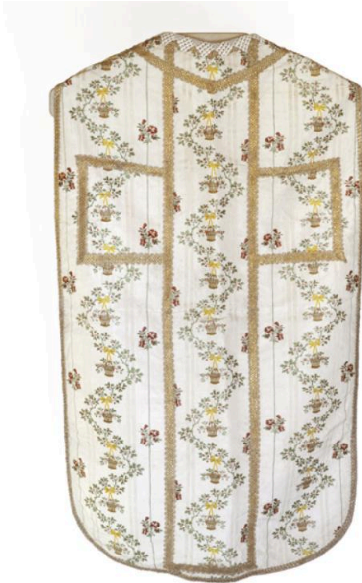
Vue générale du dos de la chasuble.