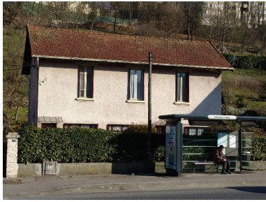
Façade occidentale