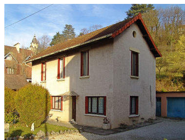
Façade sur jardin IVR82_20087300117NUCA