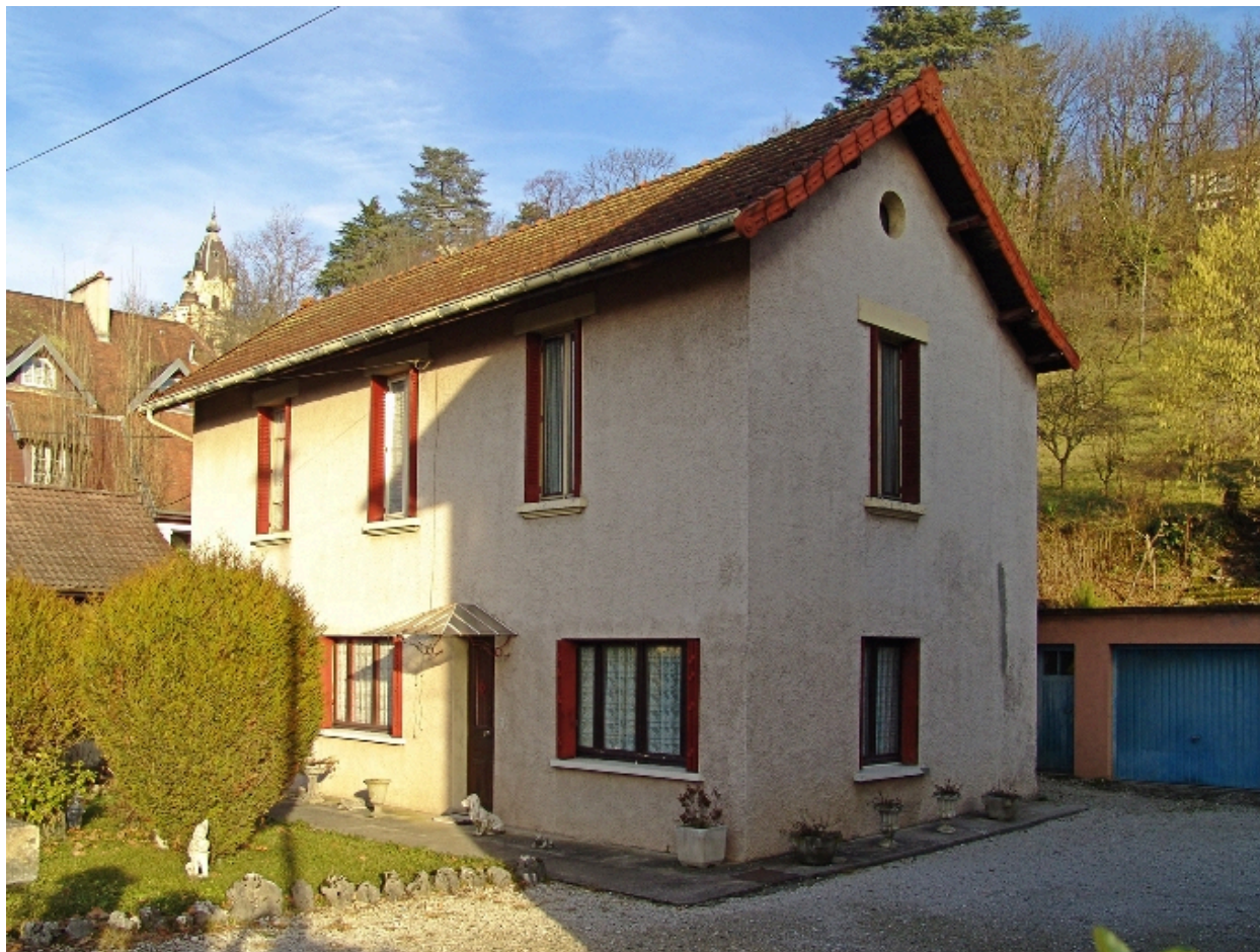
Façade sur jardin