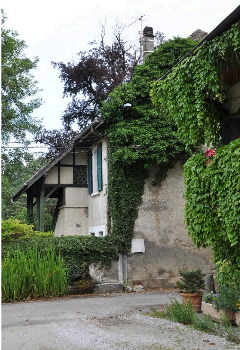
Vue sur l'escalier extérieur depuis l'est