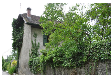
Vue de trois-quart depuis le nord-est