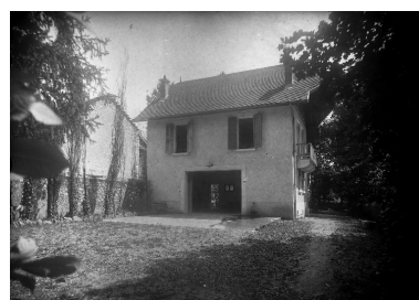
Vue sur le garage, façade nord, vers 1930