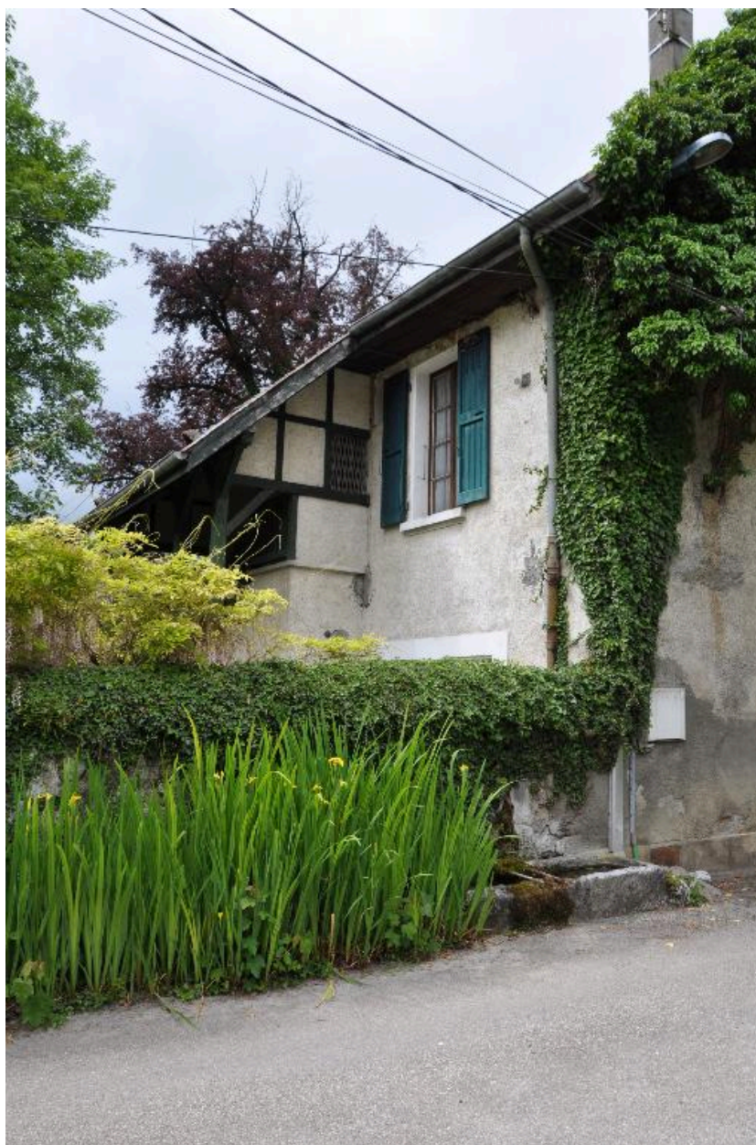
Vue de trois-quart depuis le sud-est