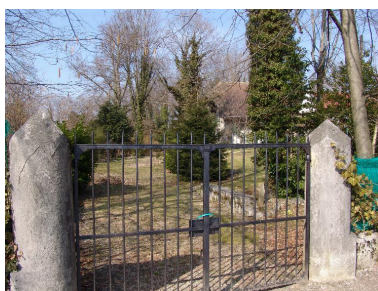
Vue d'ensemble depuis la route de Pugny IVR82_20147300810NUCA