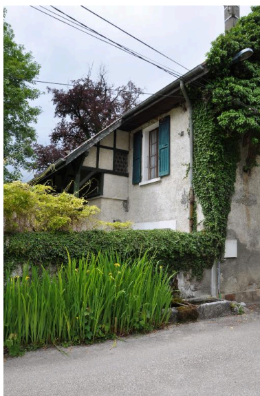
Vue de trois-quart depuis le sud-est IVR82_20137300104NUCA