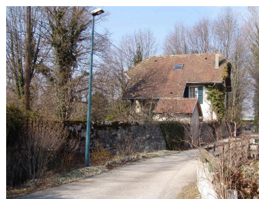
Vue d'ensemble depuis le chemin des Combaruches IVR82_20147300811NUCA