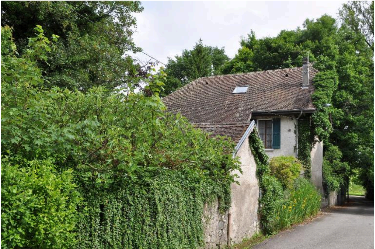
Vue générale depuis le sud-est