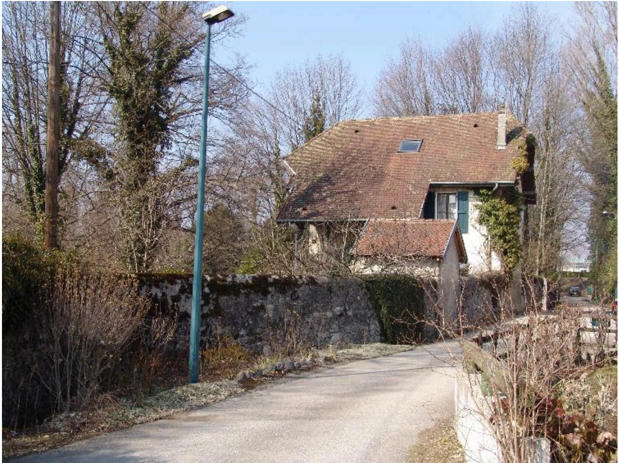
Vue d'ensemble depuis le chemin des Combaruches