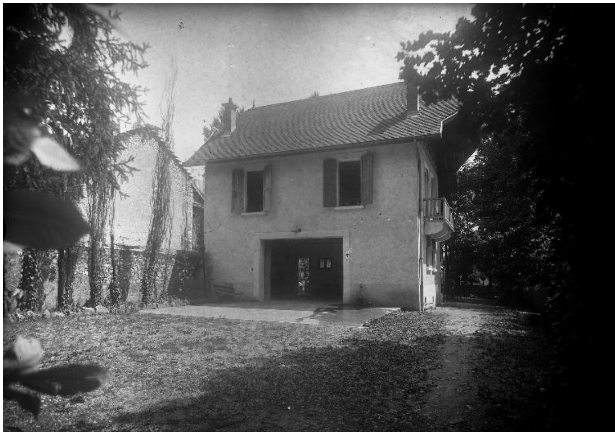
Vue sur le garage, façade nord, vers 1930