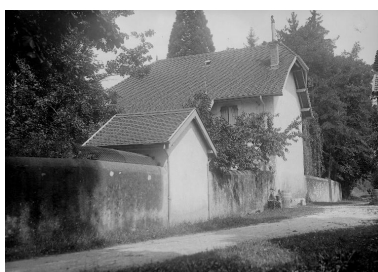
Vue depuis le sud-est, vers 1930 IVR82_20147300001NUCB