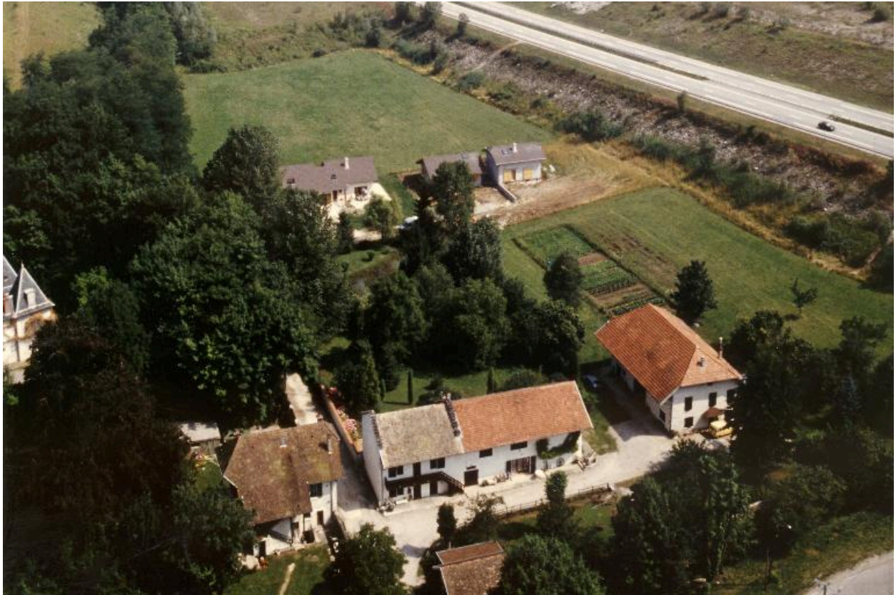
Vue aérienne, vers 1990