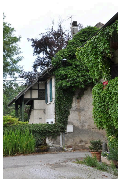
Vue sur l'escalier extérieur depuis l'est IVR82_20137300408NUCA