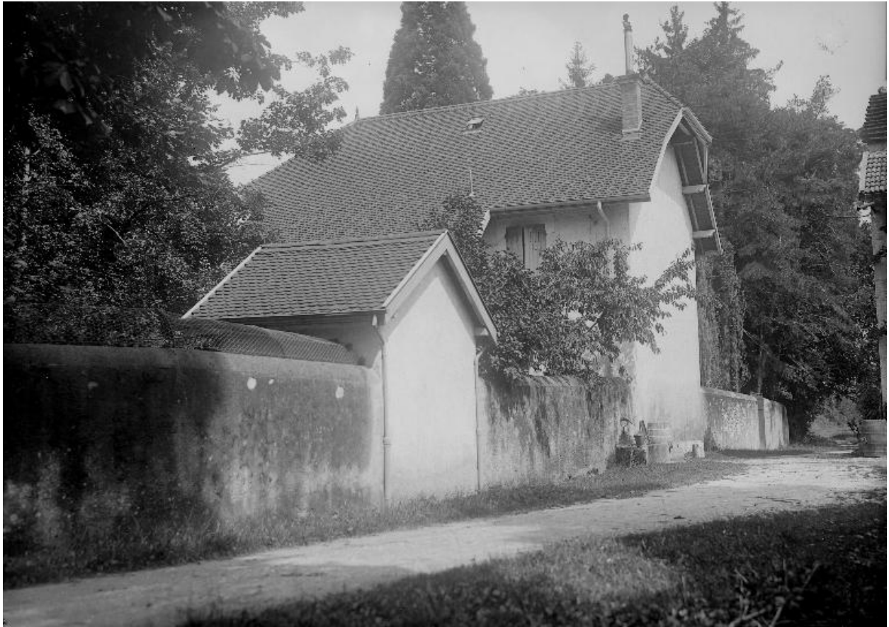
Vue depuis le sud-est, vers 1930