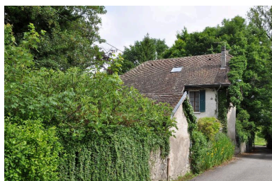
Vue générale depuis le sud-est IVR82_20137300409NUCA