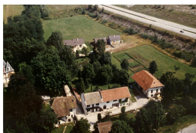
Vue aérienne, vers 1990