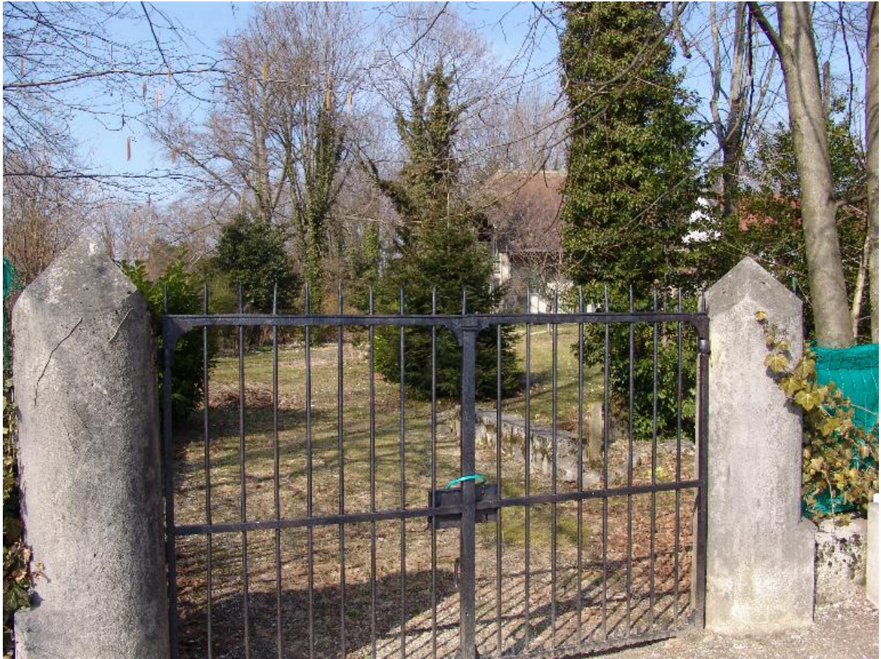
Vue d'ensemble depuis la route de Pugny