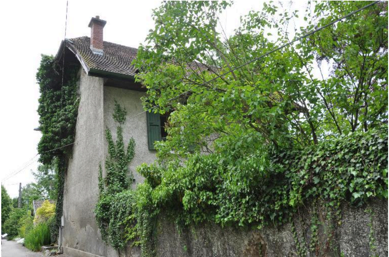
Vue de trois-quart depuis le nord-est