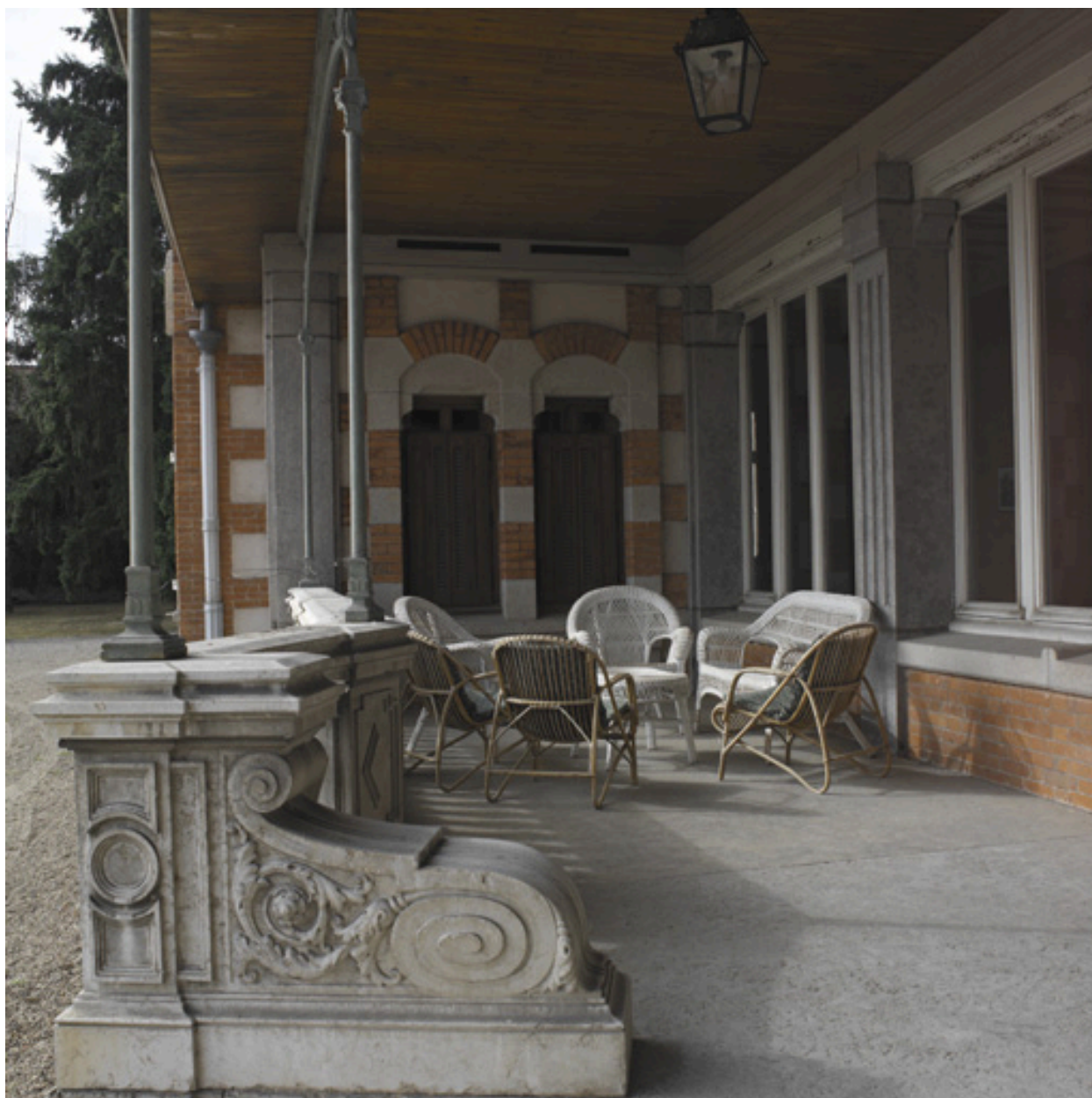
Vue de la galerie ouverte devant la maison des maîtres, depuis le nord.