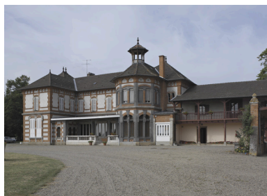
Vue d'ensemble de l'aile ouest, depuis le nord-ouest.