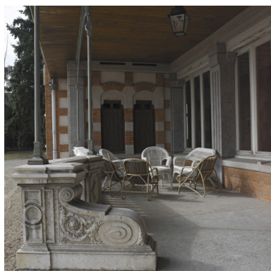
Vue de la galerie ouverte devant la maison des maîtres, depuis le nord.