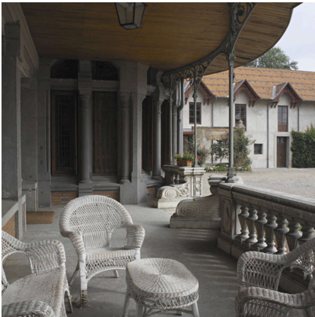
Vue de la galerie ouverte devant la maison des maîtres, depuis le sud.