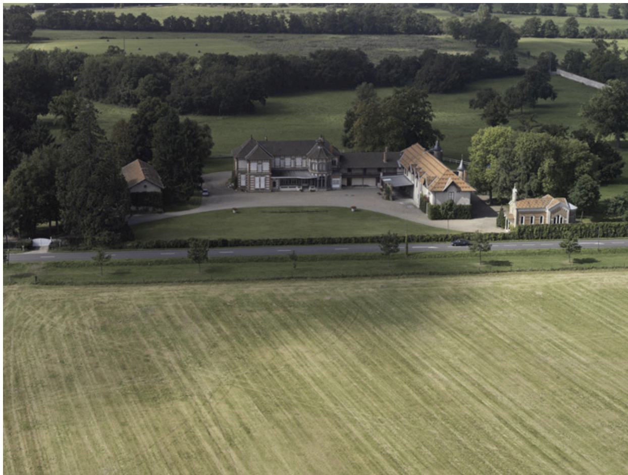
Vue générale aérienne depuis l'ouest.