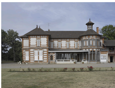
Vue d'ensemble de la maison des maîtres, depuis l'ouest. IVR82_20054200892NUCA