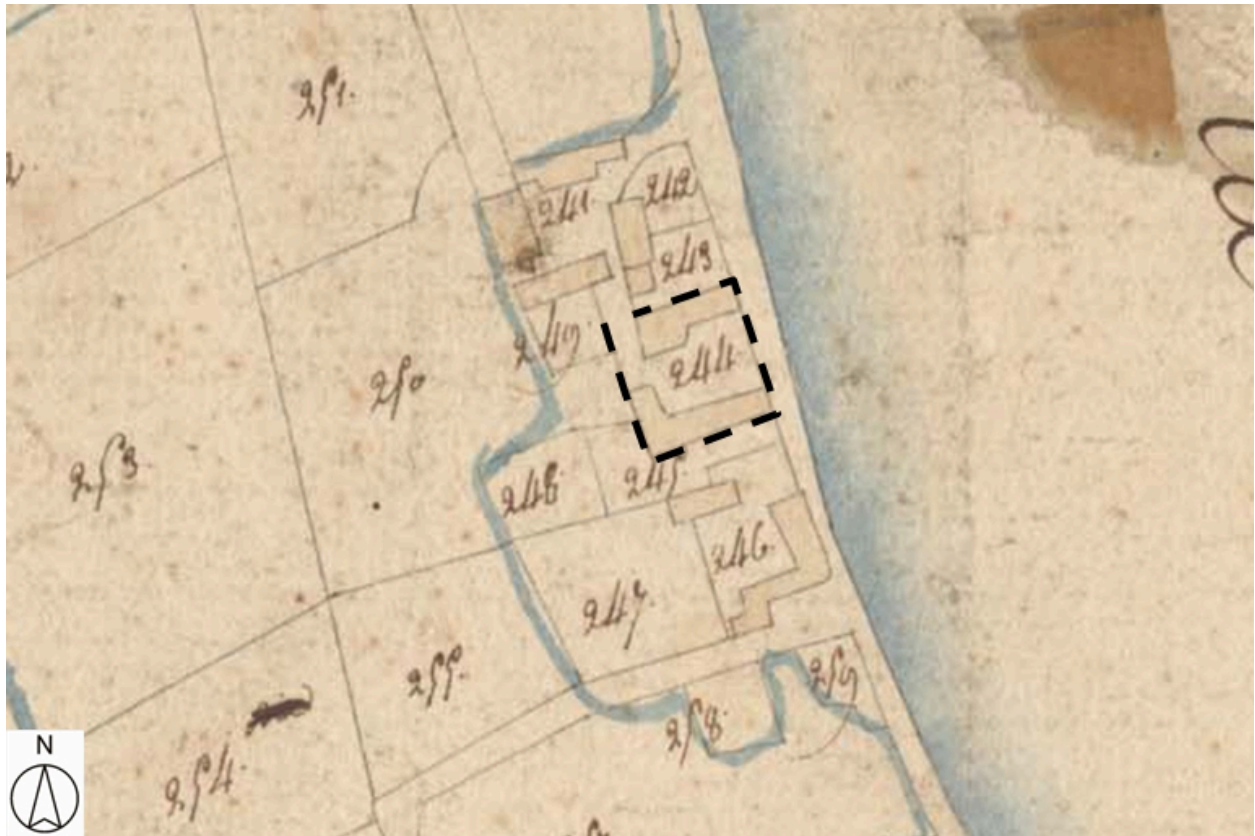
Plan de situation, d'après le cadastre de [1808], section C, échelle originale 1:5000.