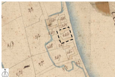
Plan de situation, d'après le cadastre de [1808], section C, échelle originale 1:5000. IVR82_20144200208NUD