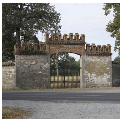
Vue du portail de l'angle nord-ouest du parc. IVR82_20054200891NUCA