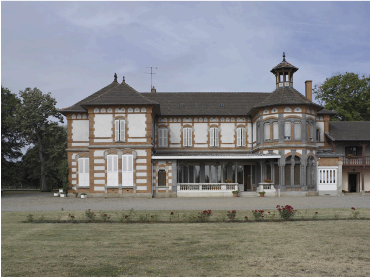
Vue d'ensemble de la maison des maîtres, depuis l'ouest.