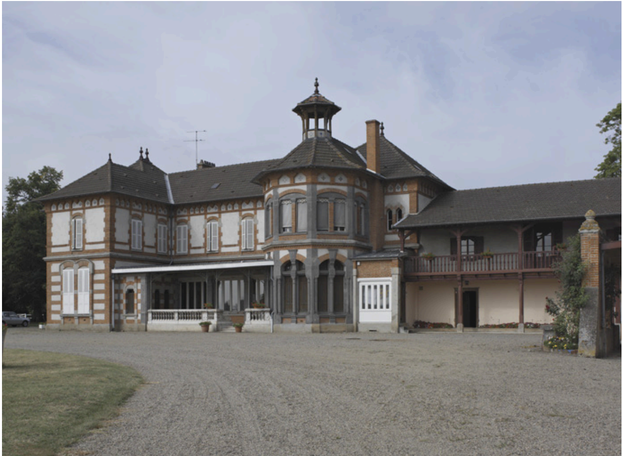
Vue d'ensemble de l'aile ouest, depuis le nord-ouest.