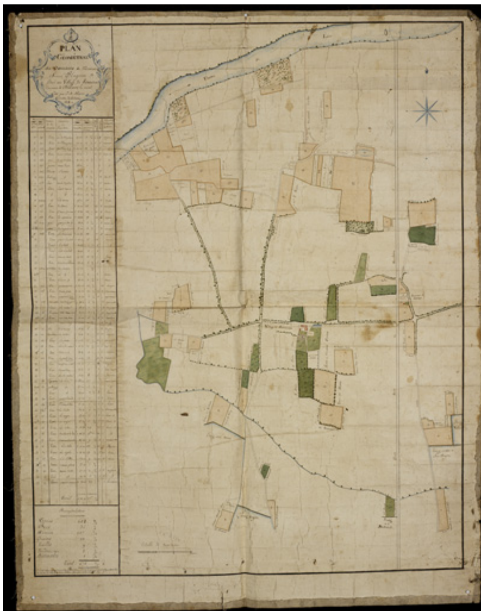
Plan géométral du domaine de monsieur Simon Plagnieu situé au village de Sourcieux. 1814.