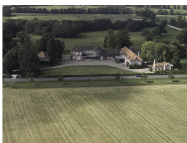
Vue générale aérienne depuis l'ouest.