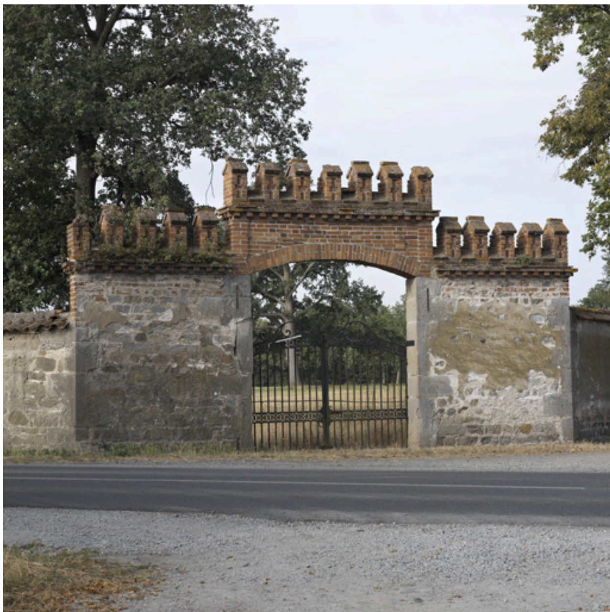
Vue du portail de l'angle nord-ouest du parc.