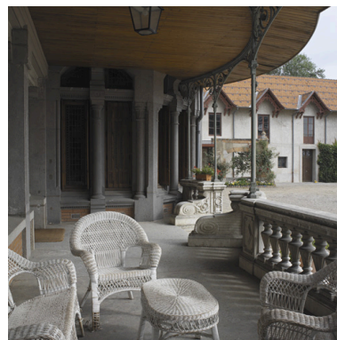
Vue de la galerie ouverte devant la maison des maîtres, depuis le sud.