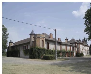
Vue d'ensemble depuis le nord-est. IVR82_20054200884NUCA