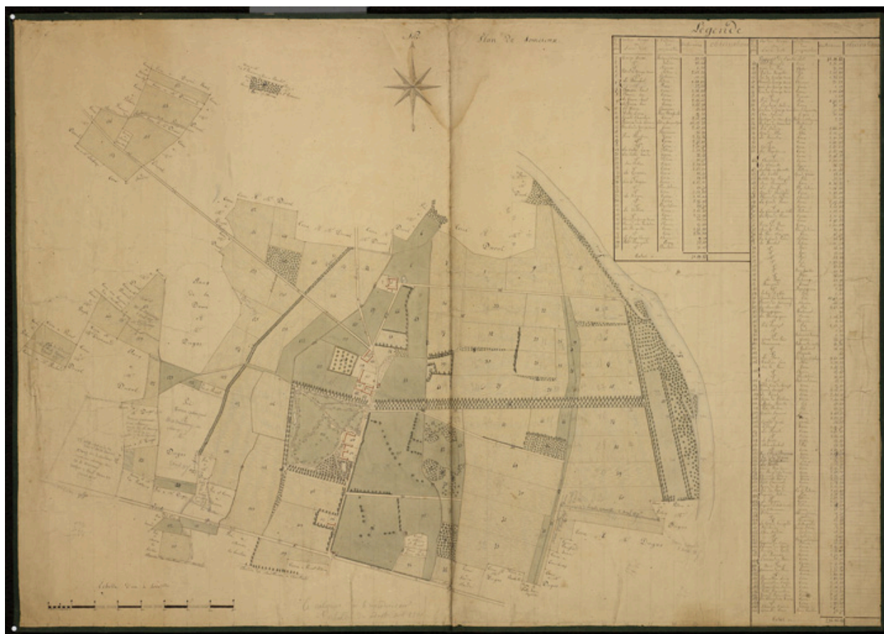
Plan d'ensemble de la terre de Sourcieux. 3e quart 19e siècle.