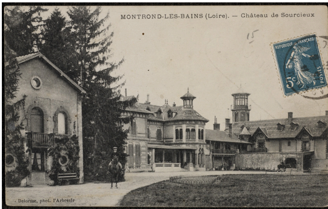
MONTROND-LES-BAINS (Loire). - Château de Sourcieux.