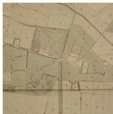
Plan d'ensemble de la terre de Sourcieux. 3e quart 19e siècle. Détail du bâti.