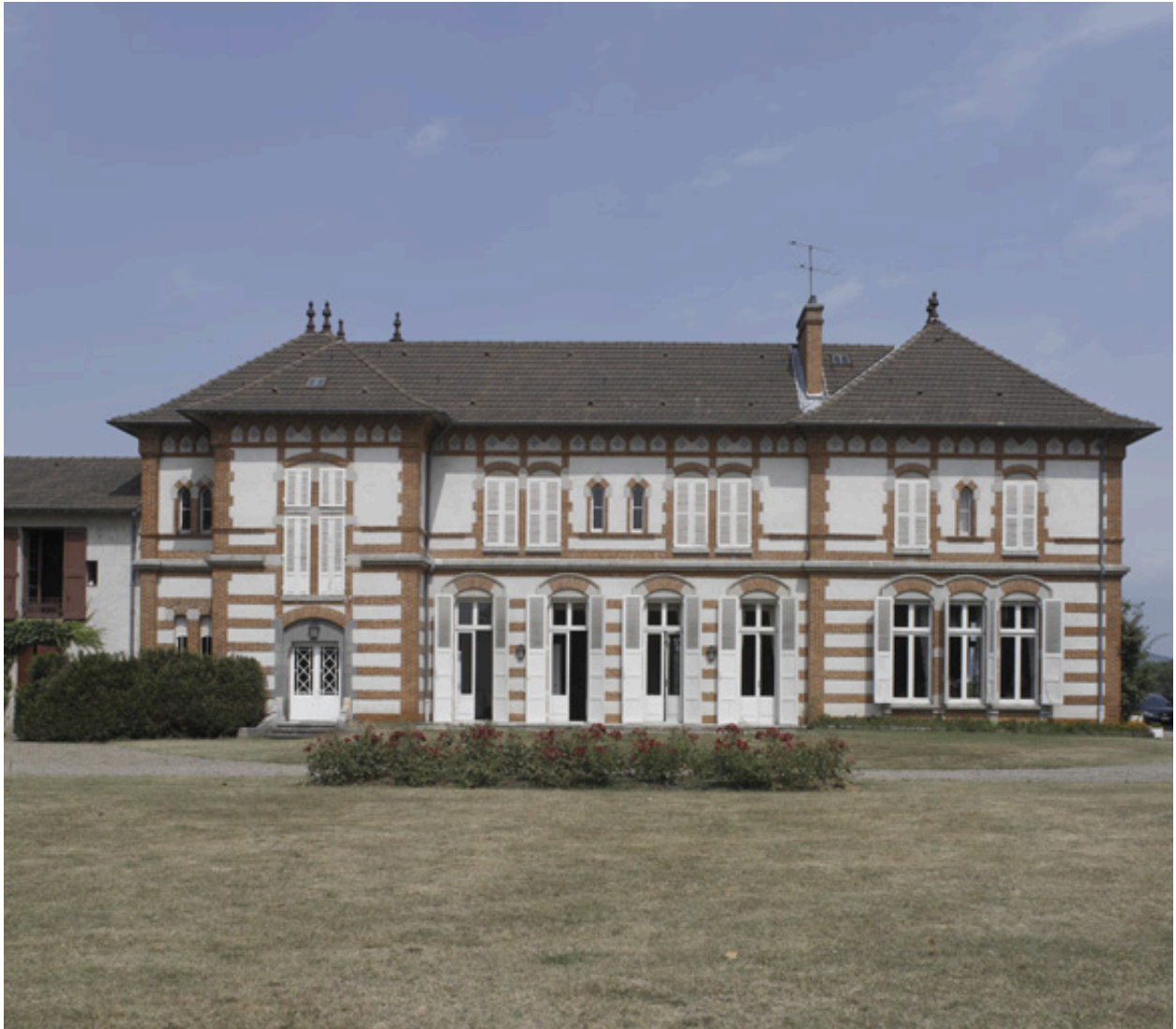
Vue de la maison des maîtres, élévation arrière, depuis l'est.