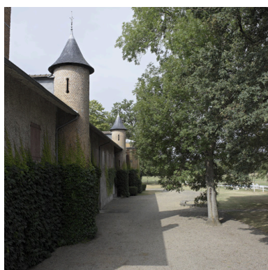
Vue de l'aile nord, côté parc, depuis l'ouest.