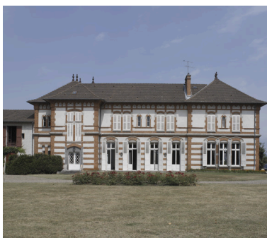
Vue de la maison des maîtres, élévation arrière, depuis l'est. IVR82_20054200883NUCA