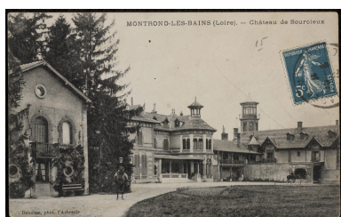
MONTROND-LES-BAINS (Loire) - Château de Sourcieux.