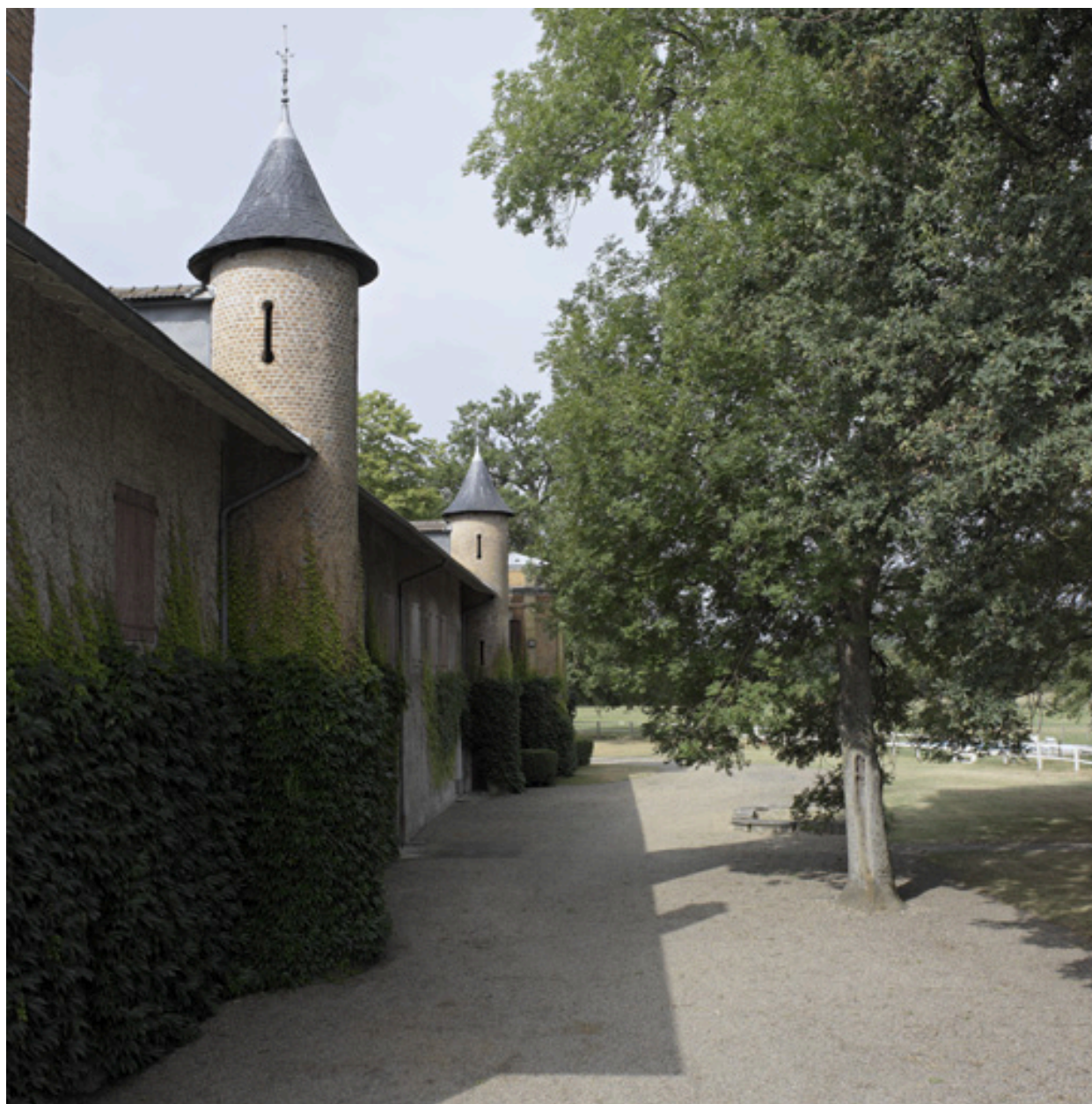
Vue de l'aile nord, côté parc, depuis l'ouest.