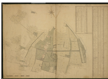
Plan d'ensemble de la terre de Sourcieux. 3e quart 19e siècle. IVR82_20054200911NUCA