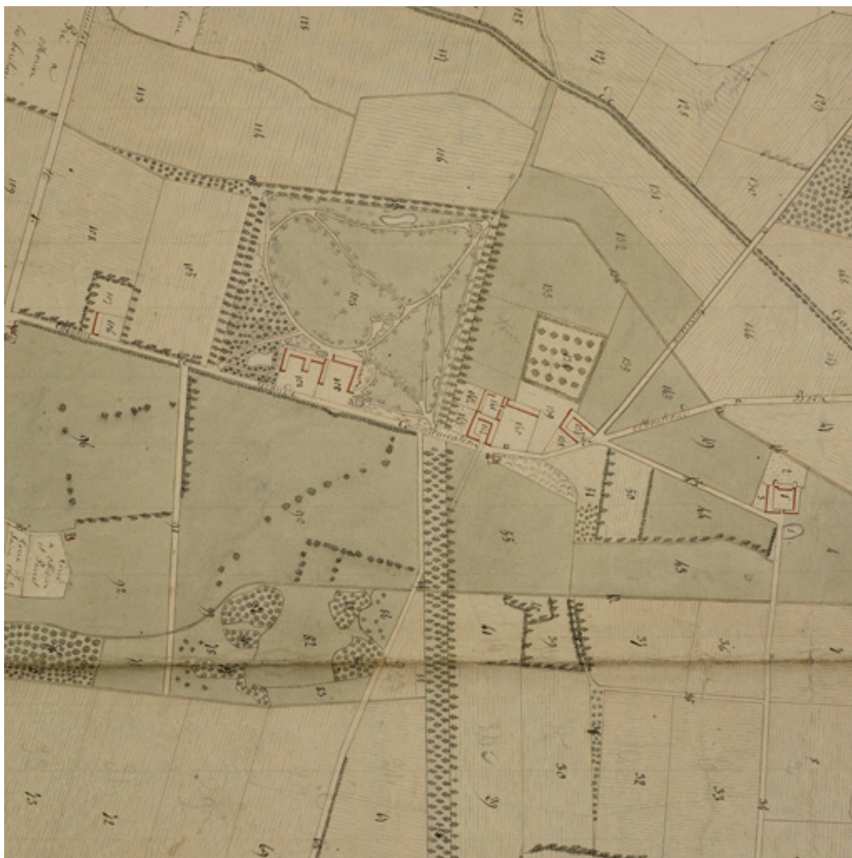
Plan d'ensemble de la terre de Sourcieux. 3e quart 19e siècle. Détail du bâti.