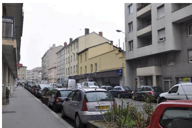
Vue d'ensemble IVR82_20136900291NUCA