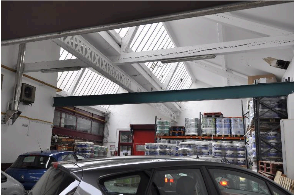
Vue de la charpente en bois