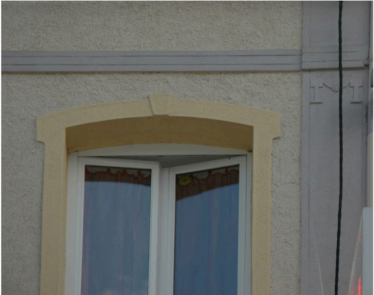
Détail, fenêtre et décor en bas-relief sur pilastre.