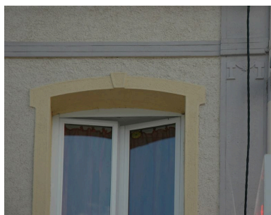
Détail, fenêtre et décor en bas-relief sur pilastre.