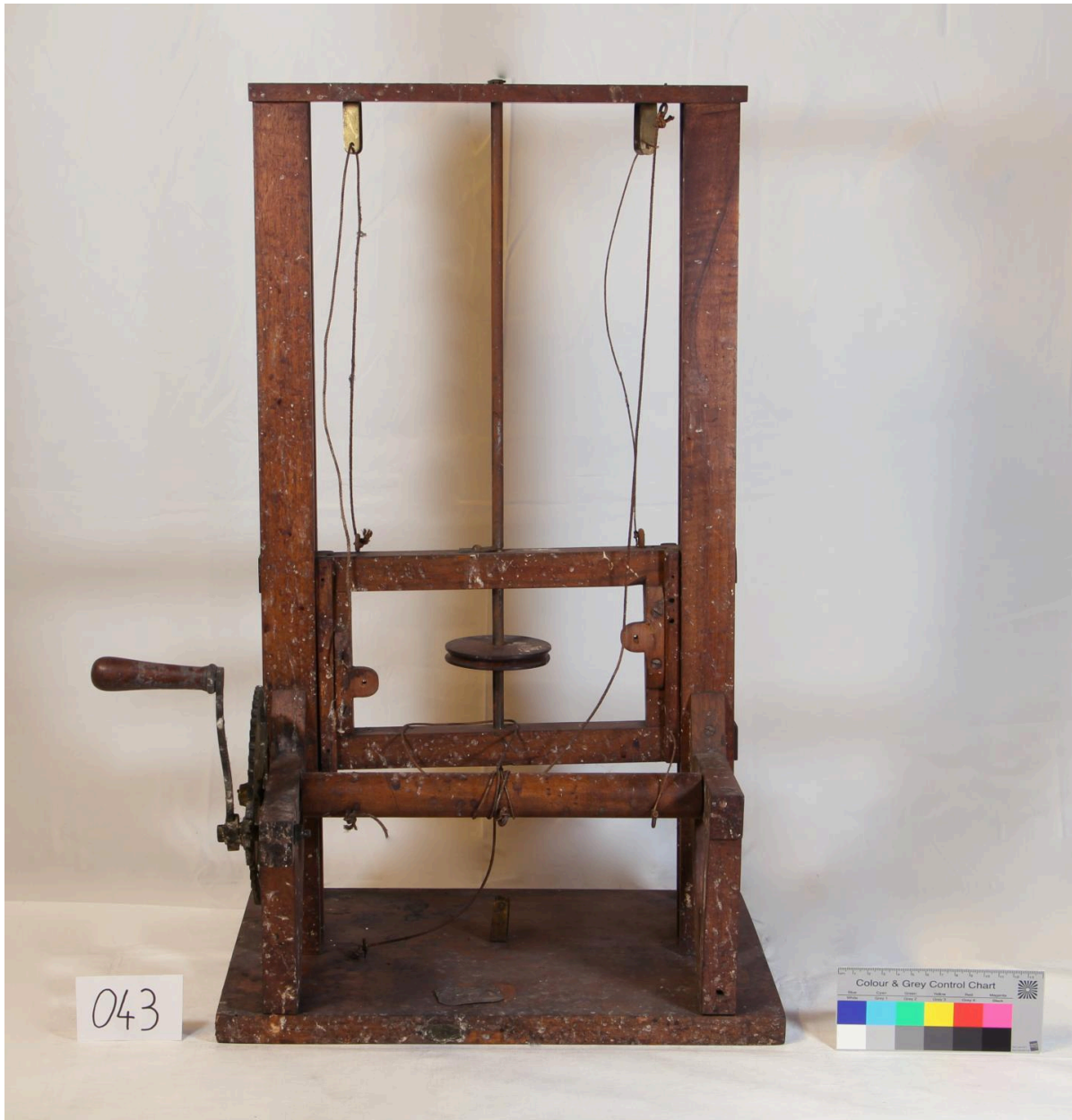
Objet de représentation d'élément mécanique, exemplaire n°2, vue de face