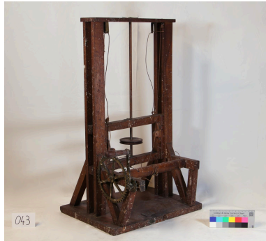
Objet de représentation d'élément mécanique, exemplaire n°2, vue de côté IVR84_20256901038NUCA