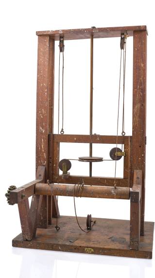
Objet de représentation d'élément mécanique, exemplaire n°1 IVR84_20246900205NUCA