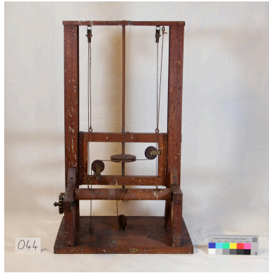
IVR84_20256901039NUCA