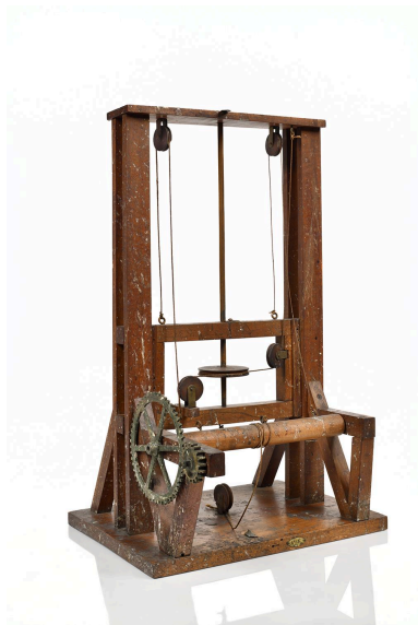
Exemplaire n°1 IVR84_20256901980NUCA