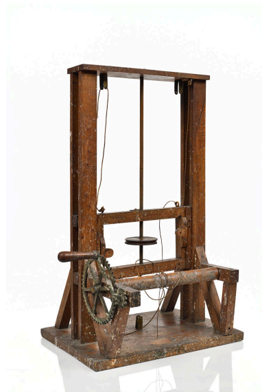
Exemplaire n°2 IVR84_20256901981NUCA