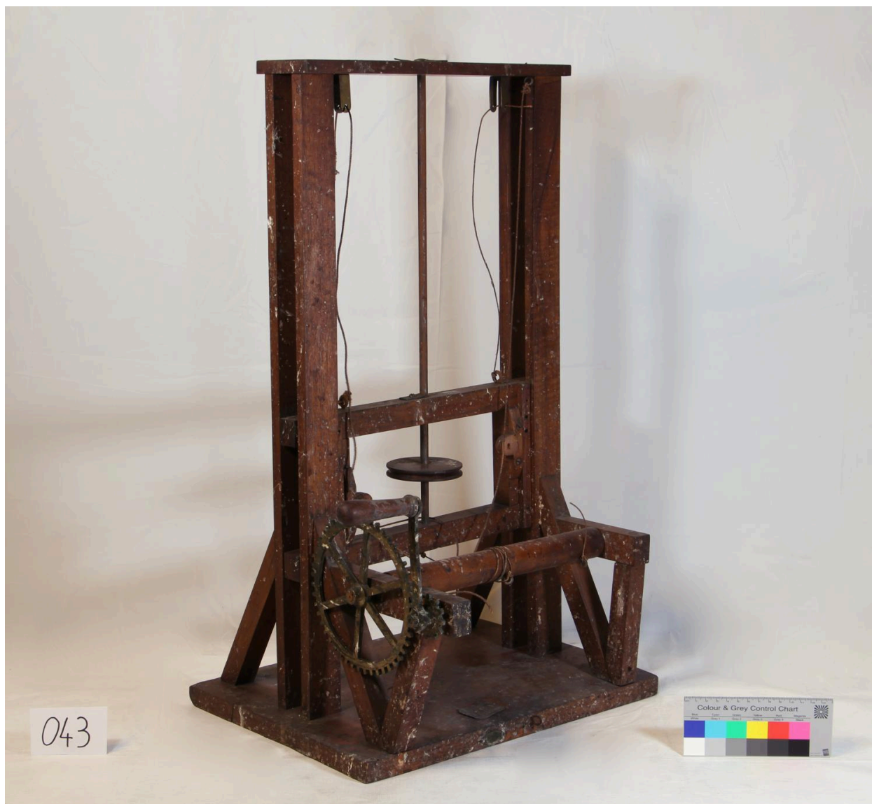
Objet de représentation d'élément mécanique, exemplaire n°2, vue de côté