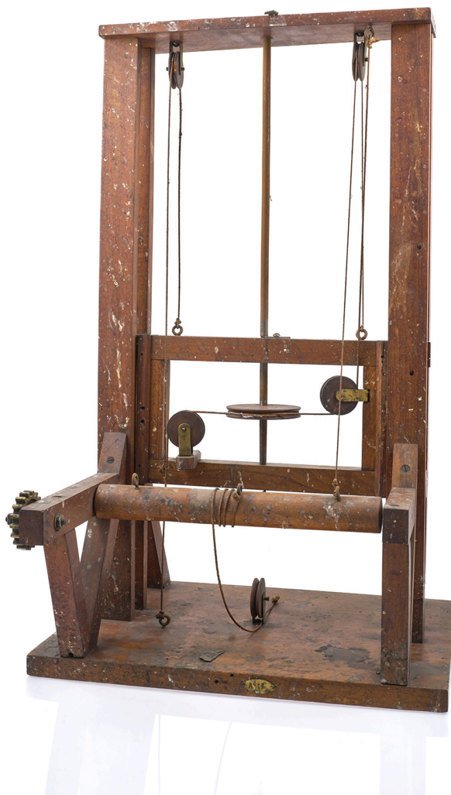
Objet de représentation d'élément mécanique, exemplaire n°1