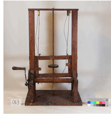
Objet de représentation d'élément mécanique, exemplaire n°2, vue de face IVR84_20256901037NUCA