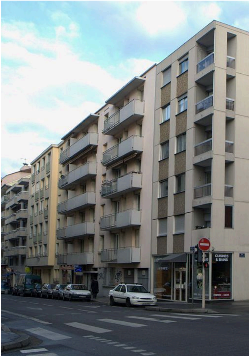
Vue générale depuis l'est