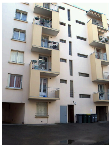
Elévation postérieure, détail des balcons IVR82_20116904095NUCA