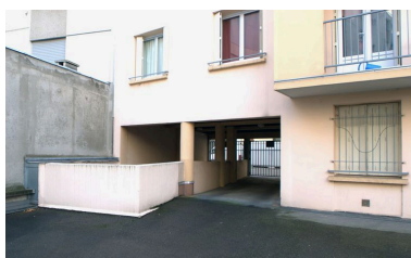
Passage cocher, depuis la cour IVR82_20116904096NUCA