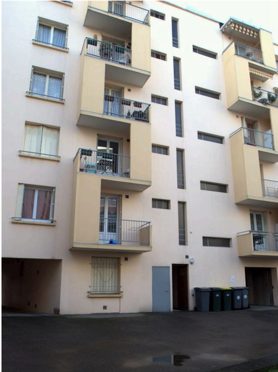
Elévation postérieure, détail des balcons