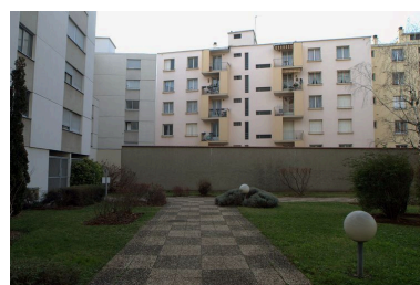
Elévation postérieure, vue des étages supérieurs IVR82_20116904094NUCA