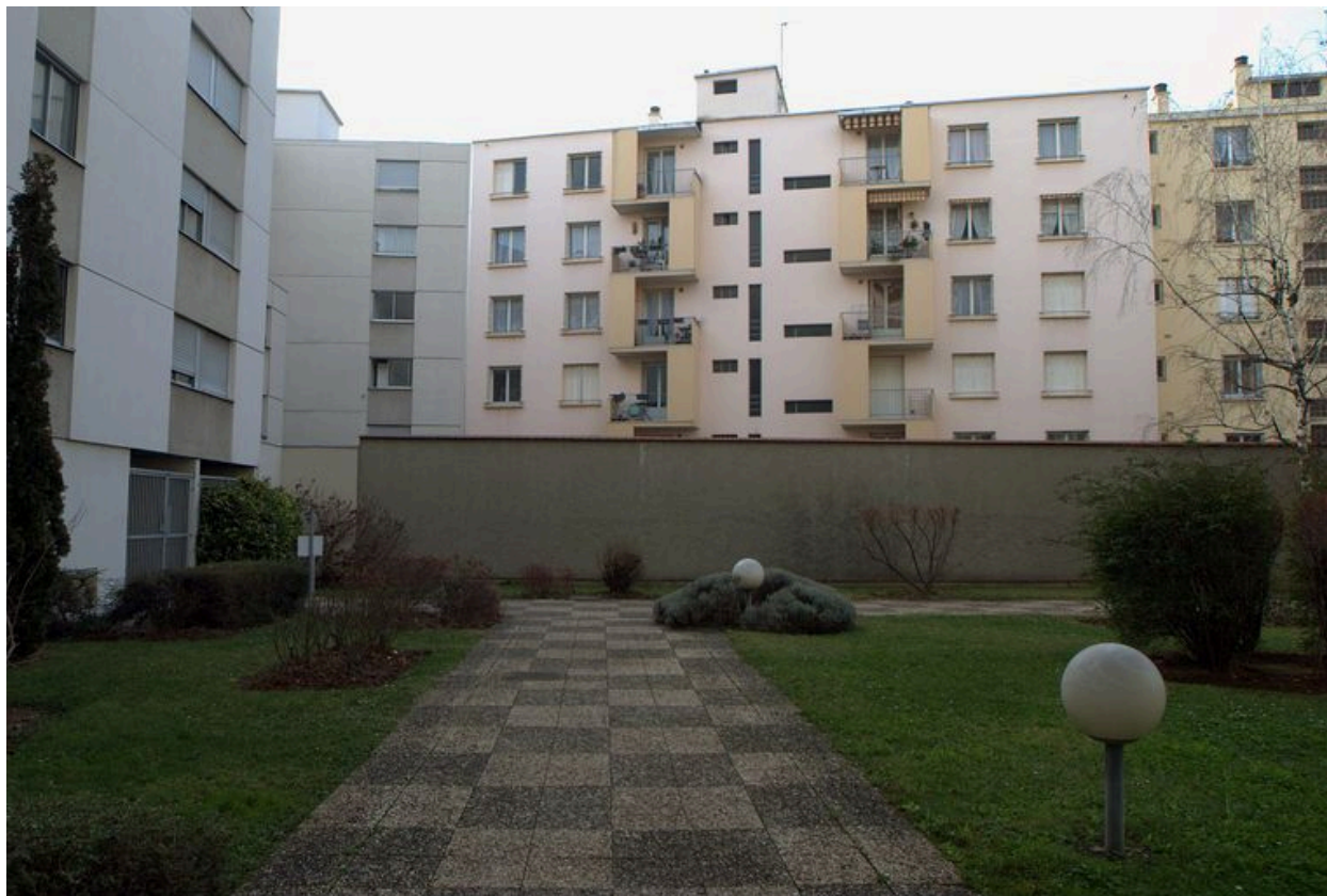
Elévation postérieure, vue des étages supérieurs