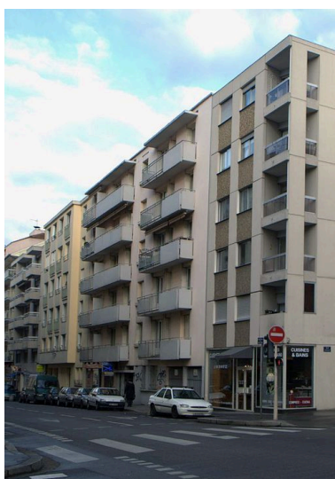
Vue générale depuis l'est IVR82_20116904093NUCA