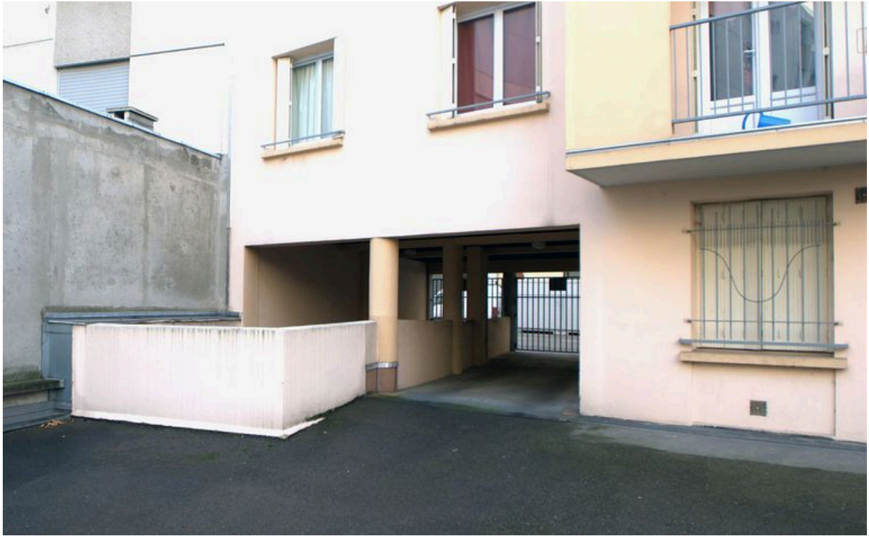
Passage cocher, depuis la cour