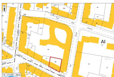
Plan masse et de situation, extrait de http://cadastre.gouv.fr IVR82_20136902354NUDA