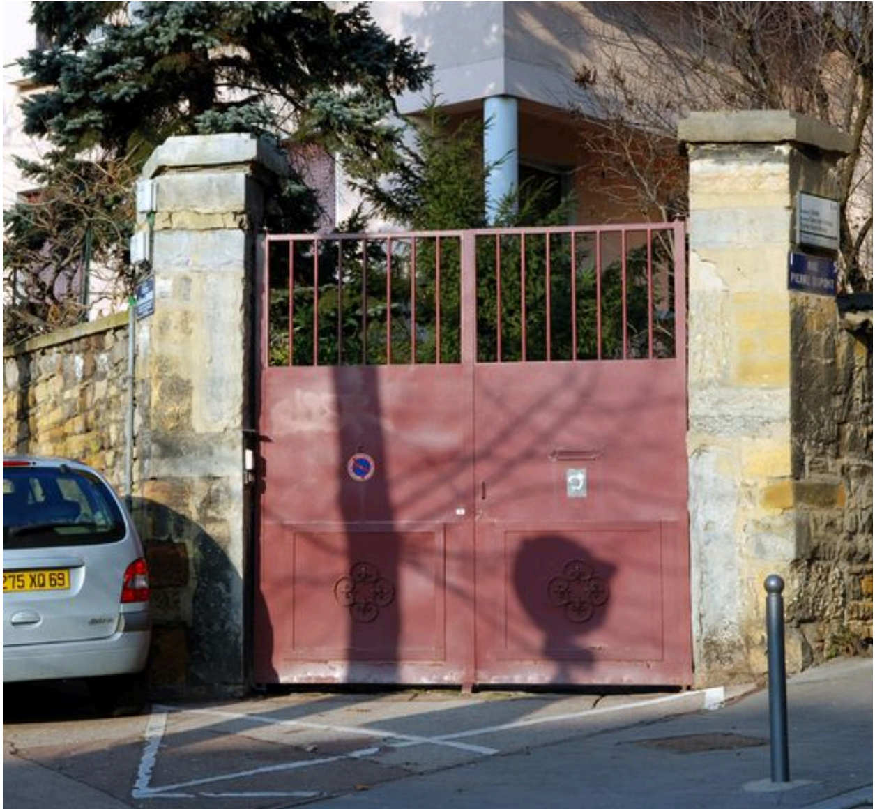
Détail du portail