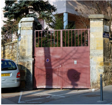
Détail du portail