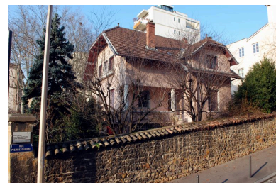
Vue d'ensemble depuis le sud-est IVR82_20096900567NUCA