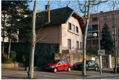
Vue d'ensemble depuis le nord-ouest IVR82_20096900568NUCA