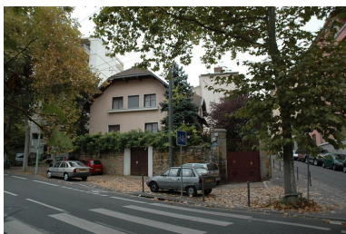
Vue générale IVR82_20086901712NUCA