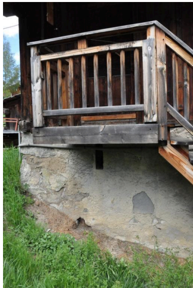
Emplacement probable de la roue hydraulique. IVR84_20167302490NUCA