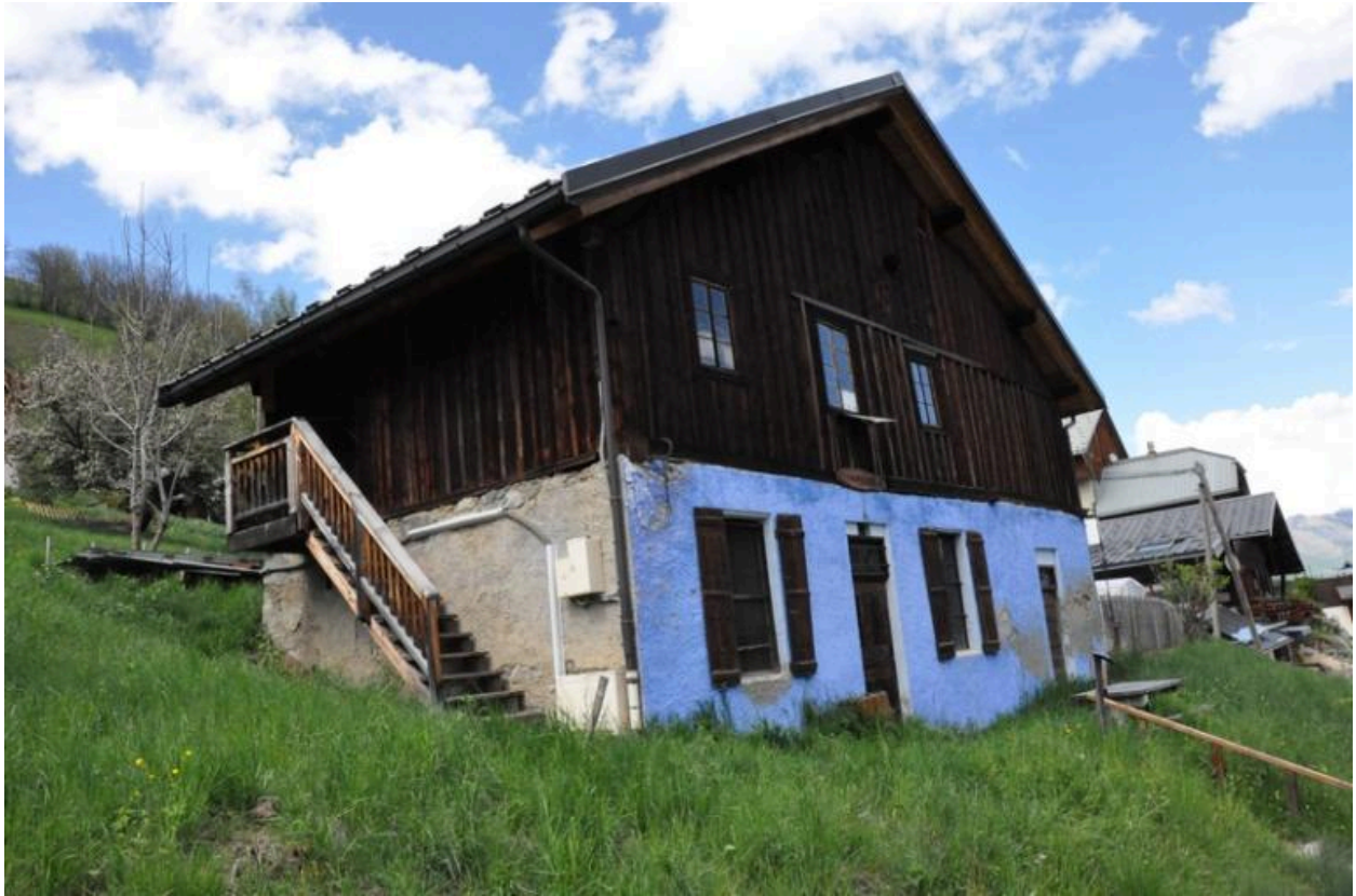
Vue de la fruitière du Meiller.