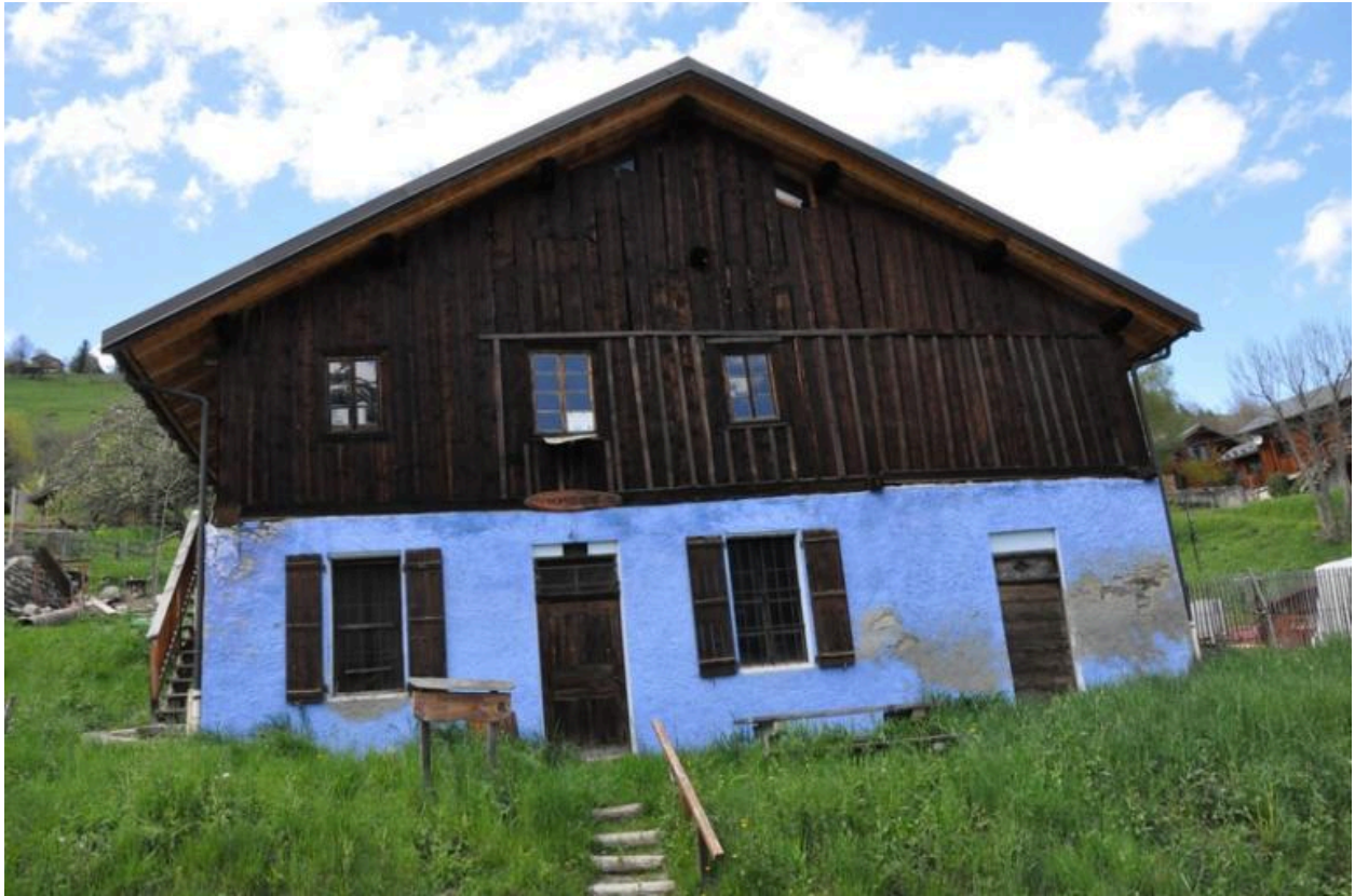
Vue de la fruitière du Meiller.