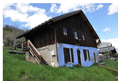
Vue de la fruitière du Meiller. IVR84_20167302489NUCA