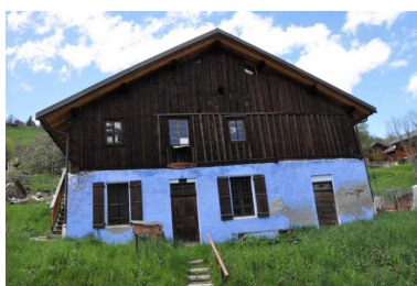
Vue de la fruitière du Meiller. IVR84_20167302488NUCA