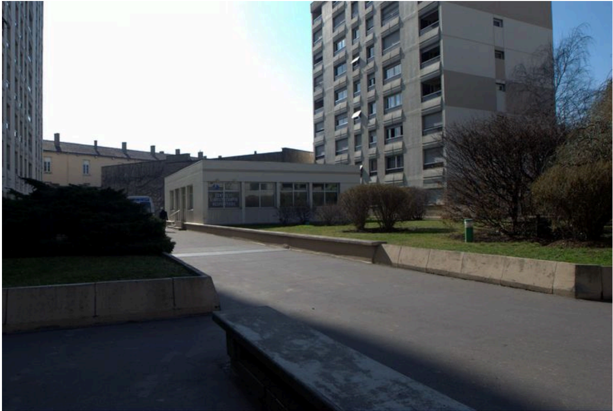
Le centre de kinésithérapie