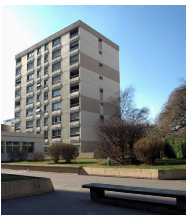
Immeuble ouest IVR82_20116904986NUCA