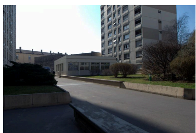
Le centre de kinésithérapie IVR82_20116904985NUCA