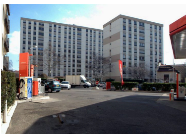
Vue générale depuis l'ouest IVR82_20116904984NUCA