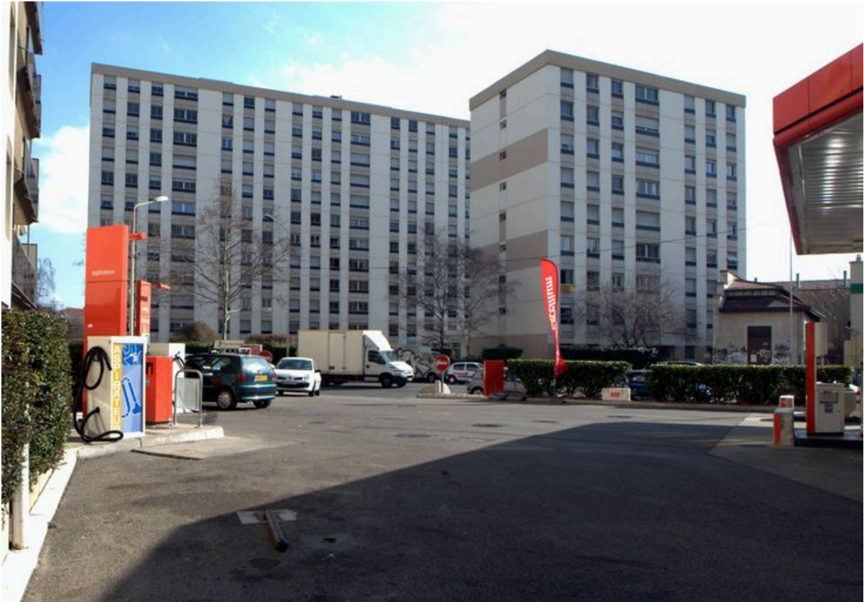
Vue générale depuis l'ouest