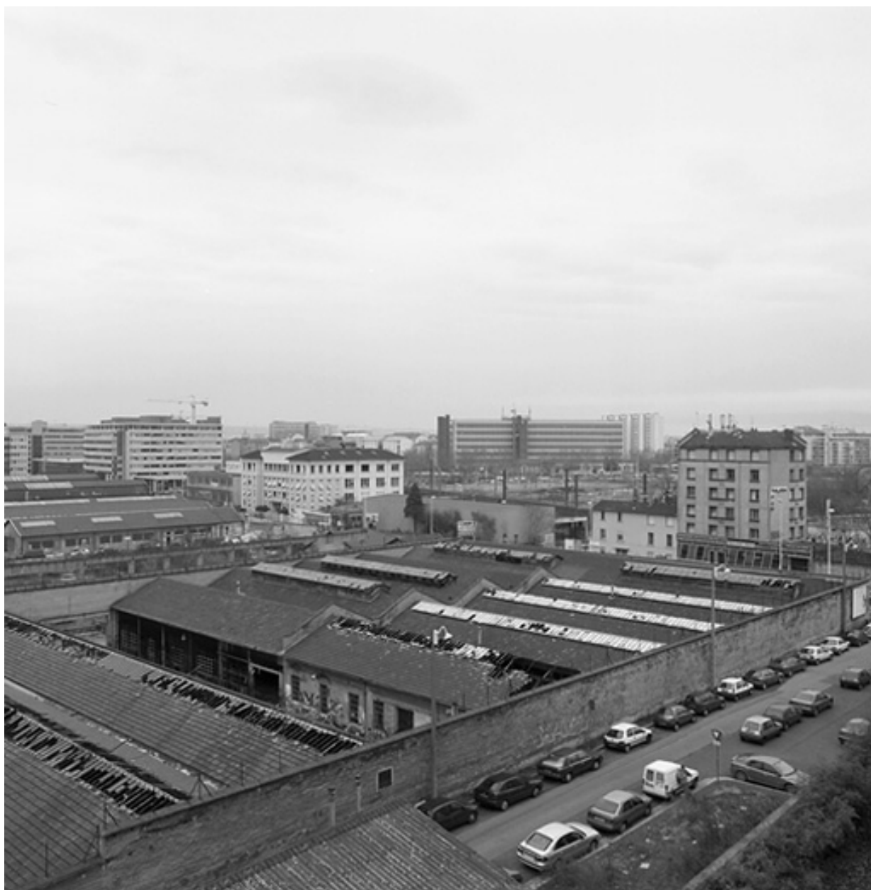
Vue du central téléphonique dans le paysage en 2002