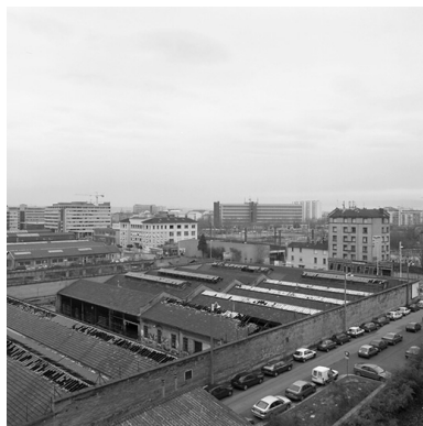
Vue du central téléphonique dans le paysage en 2002