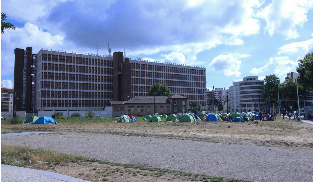
Vue d'ensemble est