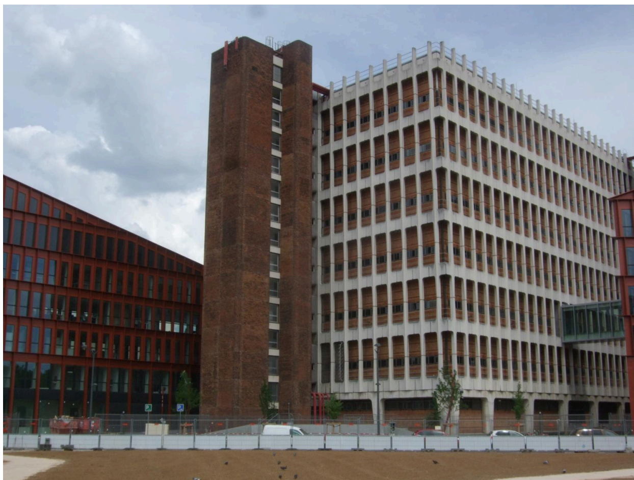
Tour de distribution