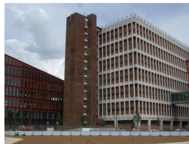
Tour de distribution IVR84_20196900105NUCA

IVR82_20076902267NUCA