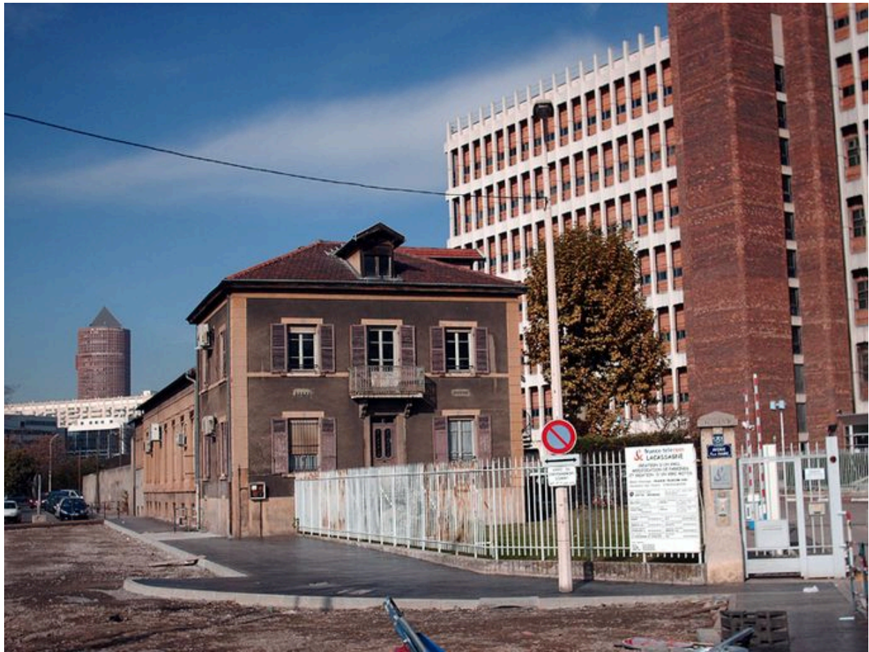
Vue d'ensemble de l'ancien bâtiment administratif de la société Marmonier