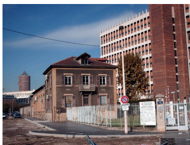
Vue d'ensemble de l'ancien bâtiment administratif de la société Marmonier