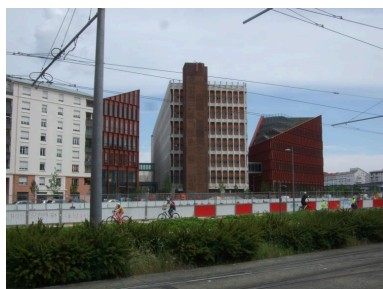
Vue d'ensemble IVR84_20196900104NUCA