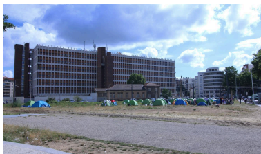
Vue d'ensemble est IVR84_20196900106NUCA

IVR82_20076902267NUCA