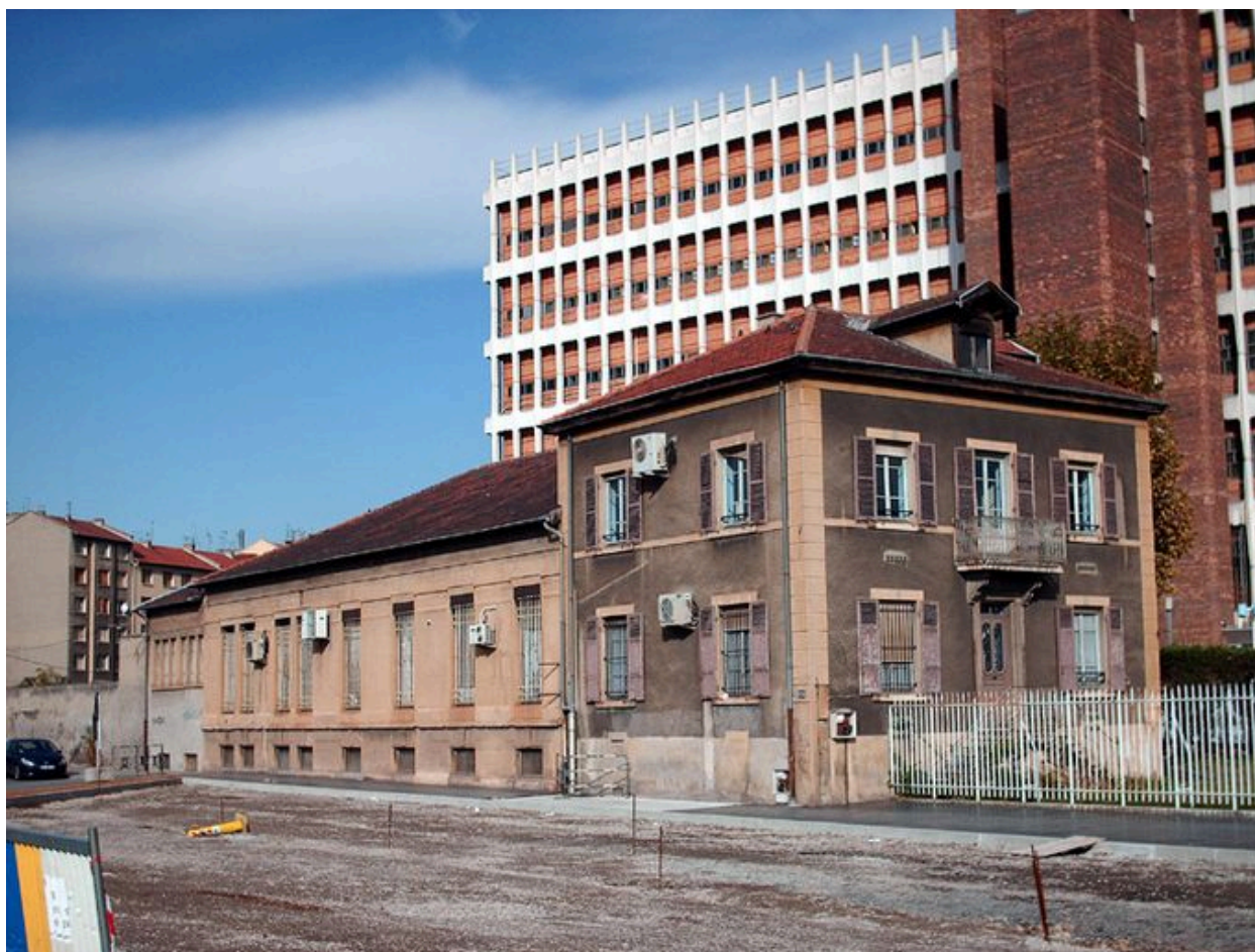
Vue d'ensemble de l'ancien bâtiment administratif des établissements Marmonier