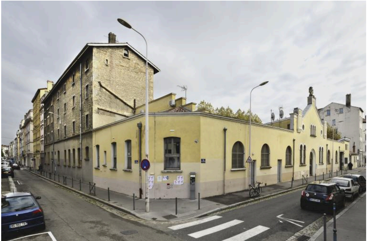
Vue du croisement avec la rue Sébastien-Gryphe, au niveau du couvent du Prado