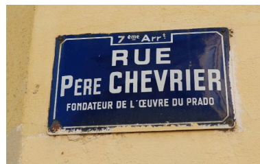
Plaque de la rue du Père Chevrier, à l'angle nord-est du croisement avec la rue Sébastien-Gryphe.