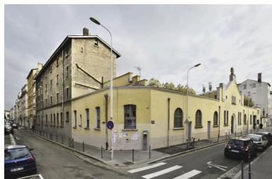
Vue du croisement avec la rue Sébastien-Gryphe, au niveau du couvent du Prado IVR84_20186901179NUCAQ