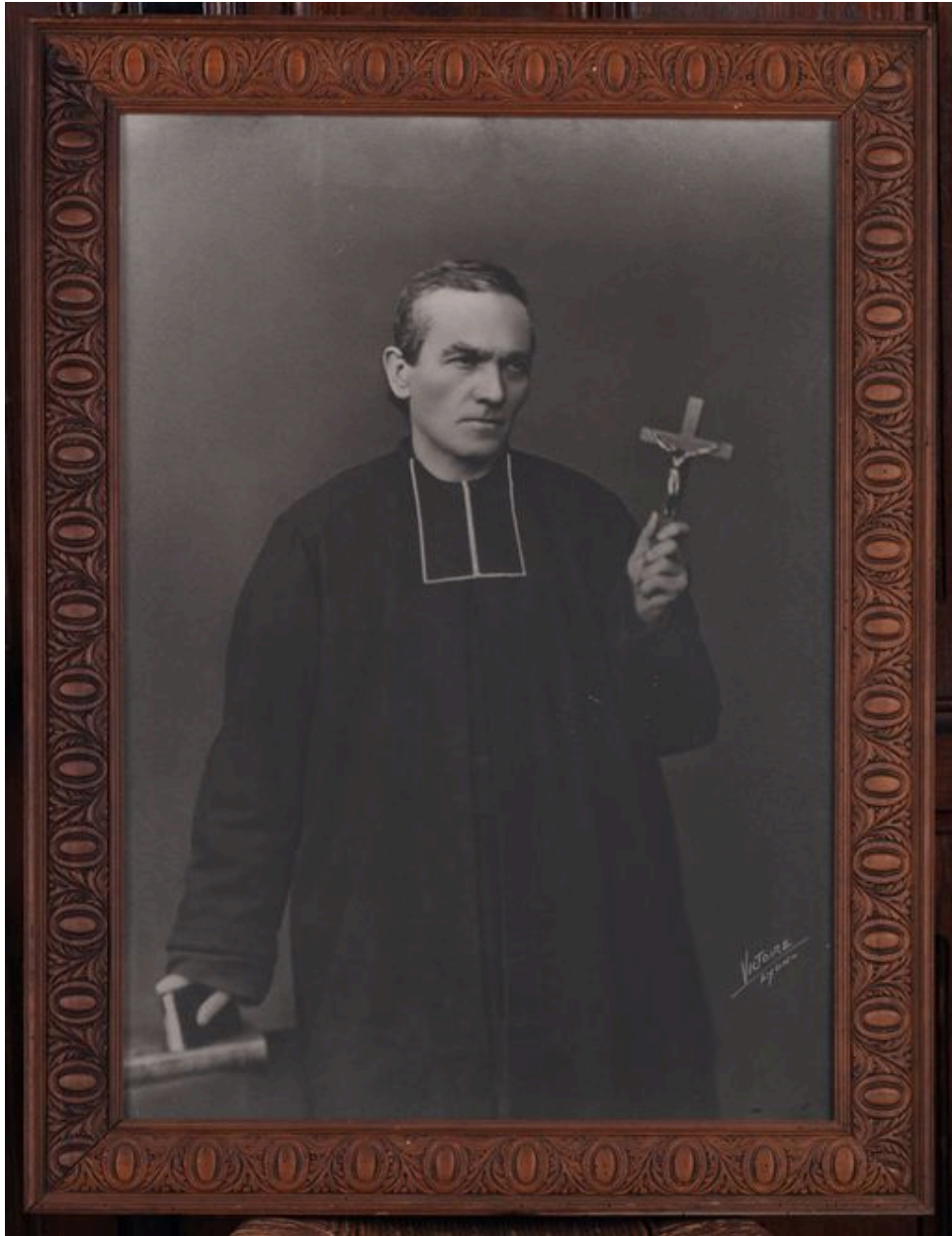
Photographie du père Chevrier.