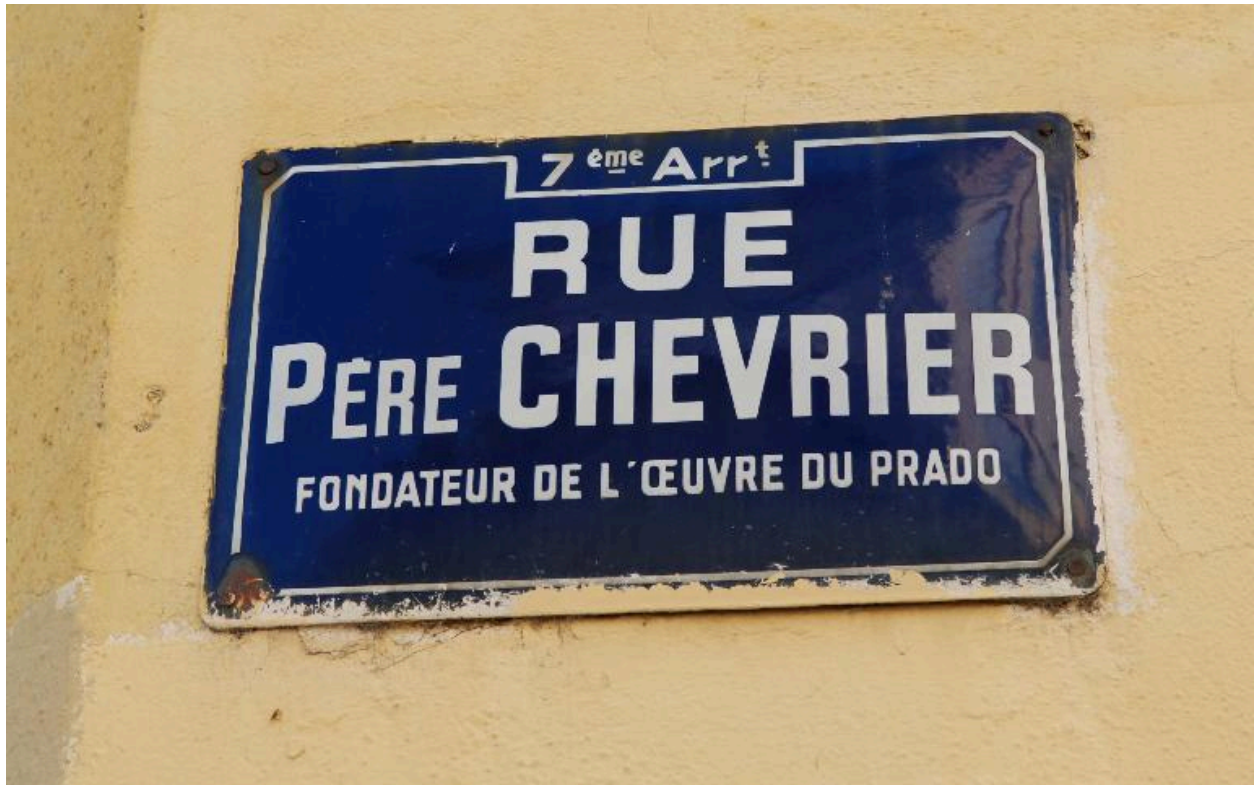
Plaque de la rue du Père Chevrier, à l'angle nord-est du croisement avec la rue Sébastien-Gryphe.