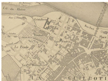
La rue Dumoulin figurée sur le plan topographique de 1847 Repro. Magali Delavenne, Autr. Laurent (dessinateur cartographe) Dignoscyo, Autr. Eugène (ingénieur géographe) Rembielinski