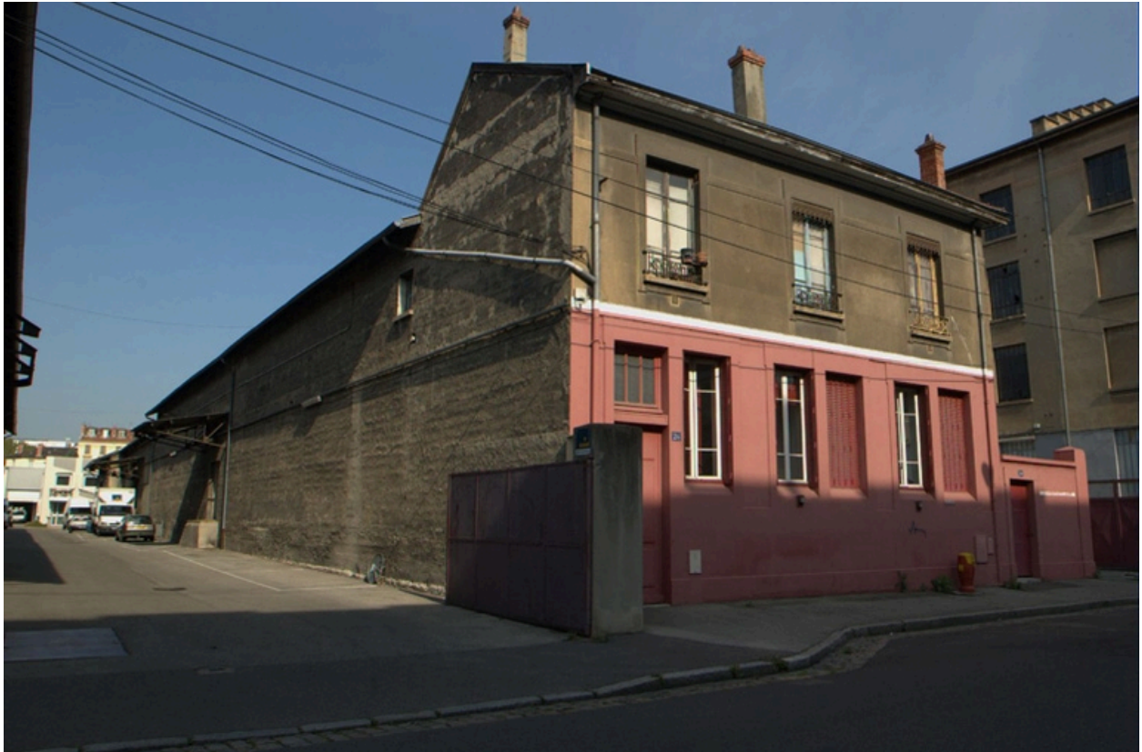
Détail bâtiment 24, 26 rue Paul Massimi