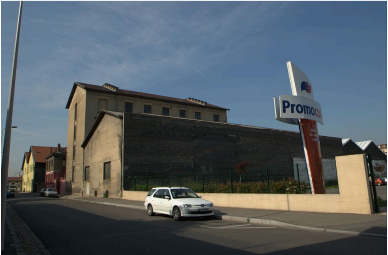
Vue nord-est des entrepôts généraux (rue Paul Massimi)