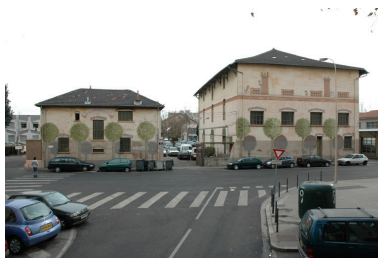
Vue générale ouest, façade rue de Gerland. IVR82_20056902969NUCA