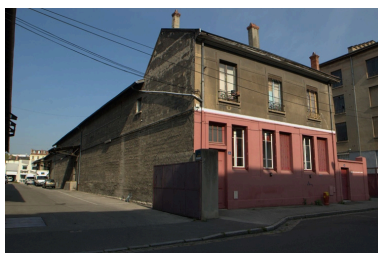
Détail bâtiment 24, 26 rue Paul Massimi IVR82_20086900409NUCA