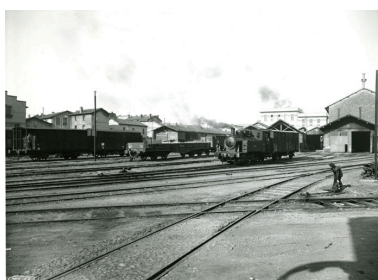
Magasins Généraux vers 1964, (Cuy1) IVR82_20126900215NUCB