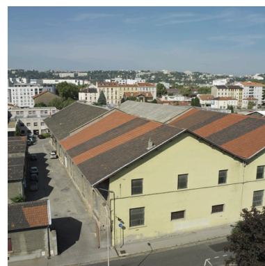
Vue d'ensemble des entrepôts de la rue Massimi IVR82_20066902801NUCA