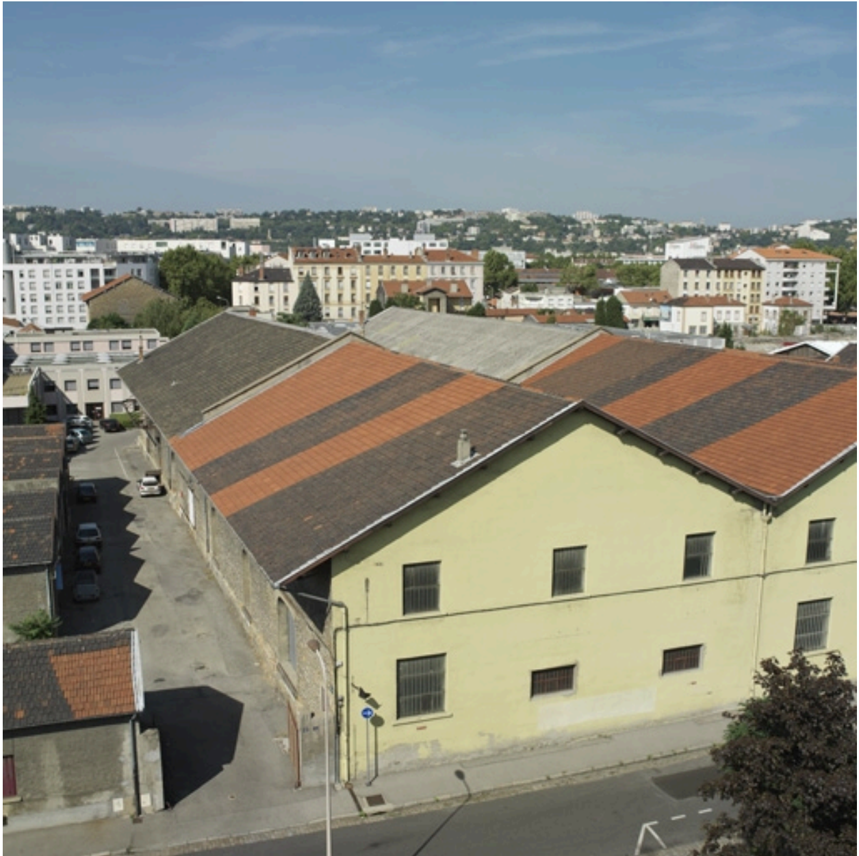
Vue d'ensemble des entrepôts de la rue Massimi