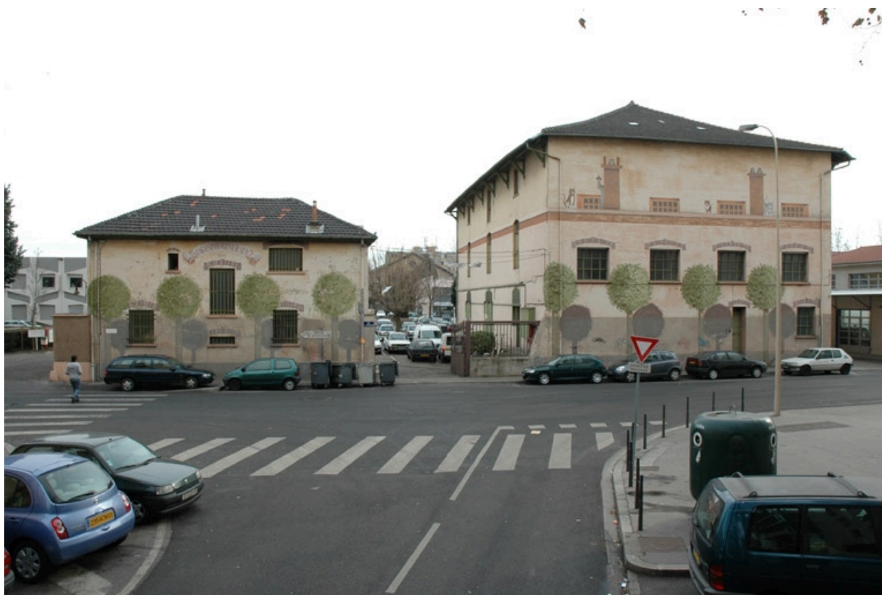
Vue générale ouest, façade rue de Gerland.