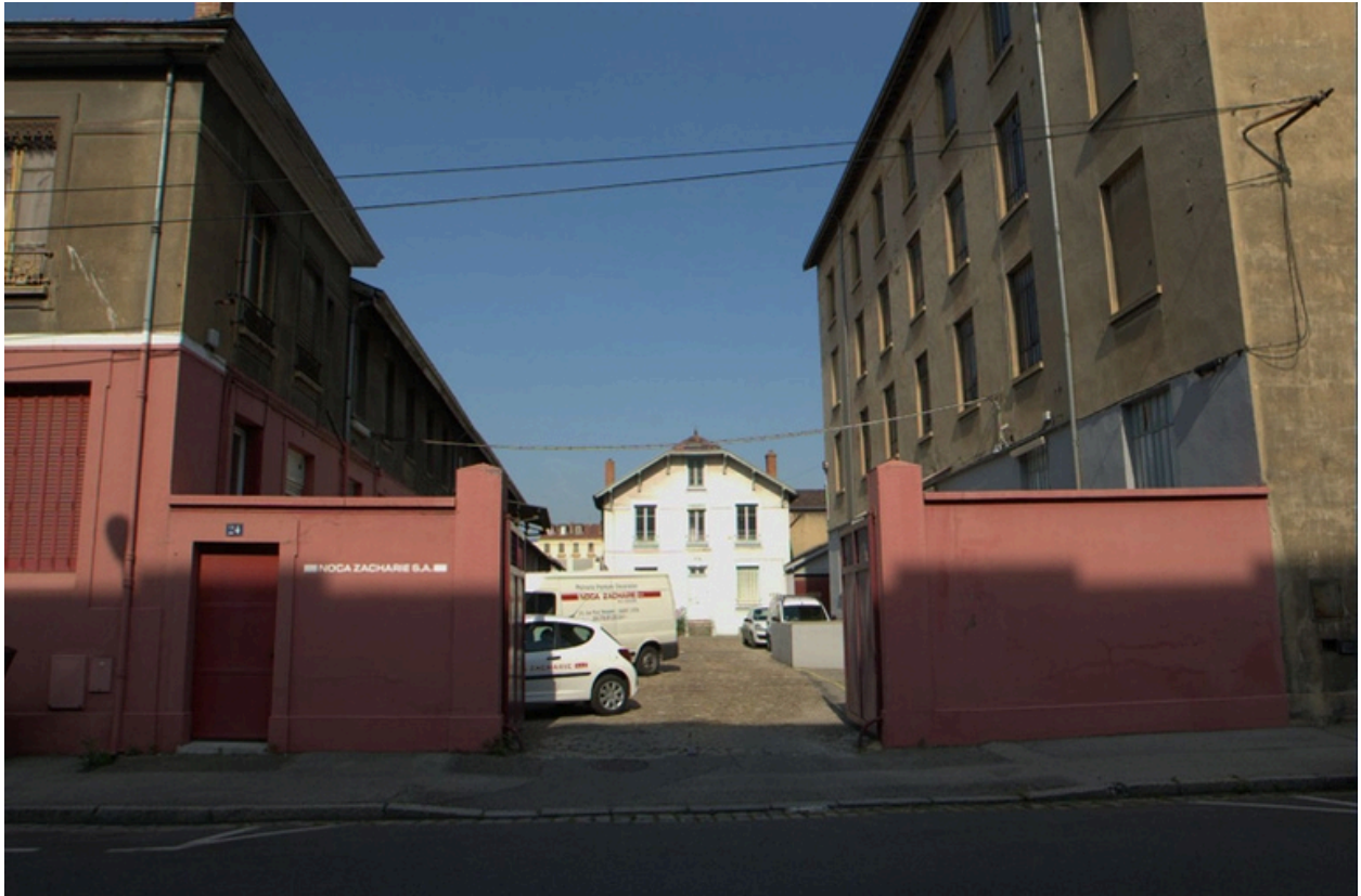
Entrée du 24, 26 rue Paul Massimi