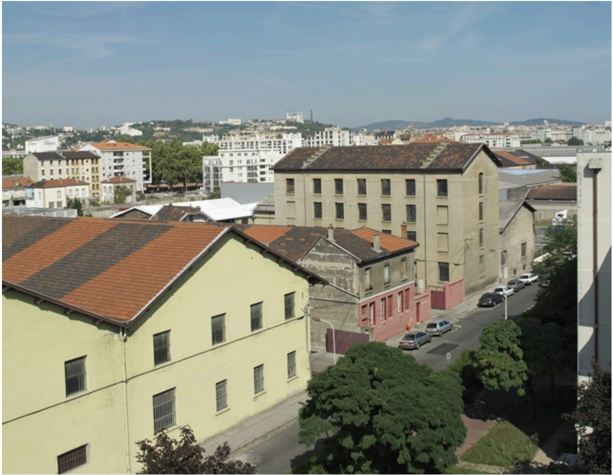
Vue d'ensemble sud de la rue Massimi