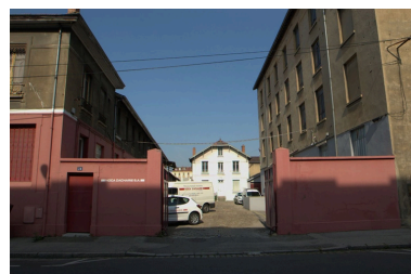
Entrée du 24, 26 rue Paul Massimi IVR82_20086900410NUCA