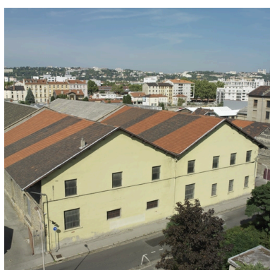
Vue d'ensemble de la double halle rue Massimi (sud-est)