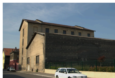
Vue du nord-est