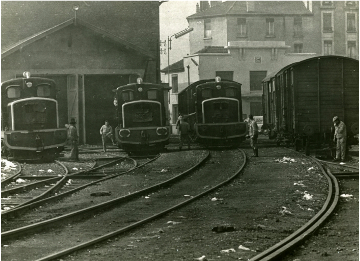
Magasins Généraux vers 1964