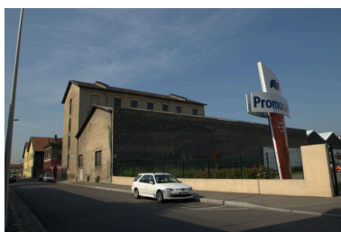
Vue nord-est des entrepôts généraux (rue Paul Massimi) IVR82_20086900406NUCA