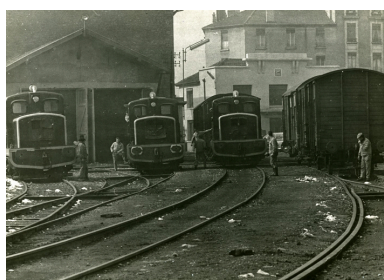
Magasins Généraux vers 1964