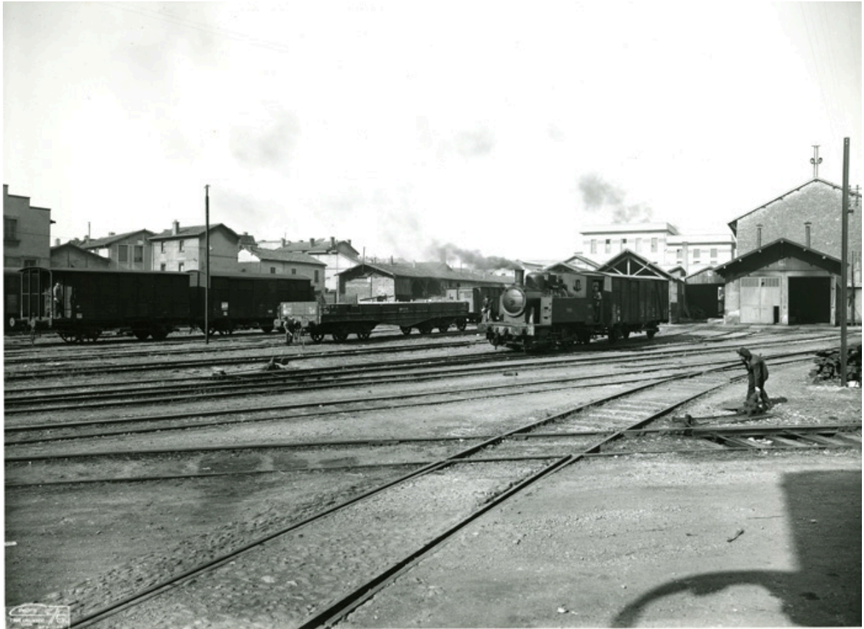
Magasins Généraux vers 1964, (Cuyl)