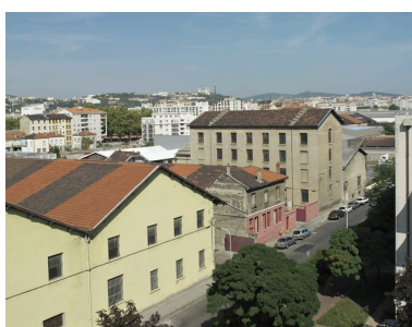
Vue d'ensemble sud de la rue Massimi IVR82_20066902803NUCA