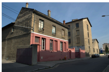
Vue sud-est IVR82_20086900408NUCA