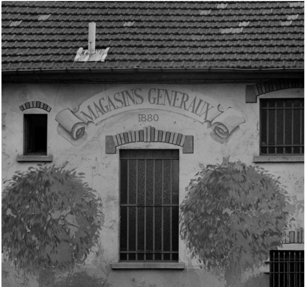
Enseigne et date portée