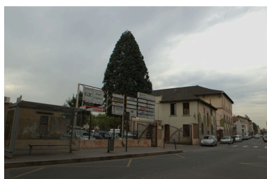
Vue d'ensemble nord-ouest IVR82_20086900500NUCA