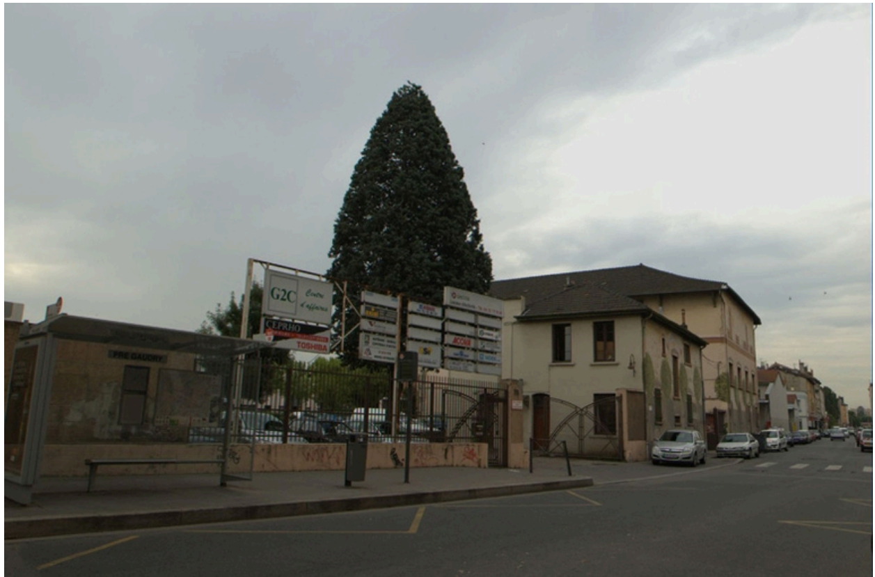
Vue d'ensemble nord-ouest