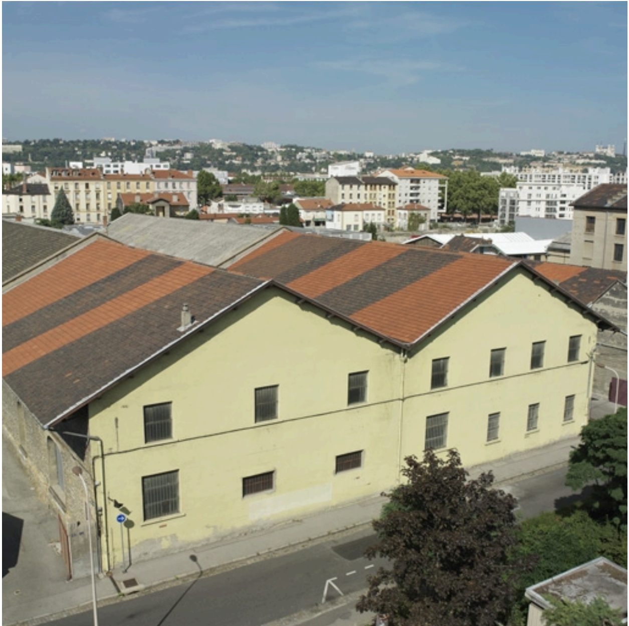
Vue d'ensemble de la double halle rue Massimi (sud-est)