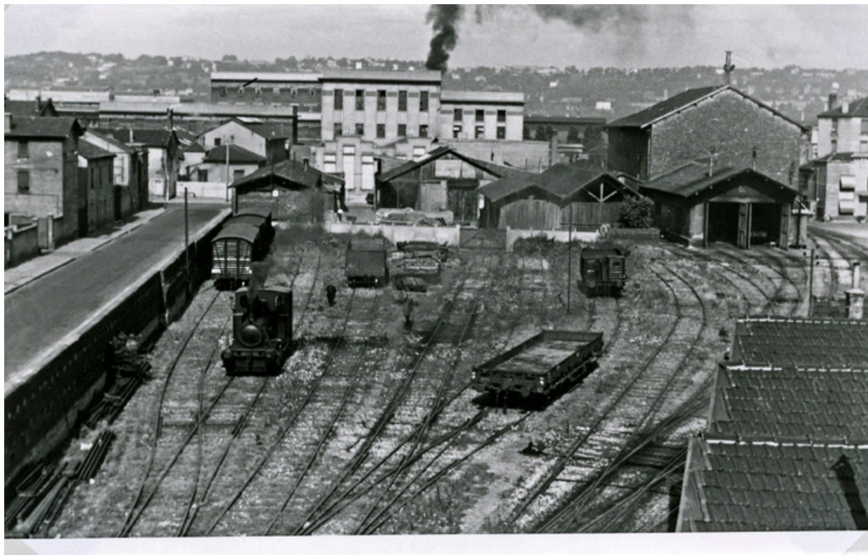
1954 - FAISCEAU DE TRIAGE des MAGASINS GENERAUX

Faisceau de triage des magasins généraux, 1954