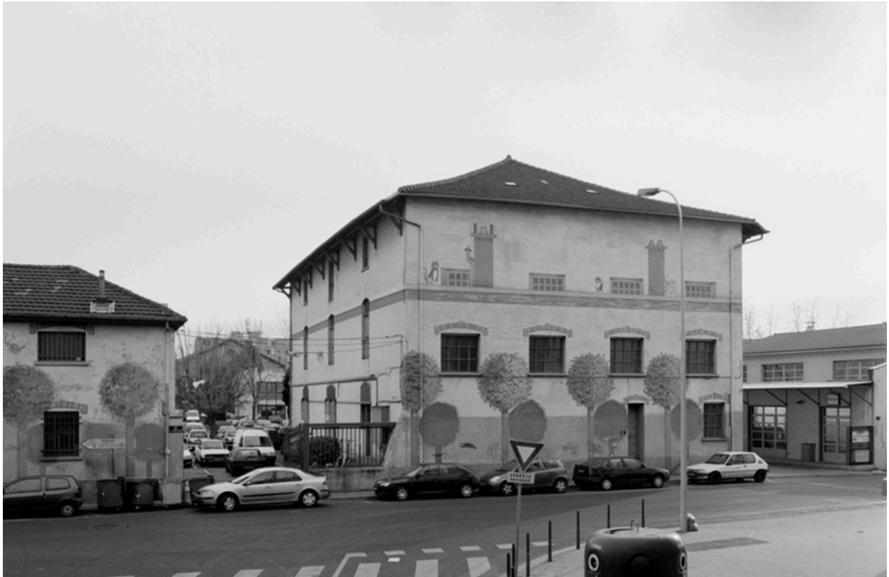
Vue du grand entrepôt