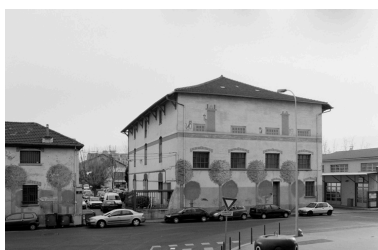
Vue du grand entrepôt IVR82_20066900062X