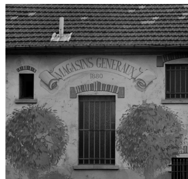
Enseigne et date portée IVR82_20066900060X