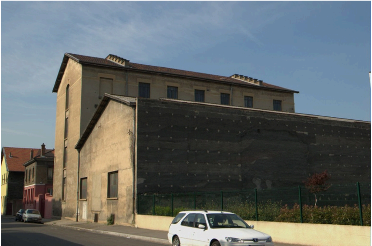
Vue du nord-est