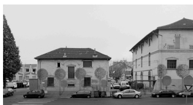
Vue d'ensemble IVR82_20066900061X