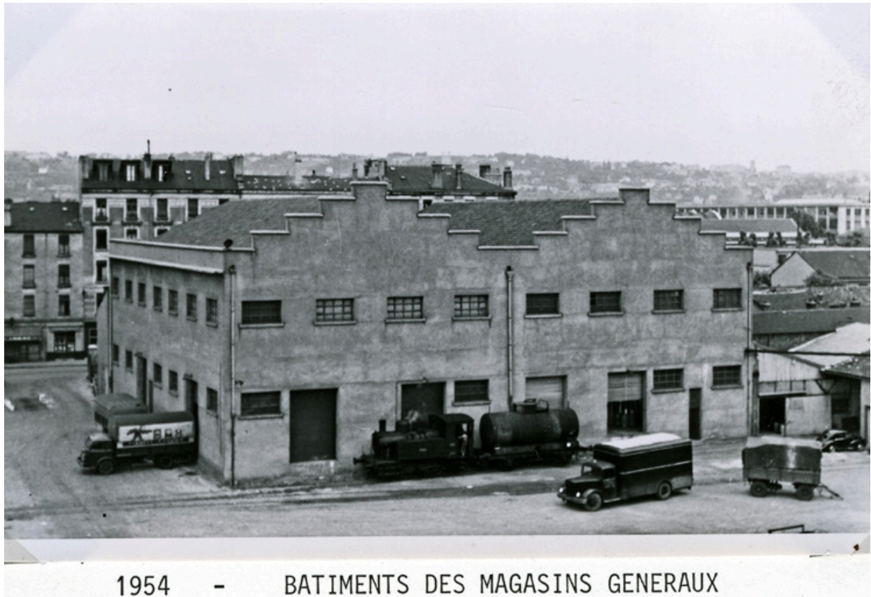
Bâtiments des magasins généraux