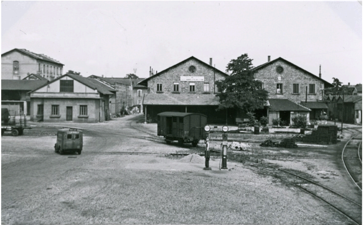
1954 - BATIMENTS DES MAGASINS GÉNÉRAUX