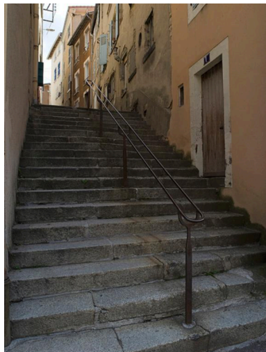
Les escaliers de la rue, depuis le bas. IVR83_20116300808NUC4A