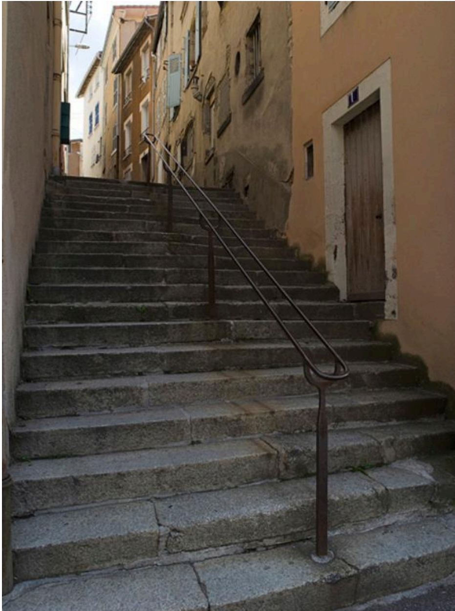
Les escaliers de la rue, depuis le bas.