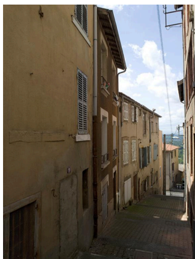
La rue depuis le haut. IVR83_20116300814NUC4A