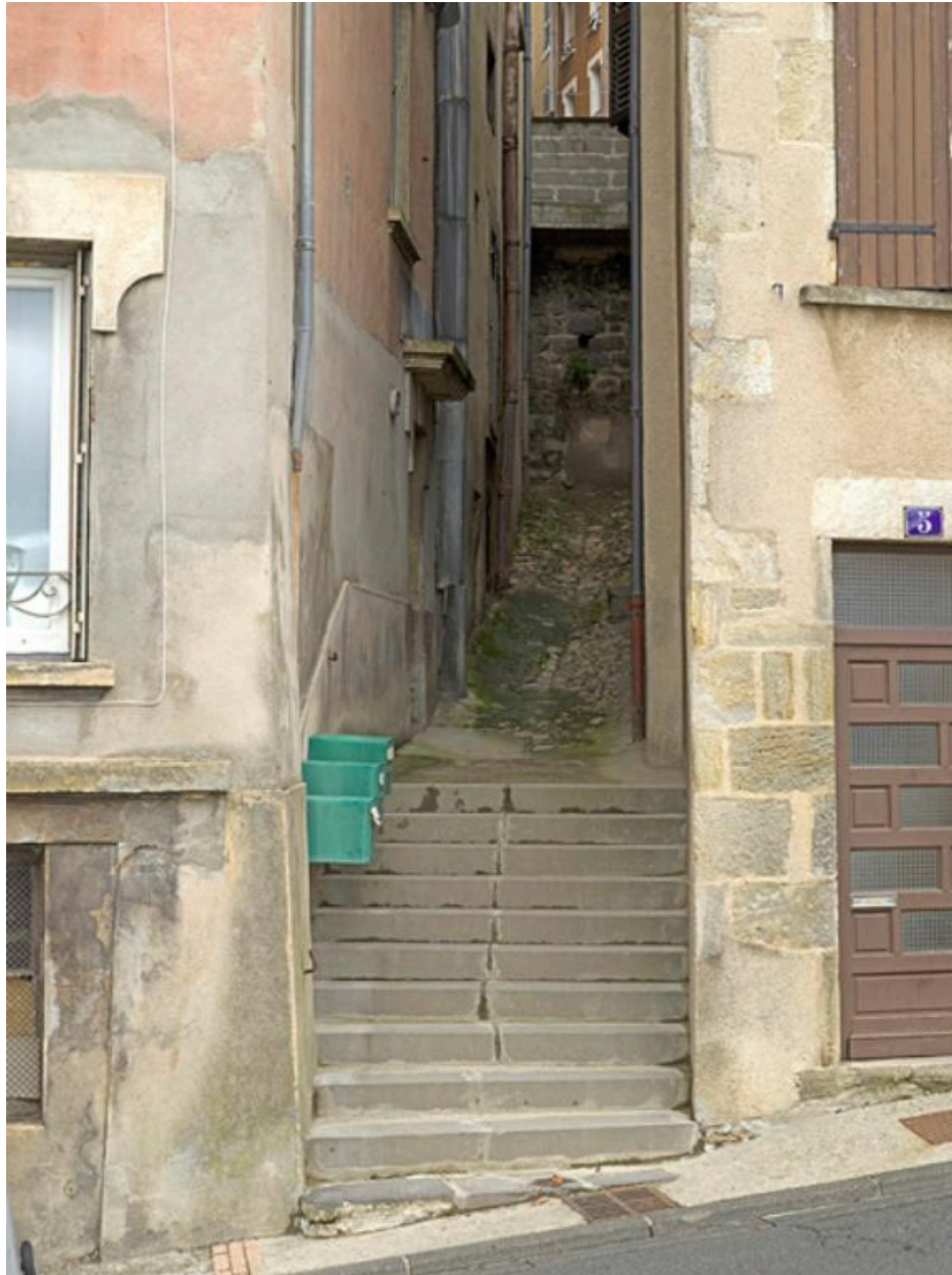
Vestiges de l'ancienne partie basse de la rue, aujourd'hui impasse ouvrant sur la rue de Barante.