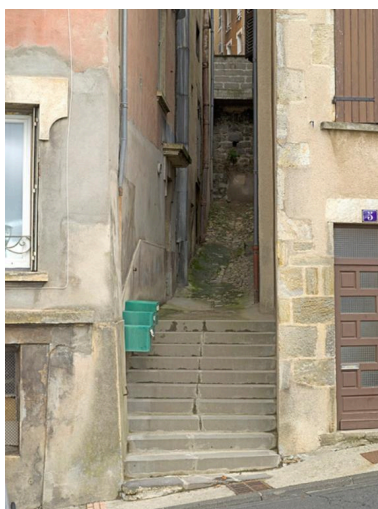
Vestiges de l'ancienne partie basse de la rue, aujourd'hui impasse ouvrant sur la rue de Barante.