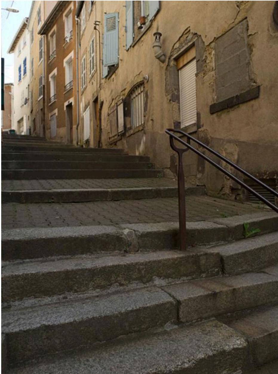
La rue, depuis celle des Docteurs-Dumas en contrebas.