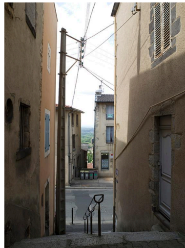
La rue en direction de la rue des Docteurs-Dumas, vers le bas. Dans l'axe, de l'autre côté du carrefour, l'ancien prolongement de la rue, aujourd'hui en impasse.