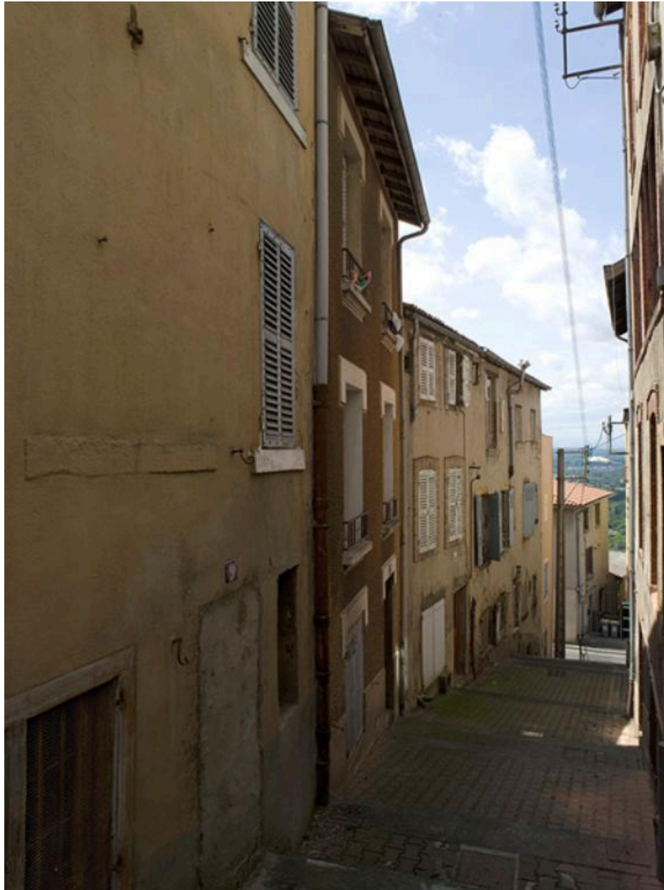
La rue depuis le haut.