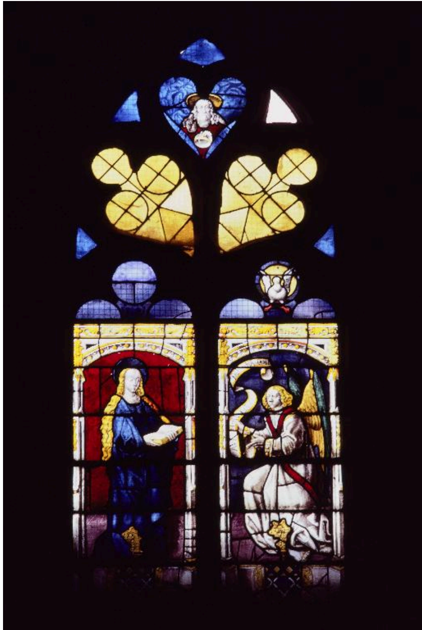
Baie 102 : Annonciation