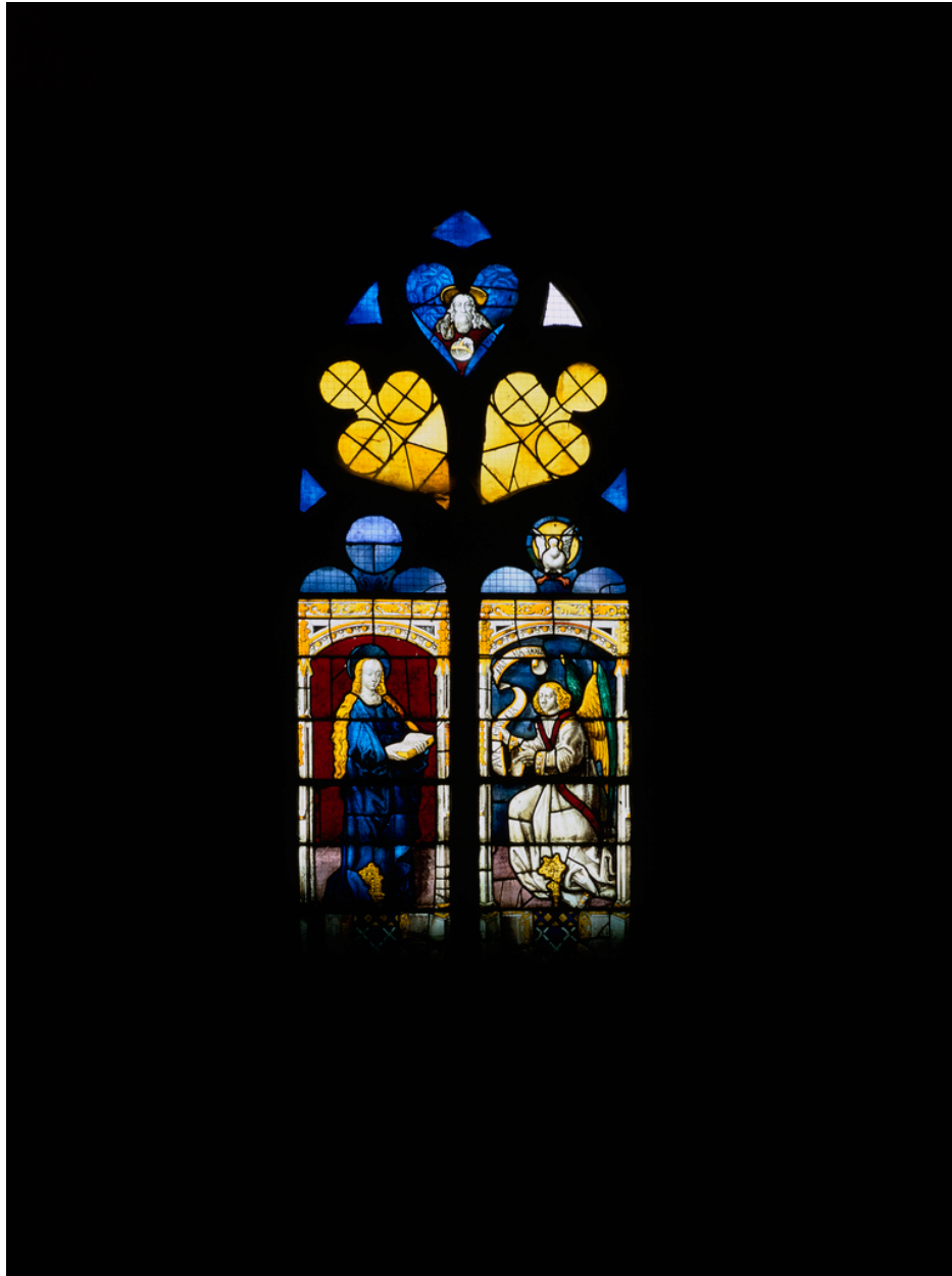
Baie 102 : Annonciation