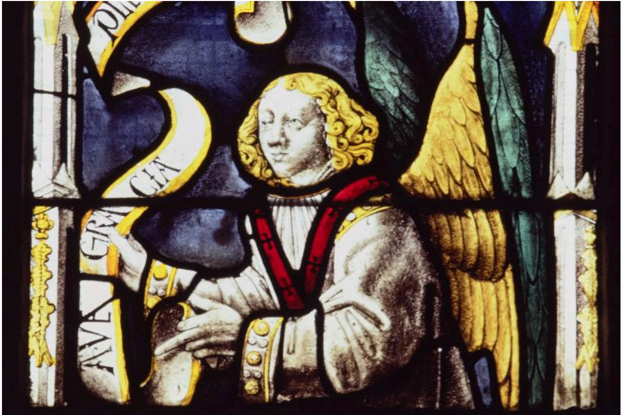
Baie 102 : Saint Gabriel