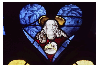
Baie 102 : Dieu le Père