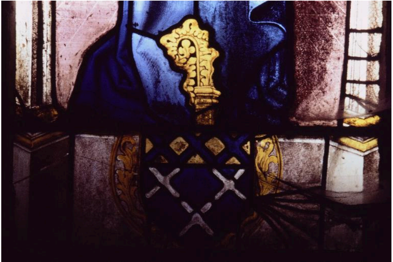
Baie 102 : vêtement de la Vierge