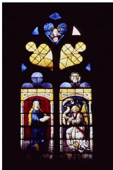
Baie 102 : Annonciation IVR82_19814200132ZA