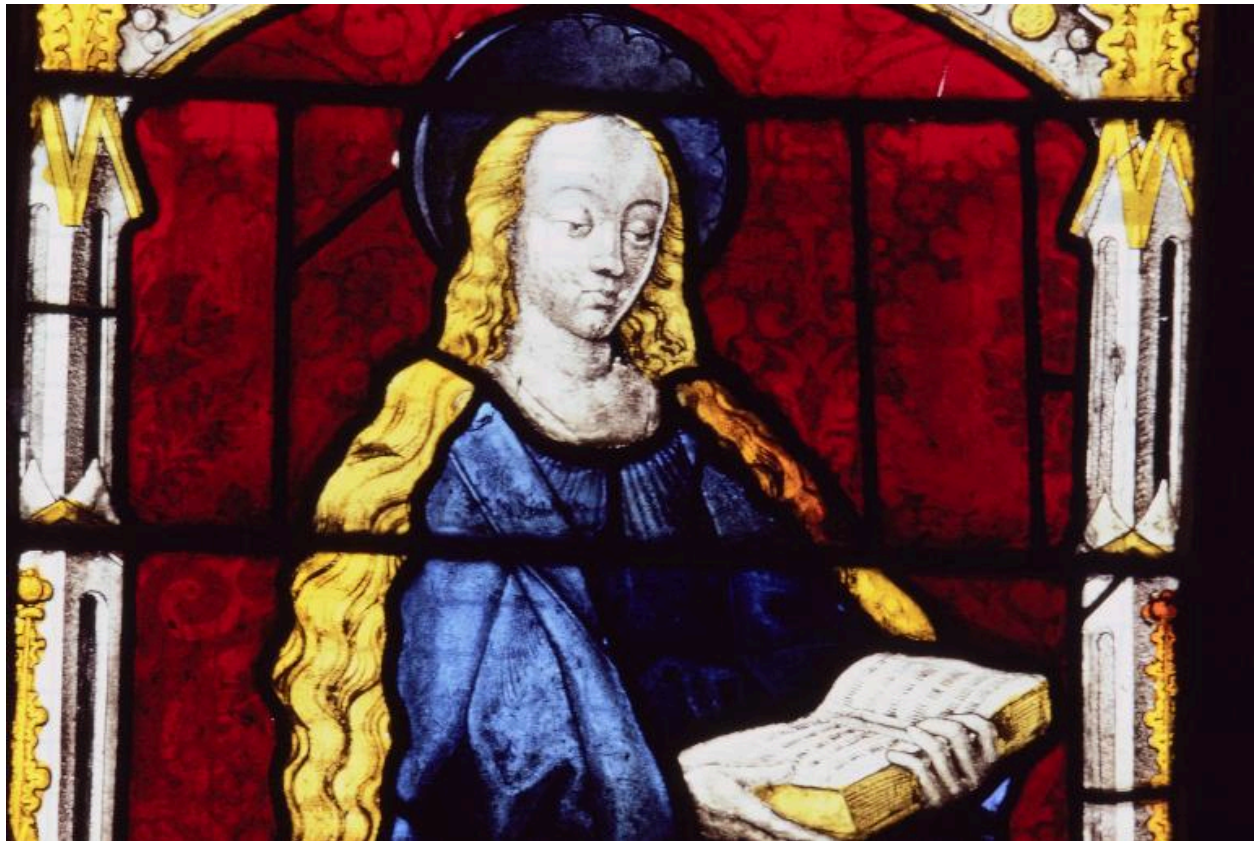
Baie 102 : la Vierge