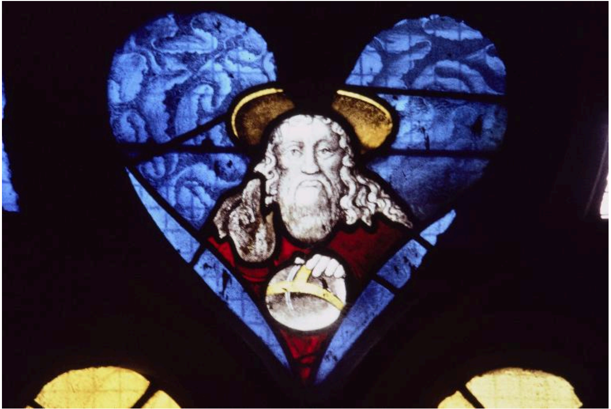
Baie 102 : Dieu le Père