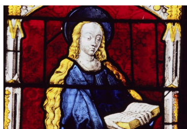
Baie 102 : la Vierge IVR82_19814200135ZA