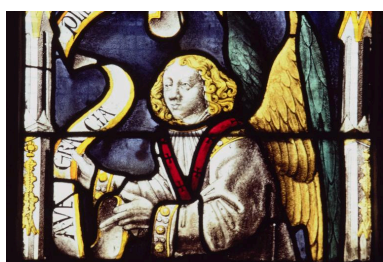
Baie 102 : Saint Gabriel IVR82_19814200134ZA