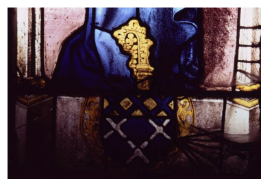
Baie 102 : vêtement de la Vierge IVR82_19814200137ZA