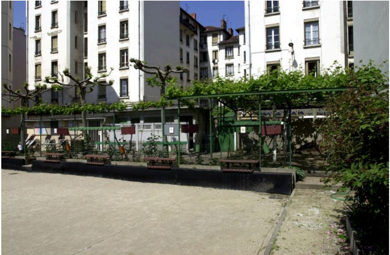
Vue d'ensemble de la tonnelle