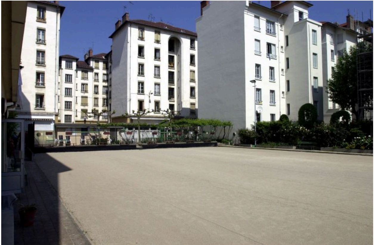
Vue du jeu de boules depuis le sud-est