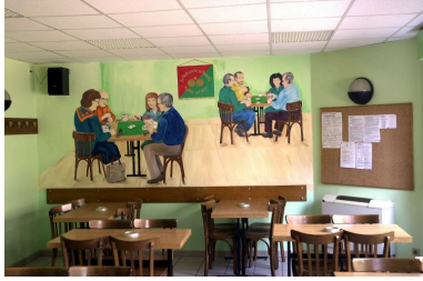
La partie de cartes, un des murs peints du local IVR82_20016902083NUCA