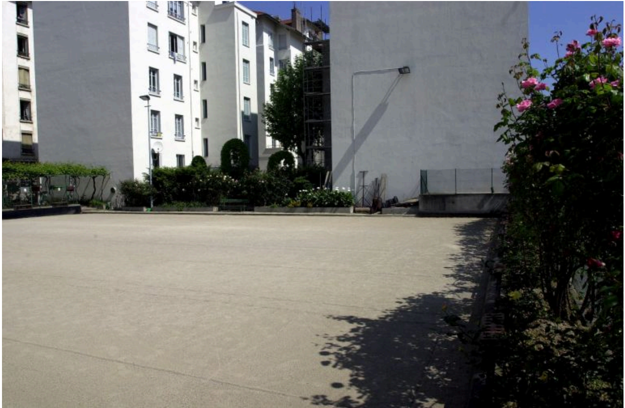
Le jeu de boules depuis le sud