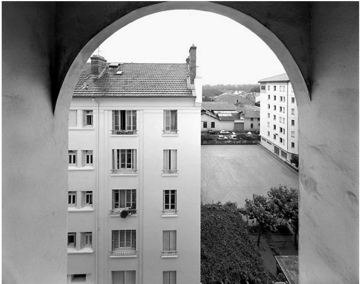
Vue du boulodrome depuis le 34 rue Quivogne