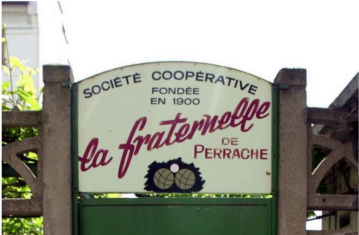
Détail de l'enseigne au-dessus de la porte d'entrée