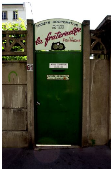
Vue de la porte, rue Quivogne IVR82_20016902081NUCA