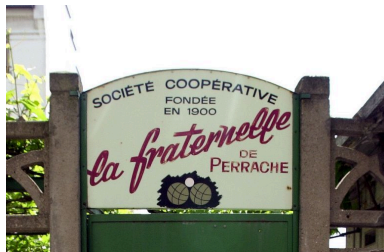
Détail de l'enseigne au-dessus de la porte d'entrée IVR82_20016902078NUCA