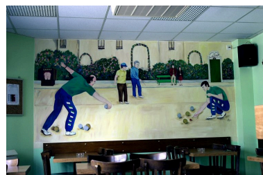
La partie de boules, un des mur peint du local IVR82_20016902084NUCA