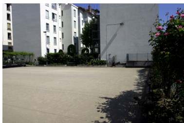
Le jeu de boules depuis le sud