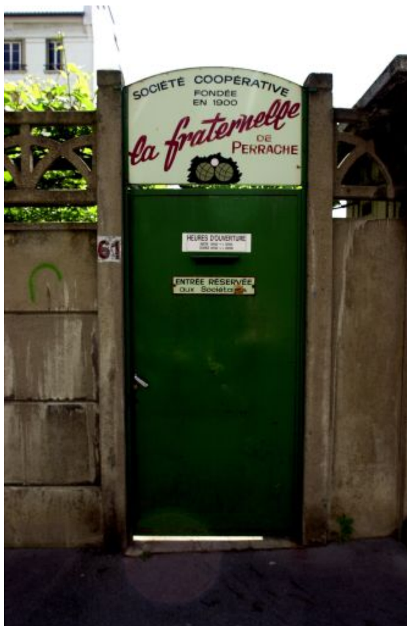
Vue de la porte, rue Quivogne