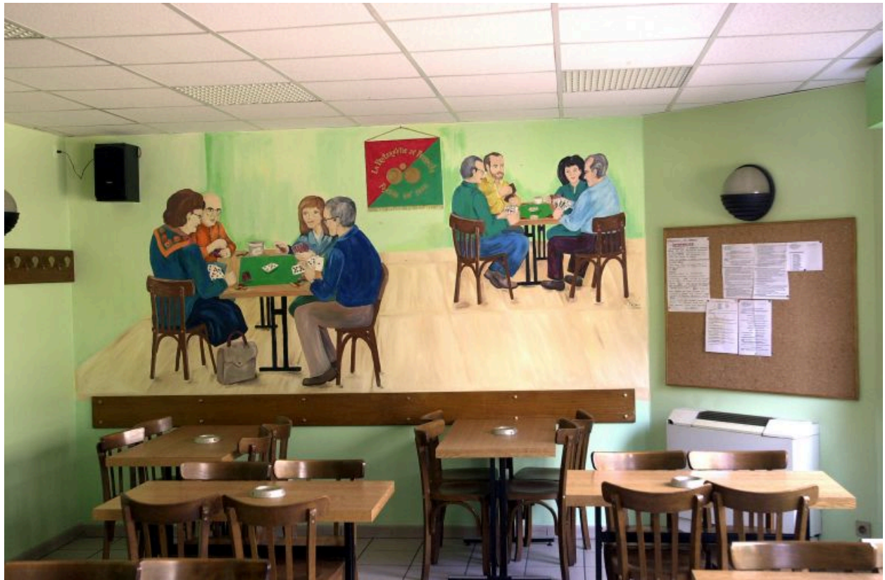
La partie de cartes, un des murs peints du local