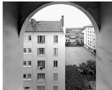
Vue du boulodrome depuis le 34 rue Quivogne IVR82_20016902921V