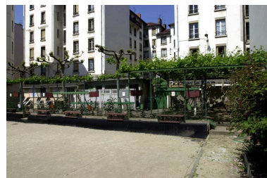
Vue d'ensemble de la tonnelle IVR82_20016902079NUCA