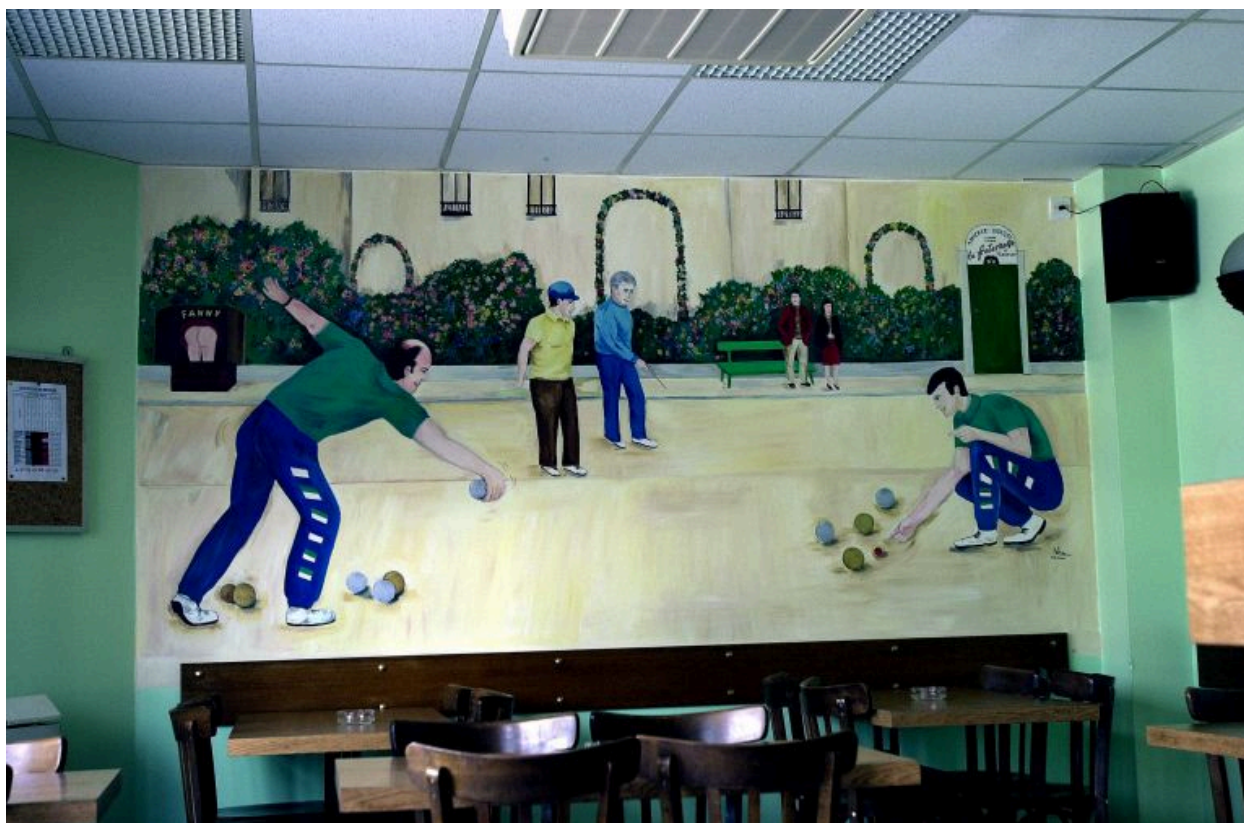
La partie de boules, un des mur peint du local