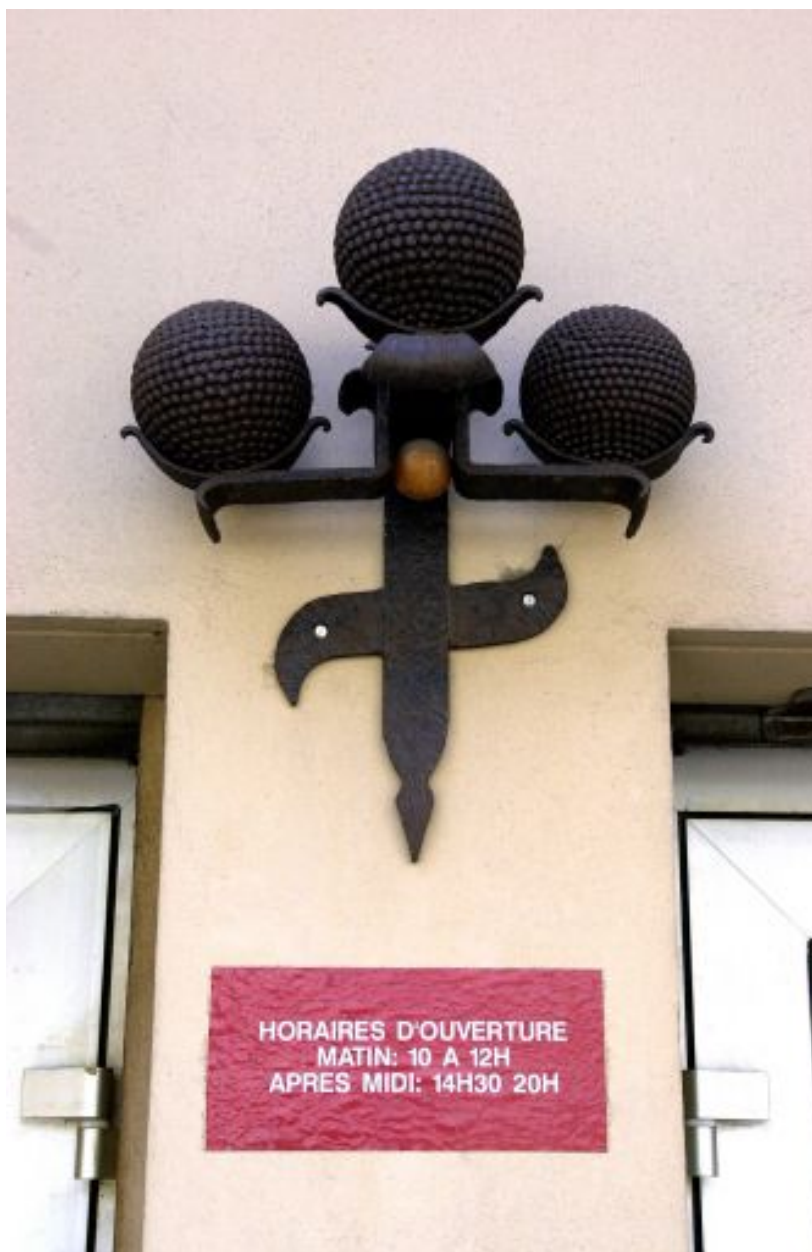
Détail des boules anciennes montées en façade