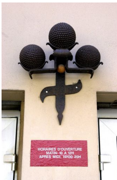
Détail des boules anciennes montées en façade IVR82_20016902080NUCA