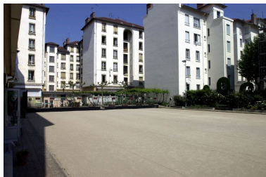
Vue du jeu de boules depuis le sud-est IVR82_20016902076NUCA