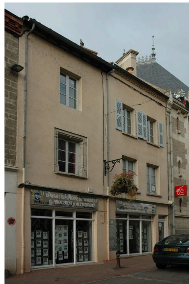
Vue générale (1ère maison). IVR82_20114202307NUCA