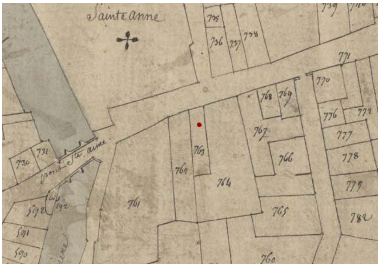
Extrait du plan cadastral de 1809, parcelle E 763.