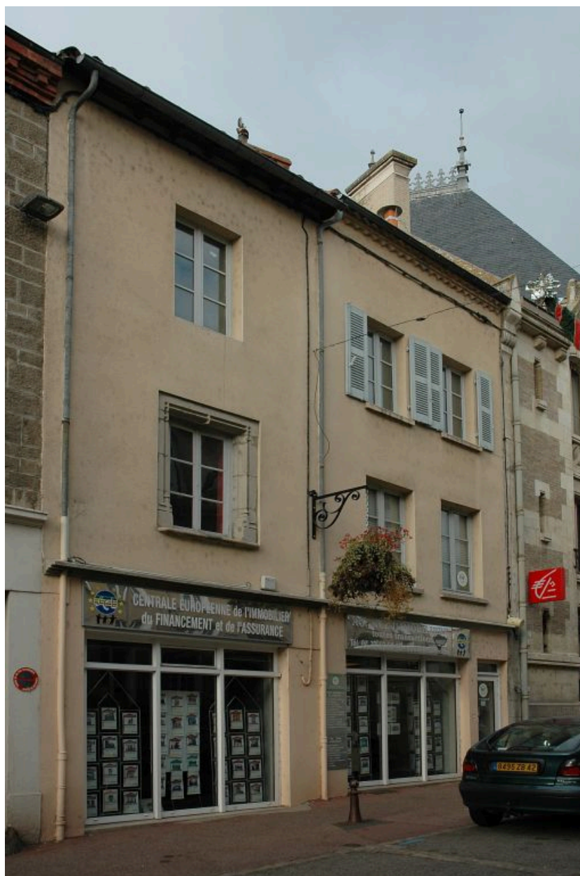
Vue générale (1ère maison).