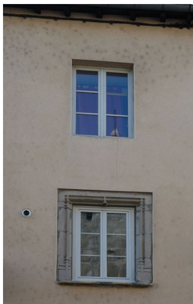
Fenêtre à encadrement de grès mouluré sur bases prismatiques