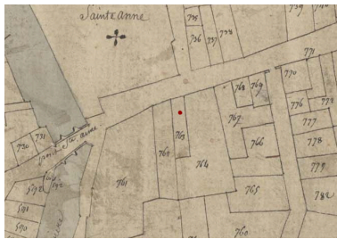
Extrait du plan cadastral de 1809, parcelle E 763. IVR82_20114202343NUD