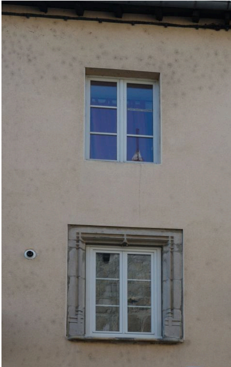
Fenêtre à encadrement de grès mouluré sur bases prismatiques