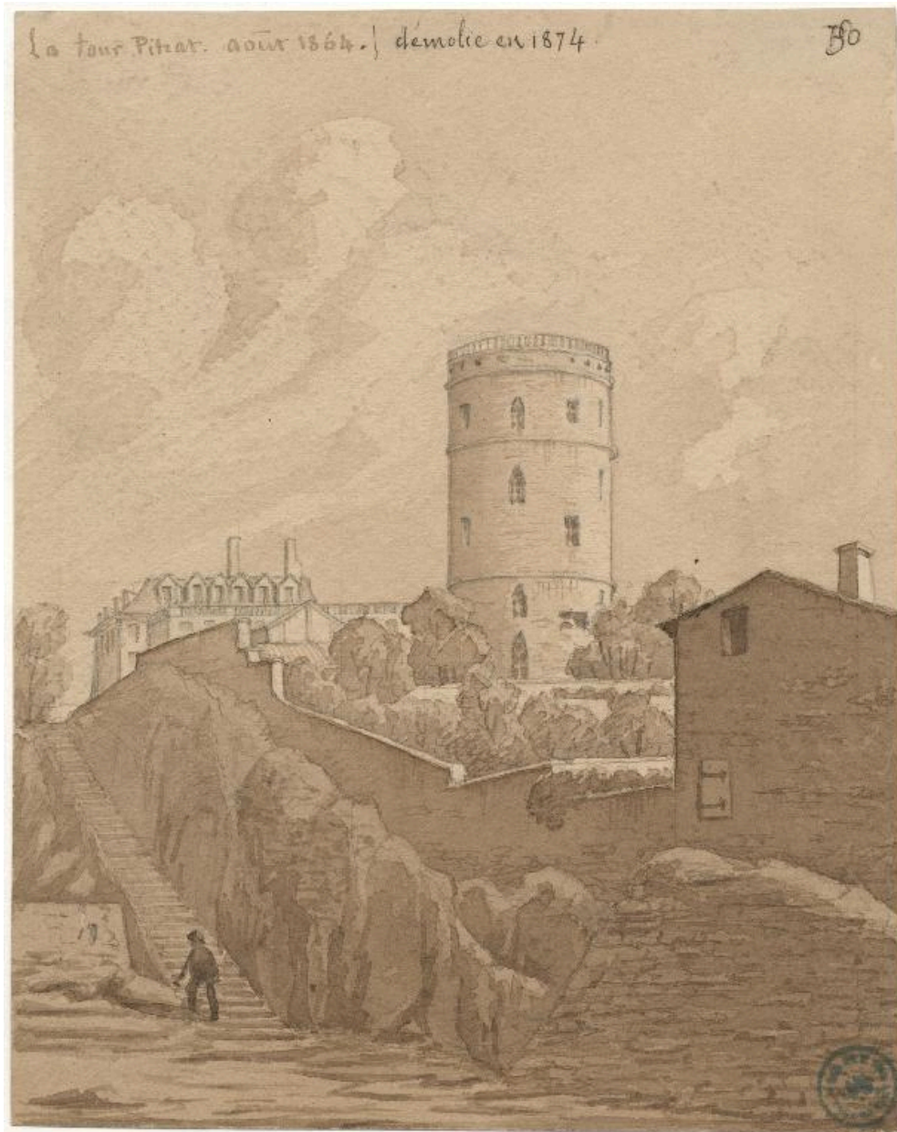
La Tour Pitrat, août 1864. démolie en 1874. / Paul Saint-Olive. (BM Lyon, Res Est 152 729 T1 f°102 pl 193)