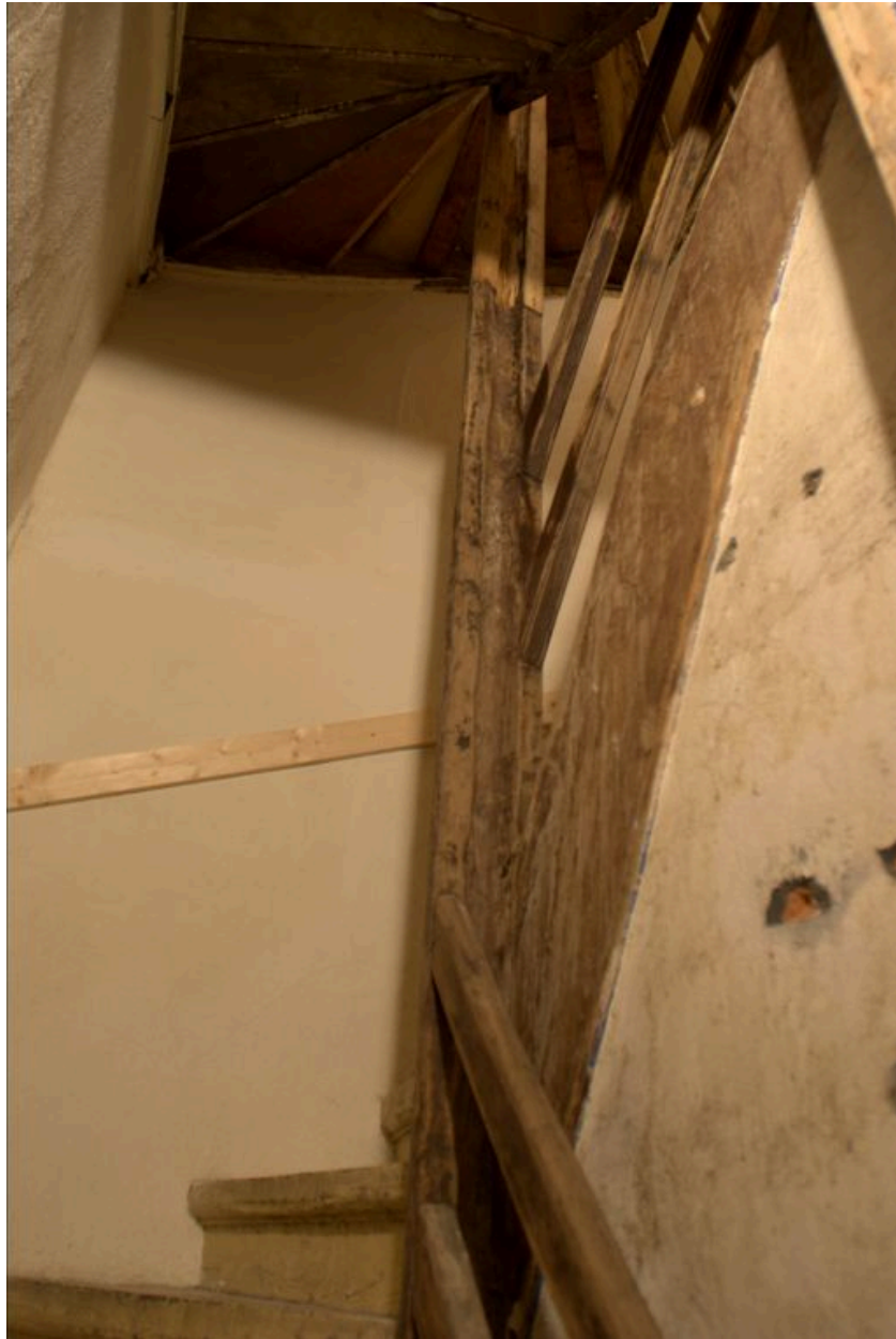
Vue de l'escalier