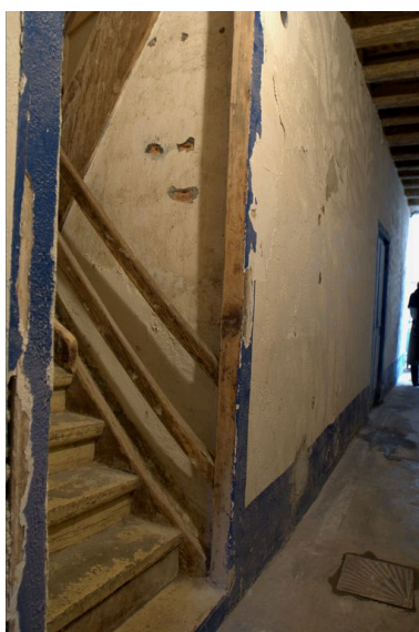
Le départ de l'escalier IVR82_20086900855NUCA