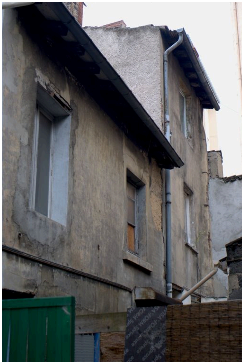
Elévation postérieure depuis le sud-ouest