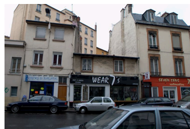
Vue d'ensemble depuis le nord IVR82_20086900851NUCA