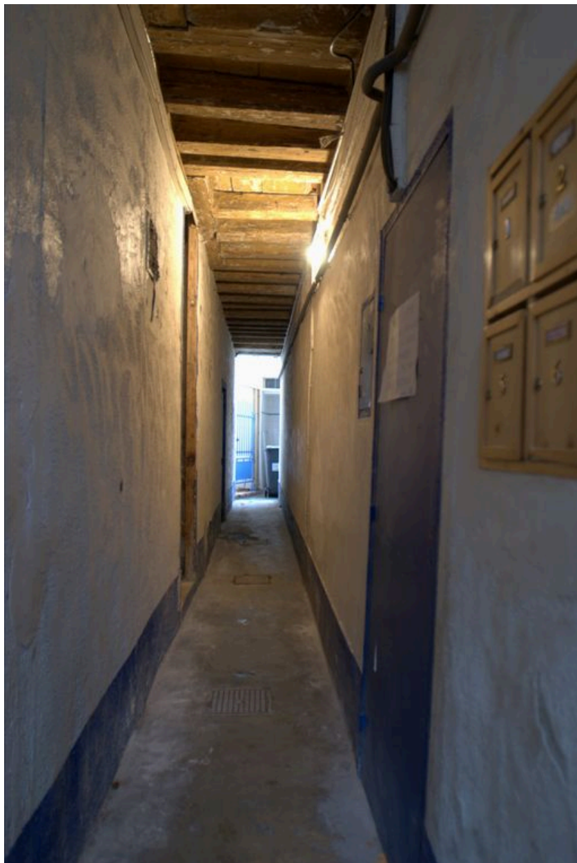
Le couloir d'entrée depuis la porte de l'immeuble