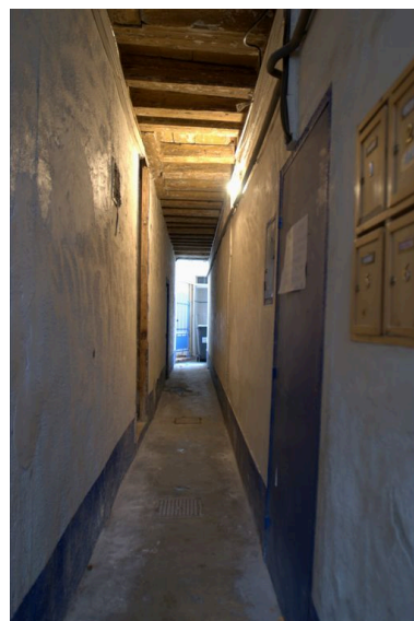
Le couloir d'entrée depuis la porte de l'immeuble