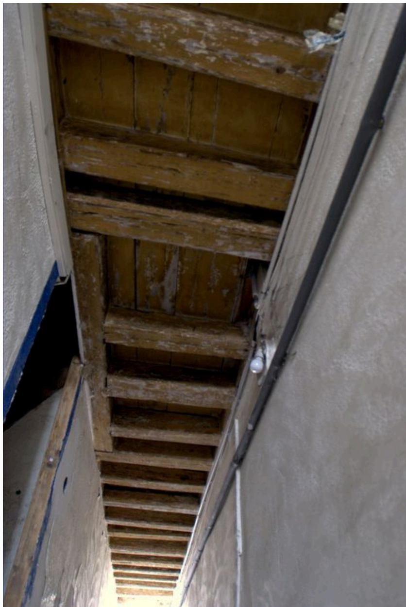
Le plafond à solives du couloir d'entrée