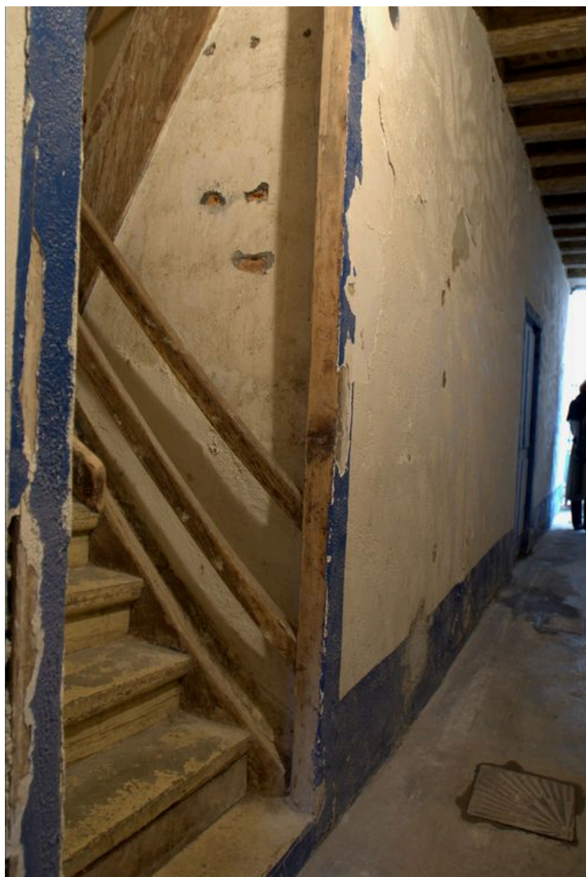
Le départ de l'escalier