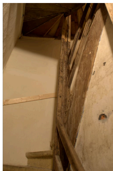
Vue de l'escalier IVR82_20086900856NUCA