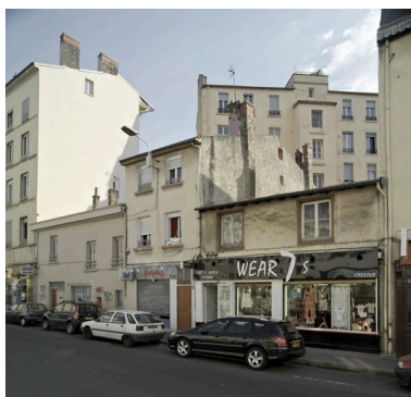
Vue d'ensemble depuis le nord-ouest IVR82_20076902438NUCA