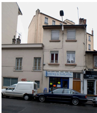
Elévation principale IVR82_20096901284NUCA