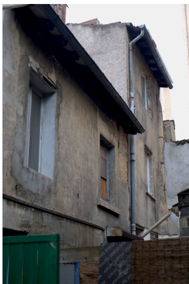
Elévation postérieure depuis le sud-ouest IVR82_20086900852NUCA