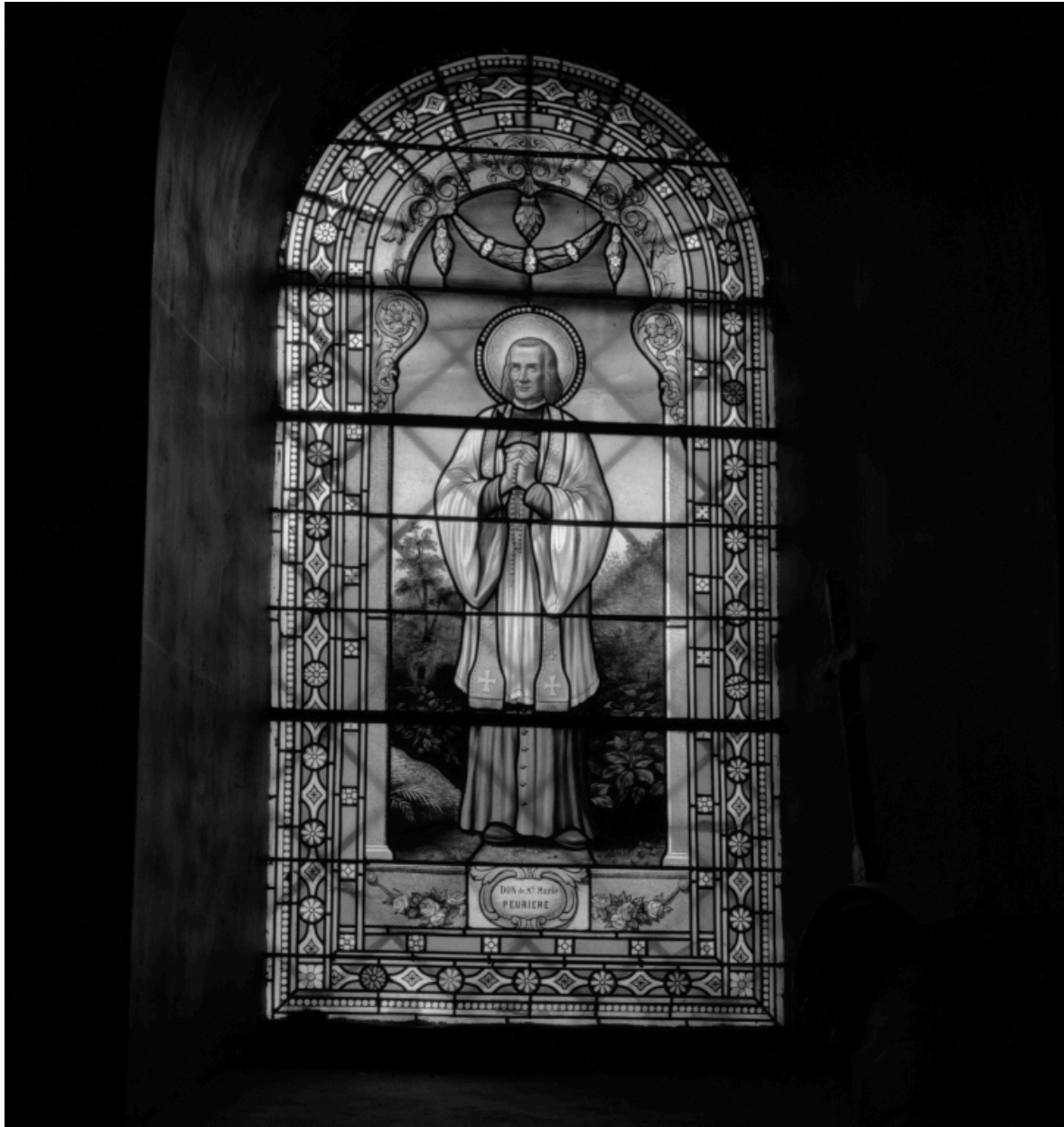
Vue d'ensemble de la baie n°13 : le curé d'Ars.