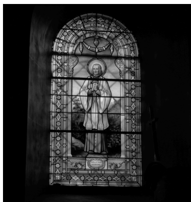
Vue d'ensemble de la baie n°13 : le curé d'Ars. IVR82_20034200495X