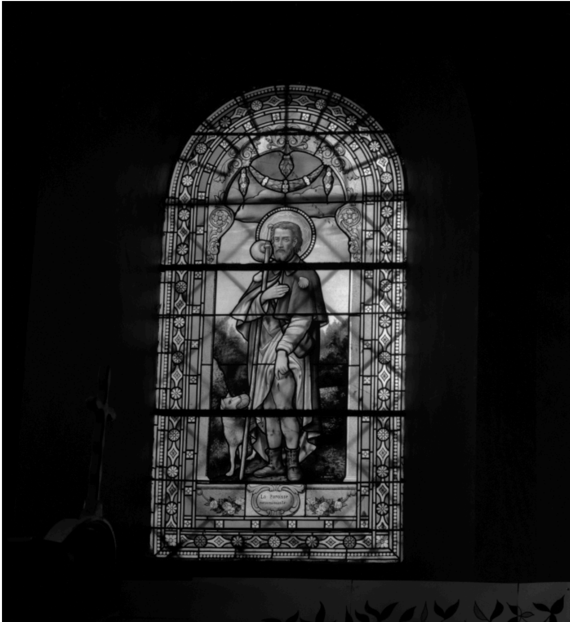
Vue d'ensemble de la baie n°14 : saint Roch.