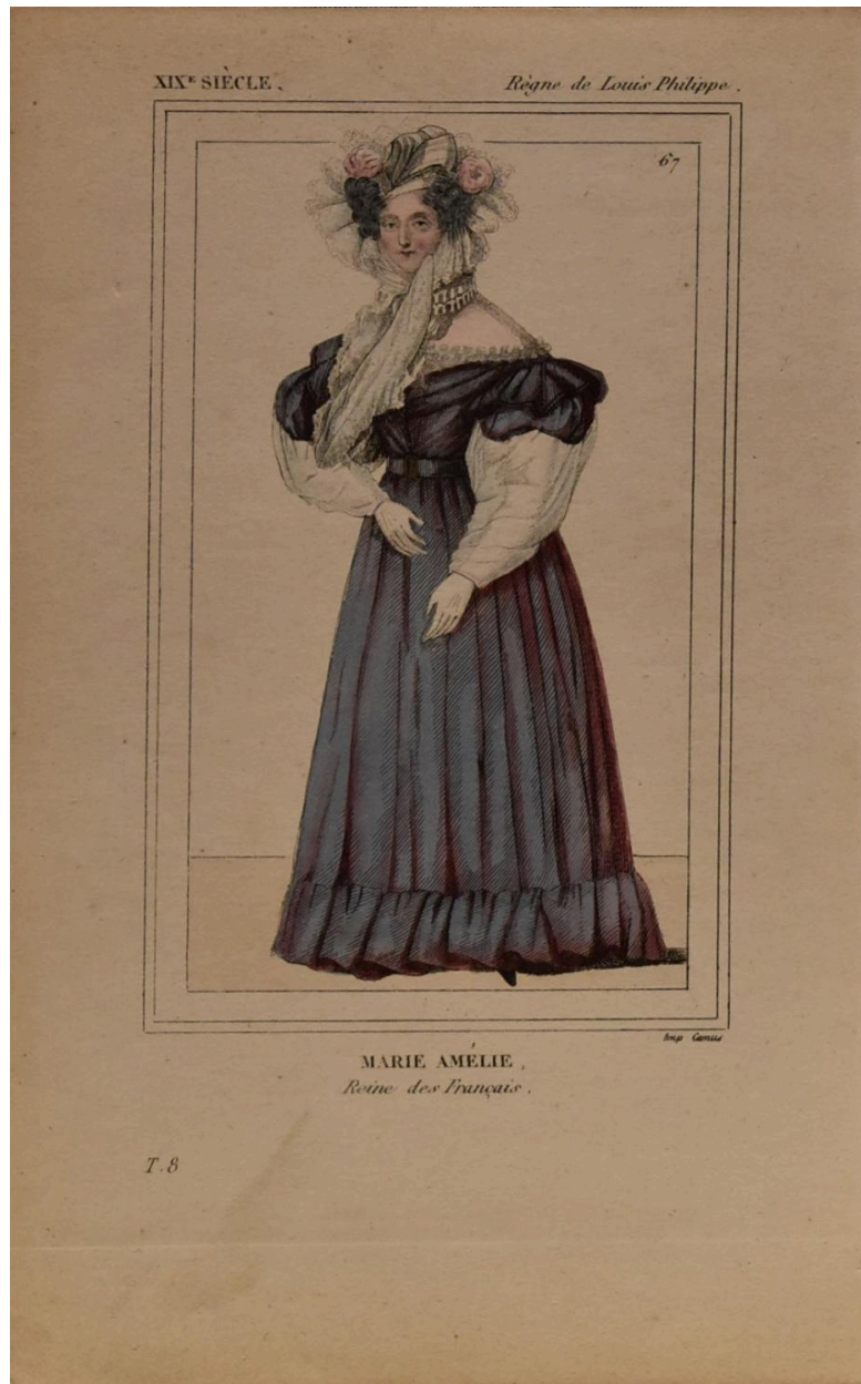
Marie-Amélie, reine des Français