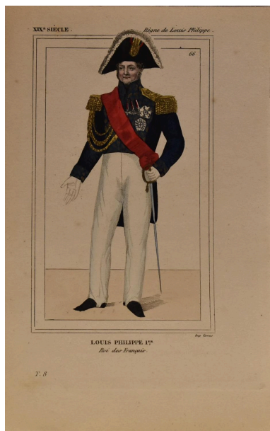
Louis Philippe Ier IVR84_20216300965NUCA