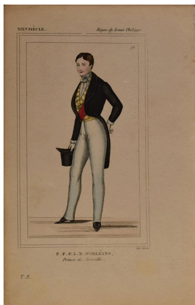
François d'Orléans, prince de Joinville IVR84_20216300968NUCA