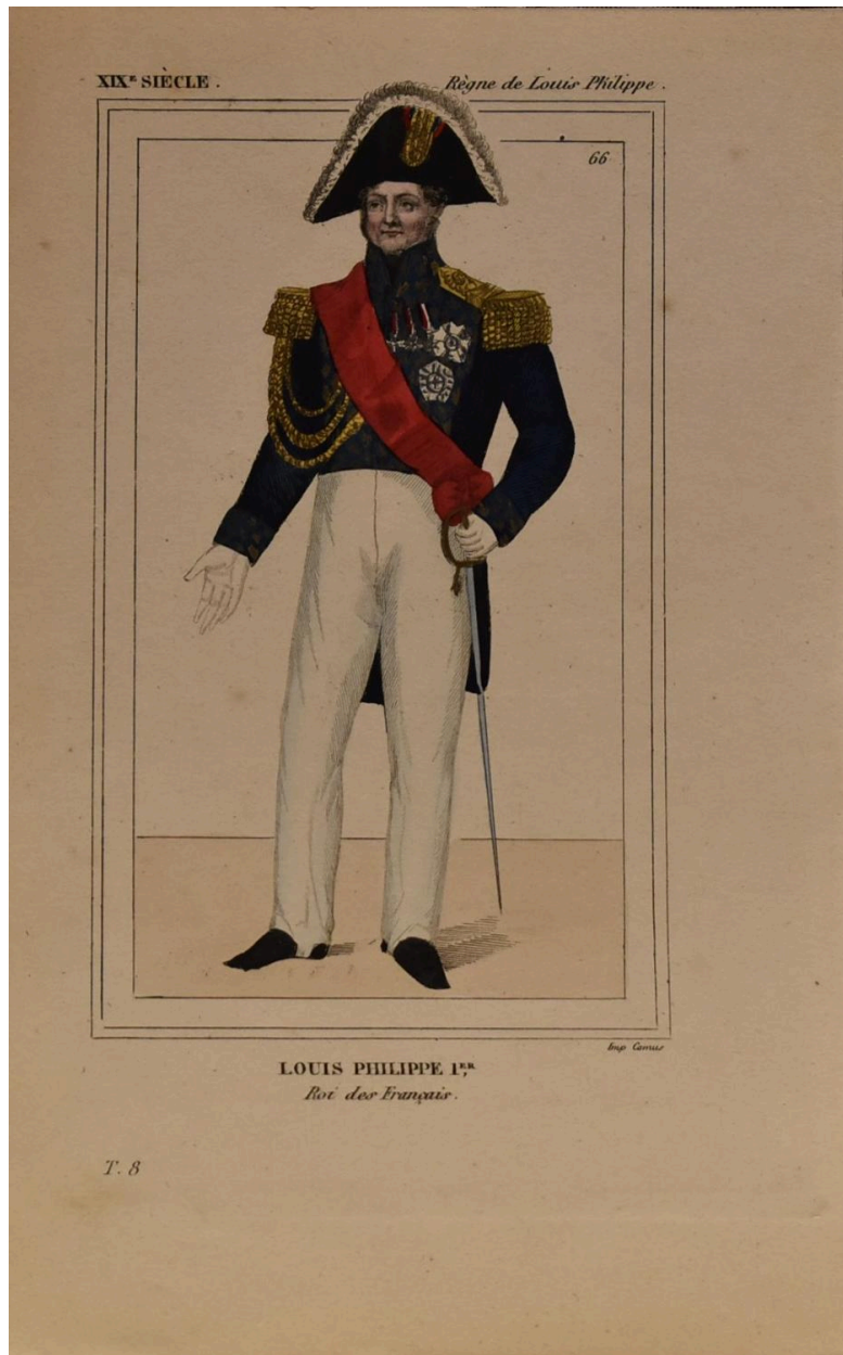
Louis Philippe Ier