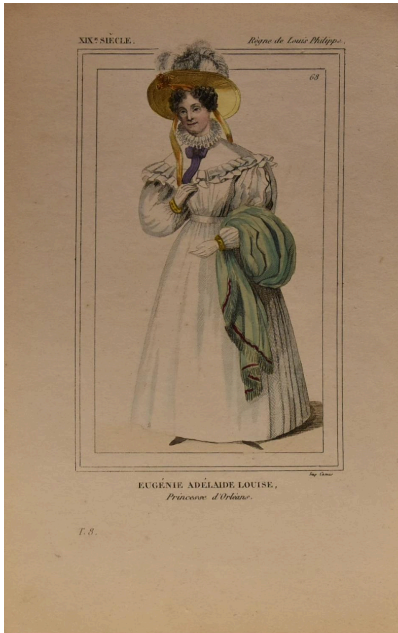
Adélaïde, princesse d'Orléans