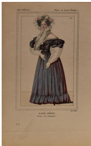
Marie-Amélie, reine des Français IVR84_20216300966NUCA