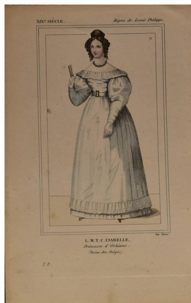
Louise d'Orléans, reine des Belges IVR84_20216300970NUCA