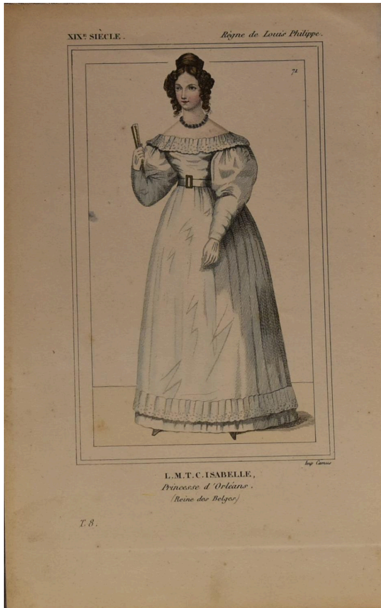
Louise d'Orléans, reine des Belges