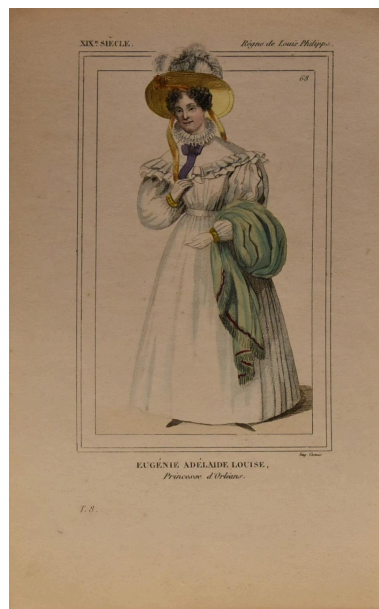
Adélaïde, princesse d'Orléans IVR84_20216300967NUCA