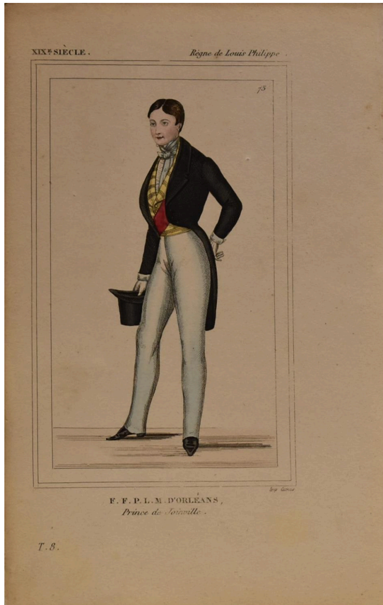
François d'Orléans, prince de Joinville