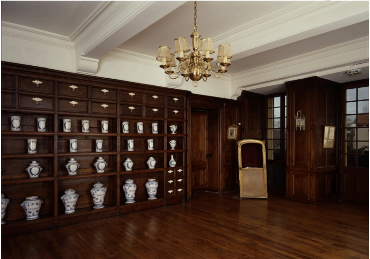
Vue prise depuis l'entrée en direction du jardin.