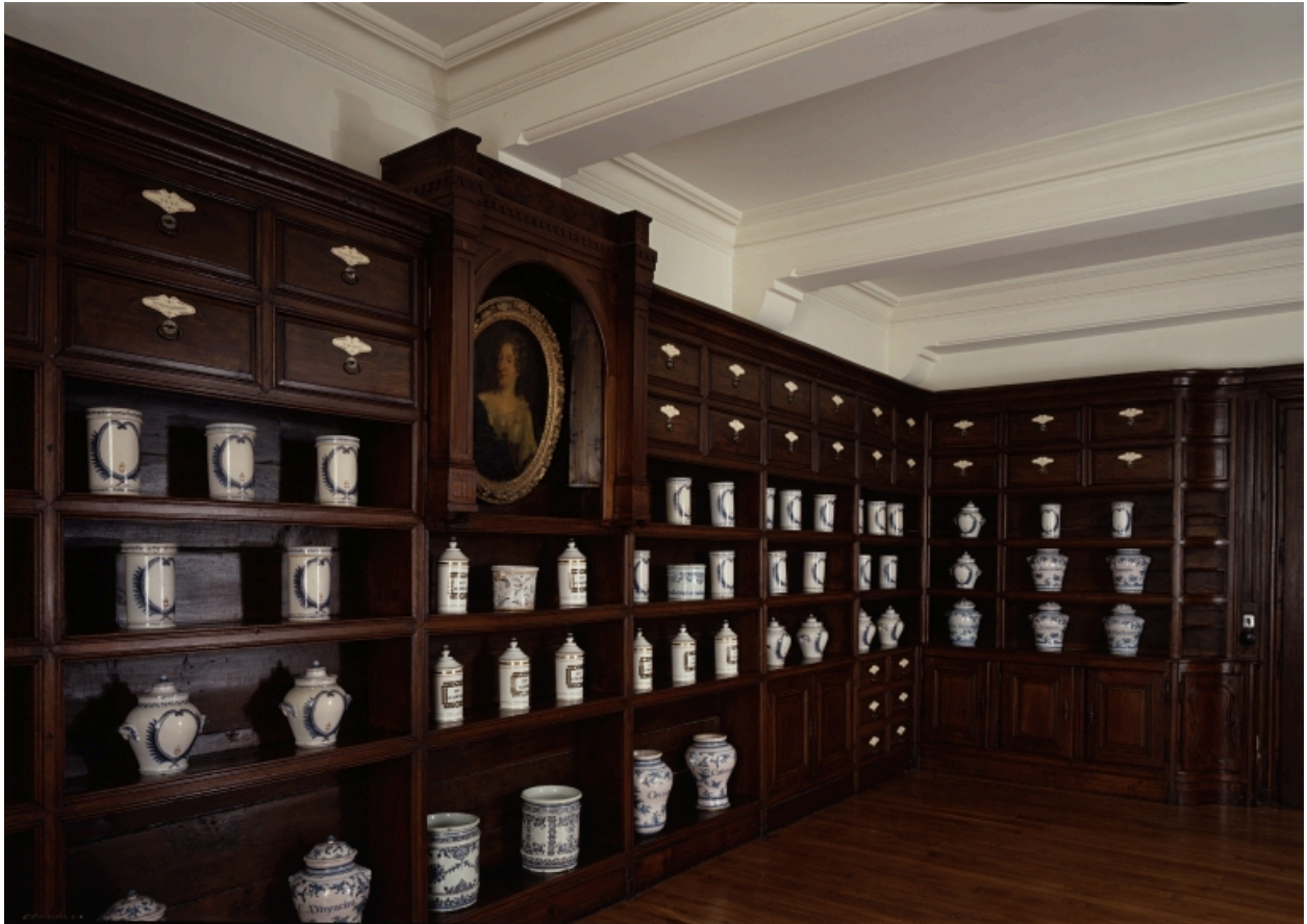
Vue prise du fond vers l'entrée.