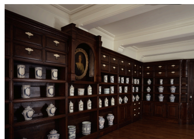
Vue prise du fond vers l'entrée. IVR82_19920100086PA