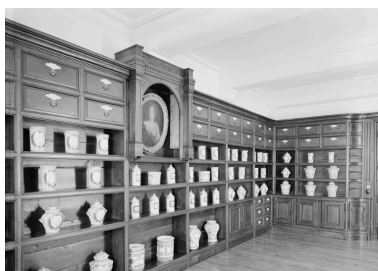
Vue prise du fond vers l'entrée. IVR82_19920100085P