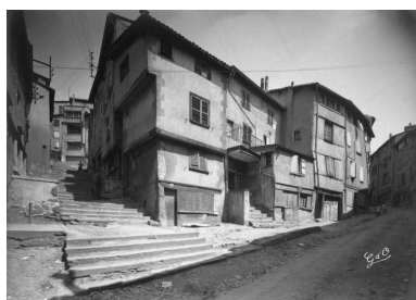
Les rues des Forgerons (à gauche) et Gambetta (à droite) à la fin du 19e ou au début du 20e siècle. IVR83_20126300394NUC