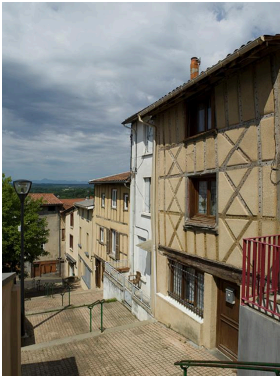
La rue en direction du bas. En arrière-plan, la plaine de la Limagne.