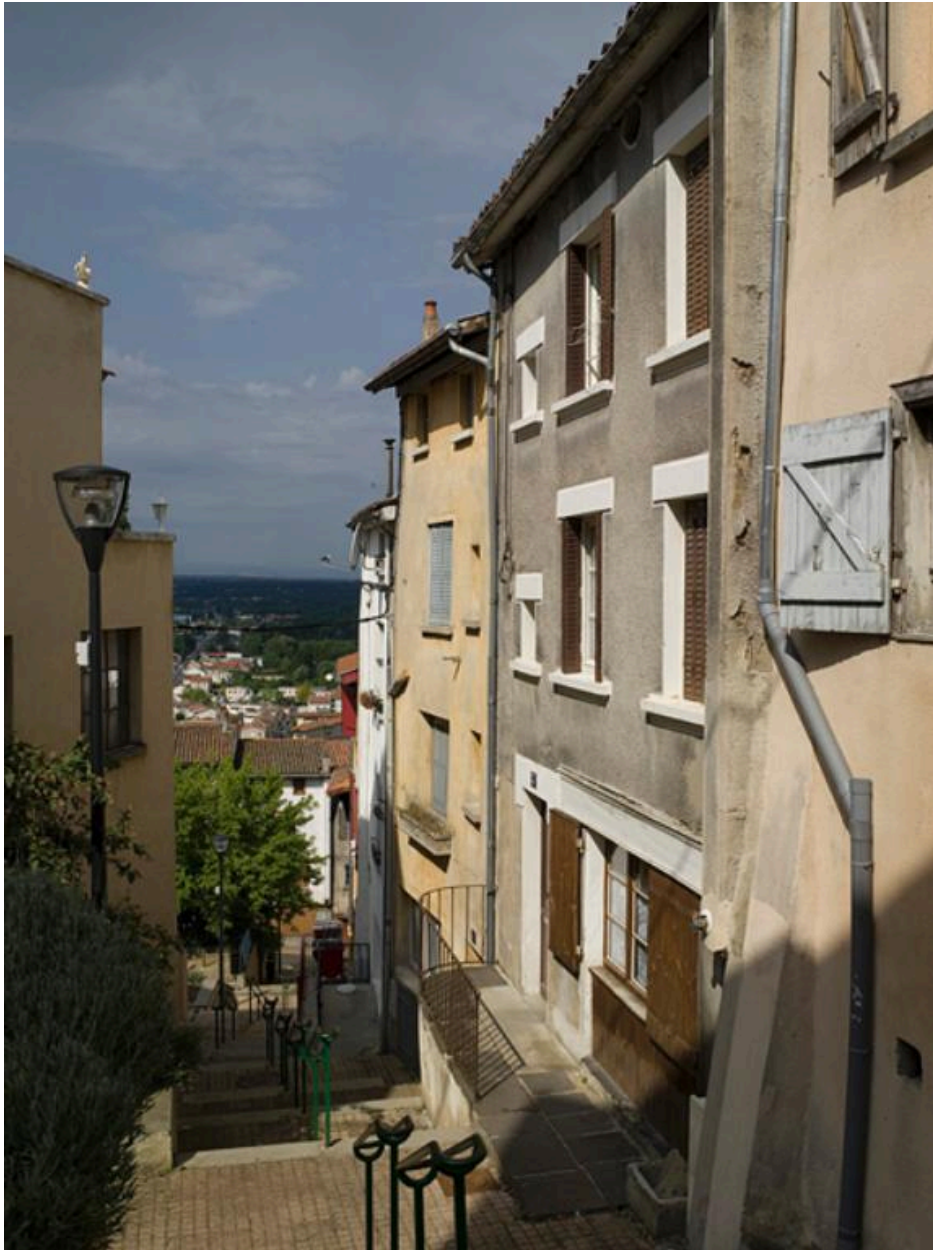
La rue en direction du bas. En arrière-plan, la plaine de la Limagne.