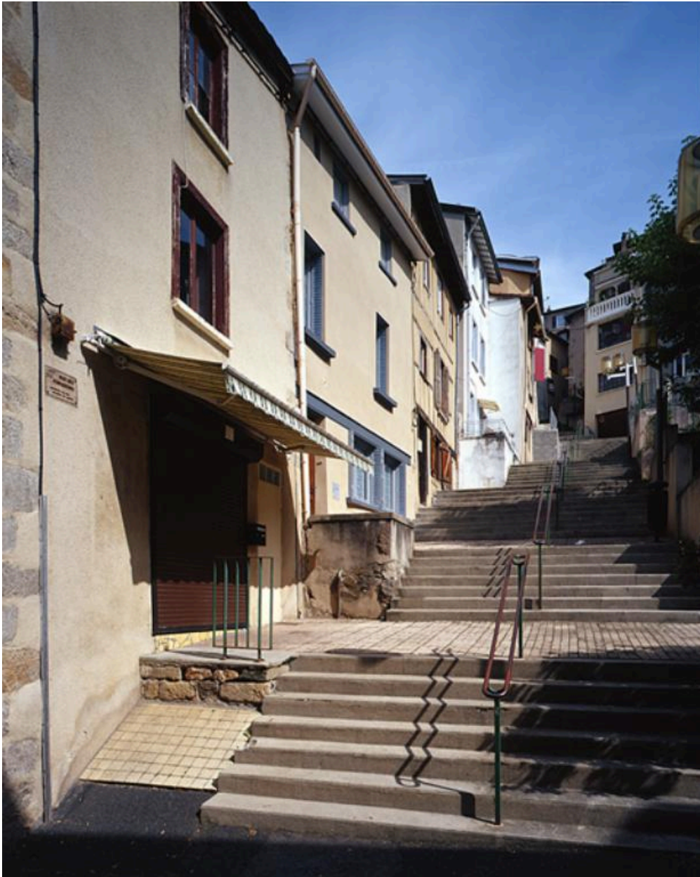
La rue depuis le bas, à son débouché sur la rue Gambetta.