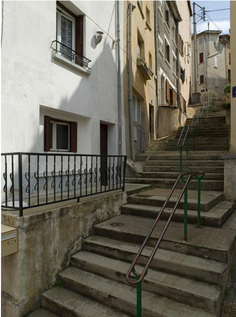
La rue en direction du haut.