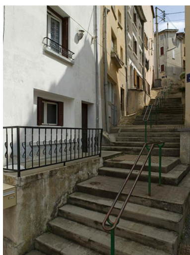
La rue en direction du haut. IVR83_20116300776NUC4A