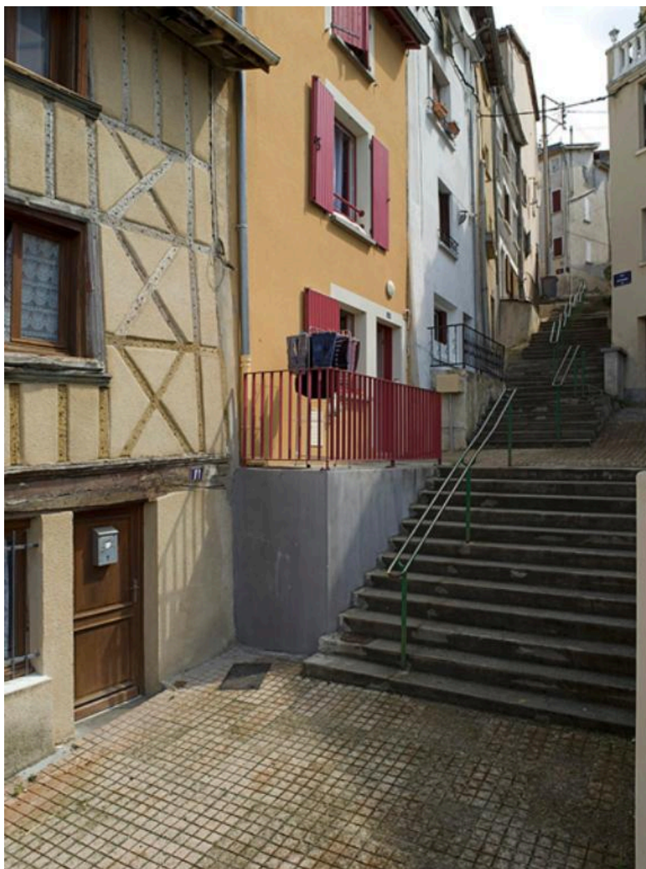
La rue en direction du haut.