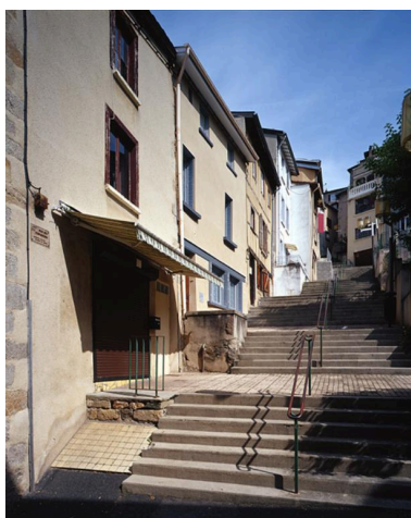
La rue depuis le bas, à son débouché sur la rue Gambetta. IVR83_20086300629VA