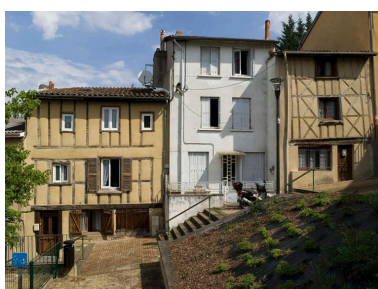
Maisons implantées parallèlement à la pente, dans la partie médiane de la rue. IVR83_20116300771NUC4A