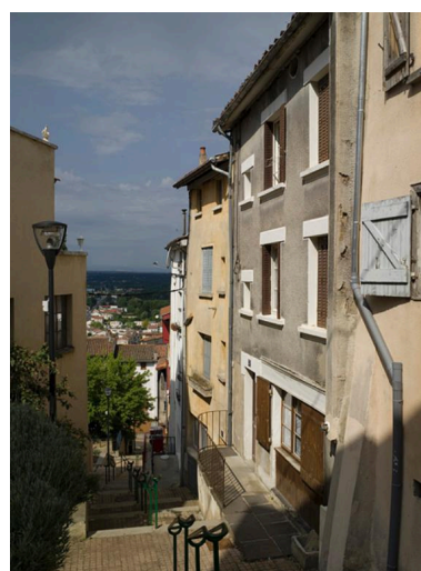
La rue en direction du bas. En arrière-plan, la plaine de la Limagne.