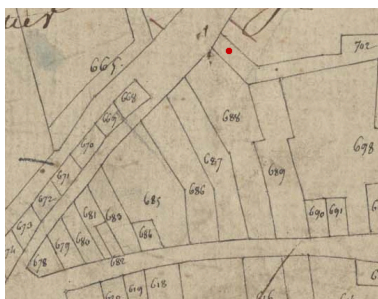
Plan de situation, extrait du plan cadastral, 1809, parcelle E 702 (partie est). IVR82_20124201301NUD