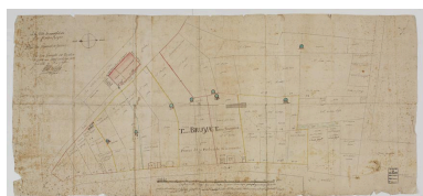
Plan des maisons et jardins, rue Simon Boyer en 1777. (A. Diana, Montbrison). Plan, 1777 B Diana Montbrison. C géo 149 (1) IVR82_20064200857NUCA