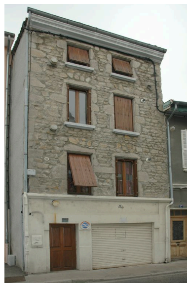
Vue générale IVR82_20124201296NUCA