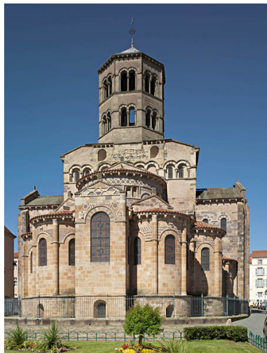
Vue du chevet IVR83_20136300440NUC4A