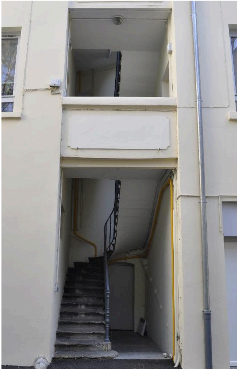
Immeuble sur cour, escalier à cage ouverte