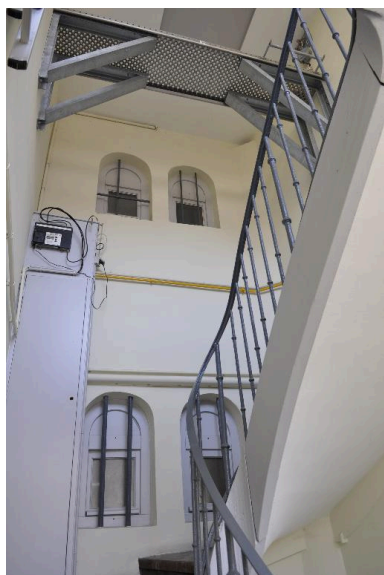
Immeuble sur cour, partie supérieure de la cage d'escalier

Immeuble sur cour, escalier à cage ouverte