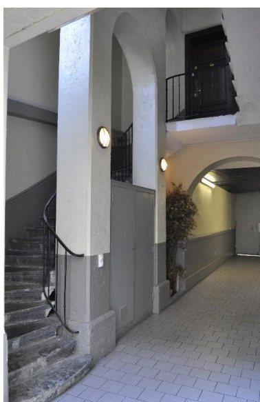
Immeuble sur rue, première volée d'escalier décalée à droite du passage cocher IVR82_20156902507NUCA