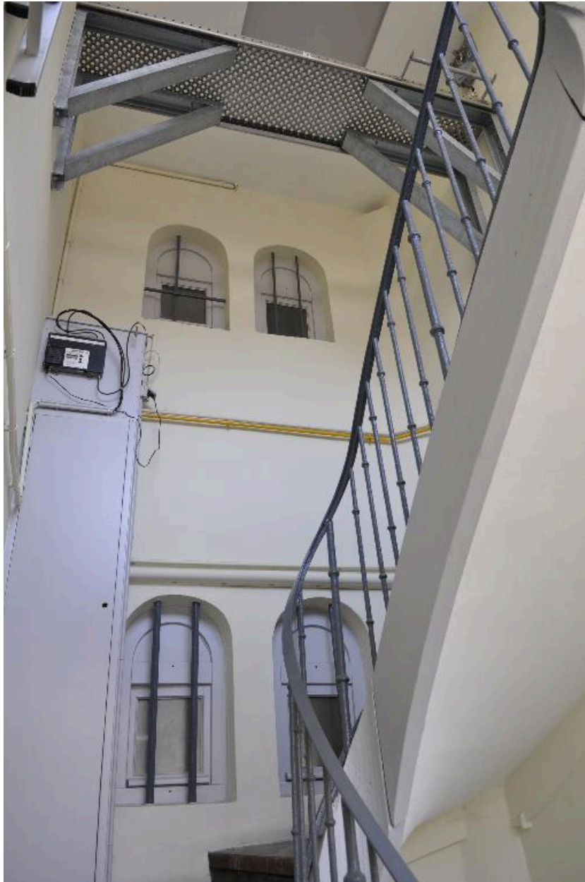
Immeuble sur cour, partie supérieure de la cage d'escalier