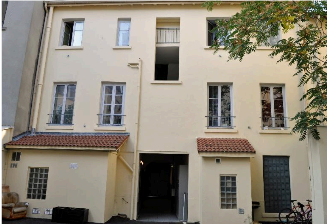
Immeuble sur rue, élévation postérieure