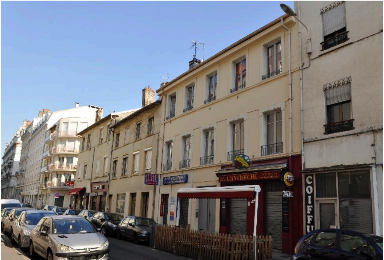
Immeuble sur rue, vue générale