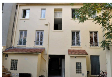
Immeuble sur rue, élévation postérieure