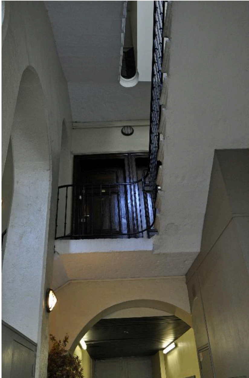
Immeuble sur rue, cage d'escalier