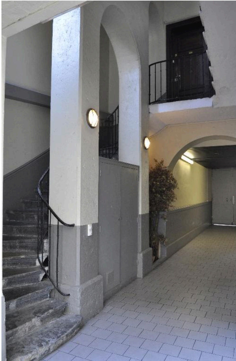
Immeuble sur rue, première volée d'escalier décalée à droite du passage cocher