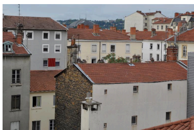
Immeuble sur cour, élévation postérieure et pignon latéral en moellons apparents