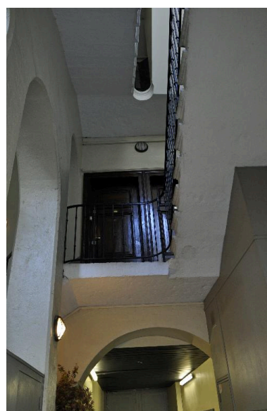
Immeuble sur rue, cage d'escalier IVR82_20156902532NUCA