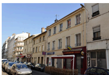
Immeuble sur rue, vue générale IVR82_20156901199NUCA