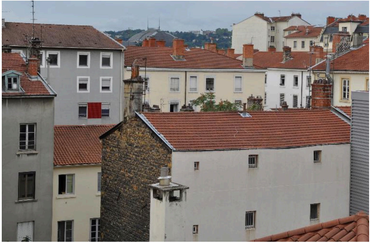
Immeuble sur cour, élévation postérieure et pignon latéral en moellons apparents