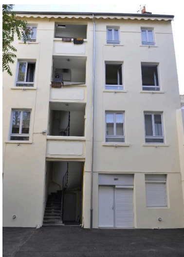
Immeuble sur cour, vue partielle de l'élévation antérieure