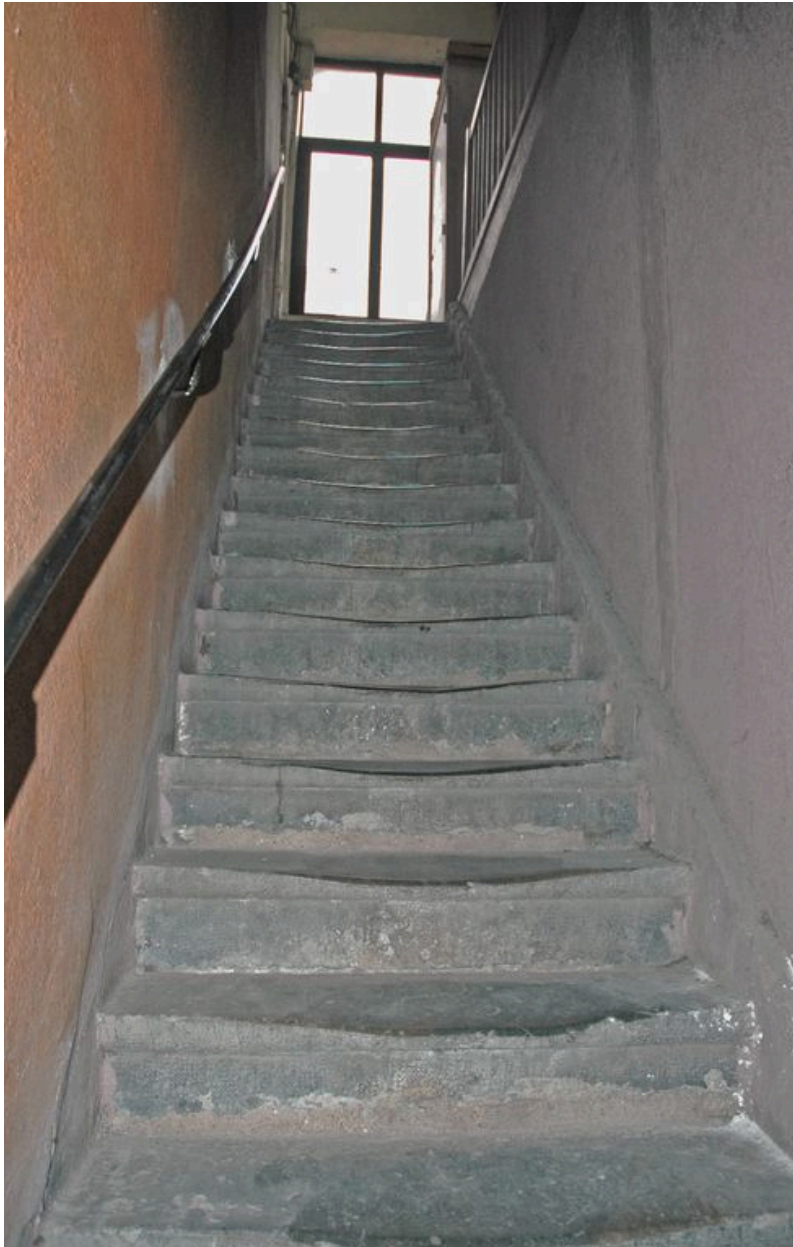
Volée droite permettant d'accéder au premier étage vue depuis l'est