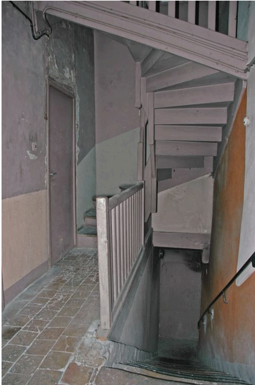
Palier du premier étage vue depuis l'ouest