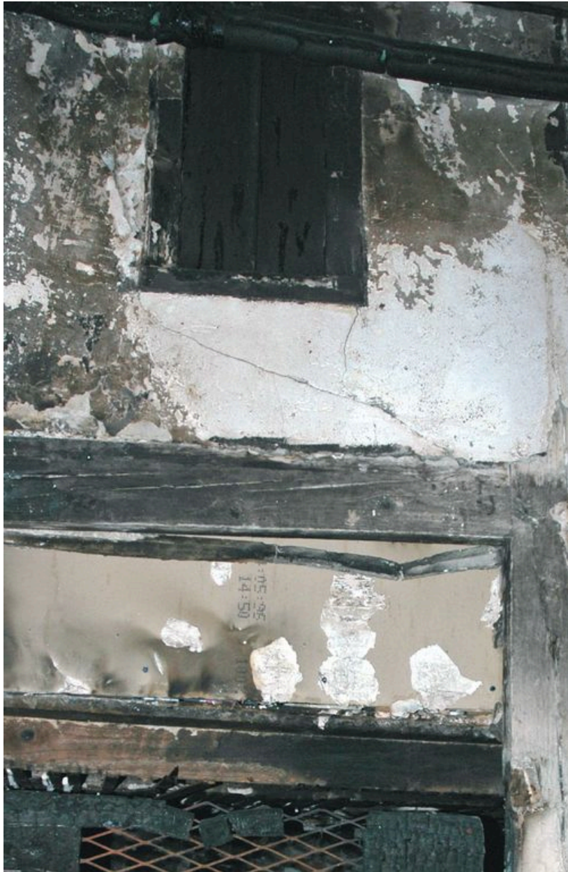
Lucarne au dessus de la porte donnant accès à la sous-pente