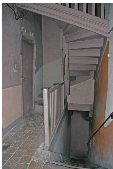
Palier du premier étage vue depuis l'ouest IVR82_20066901363NUCA