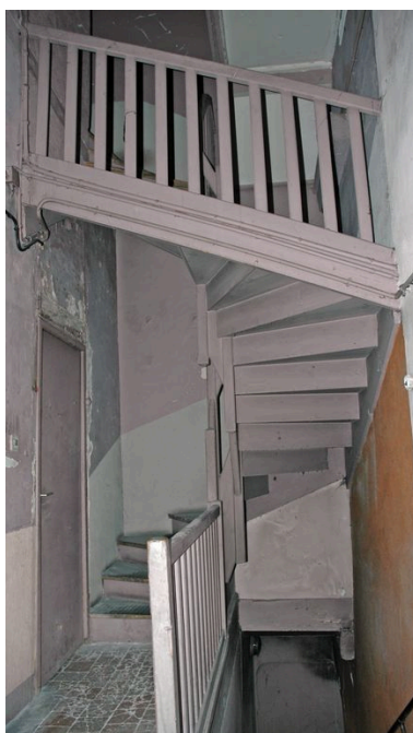
Escalier en bois desservant l'immeuble mitoyen situé au nord IVR82_20066901366NUCA