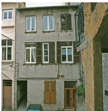
Façade ouest sur cour, vue depuis la cage d'escalier de l'immeuble sur rue IVR82_20066901365NUCA