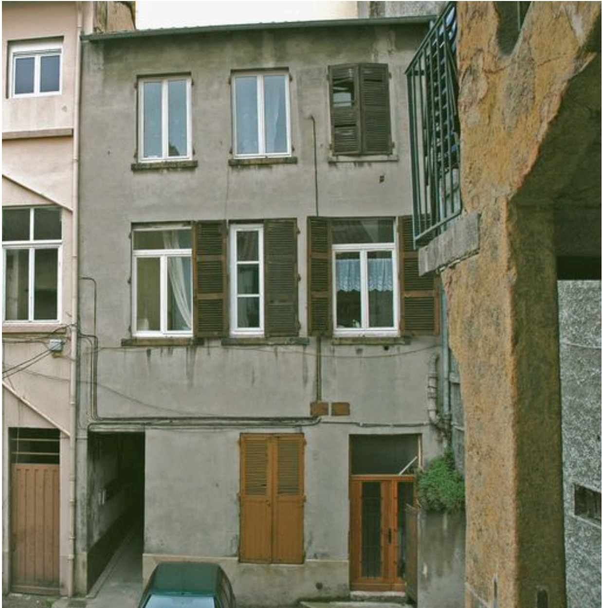
Façade ouest sur cour, vue depuis la cage d'escalier de l'immeuble sur rue