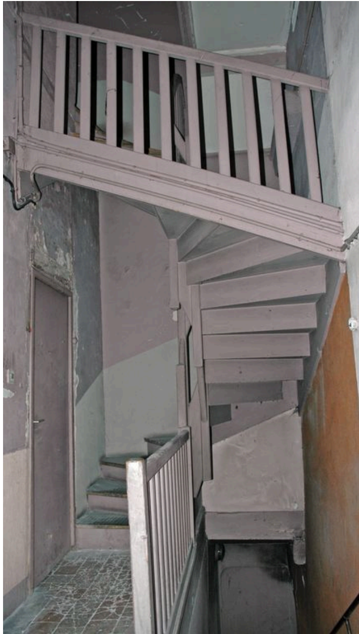
Escalier en bois desservant l'immeuble mitoyen situé au nord