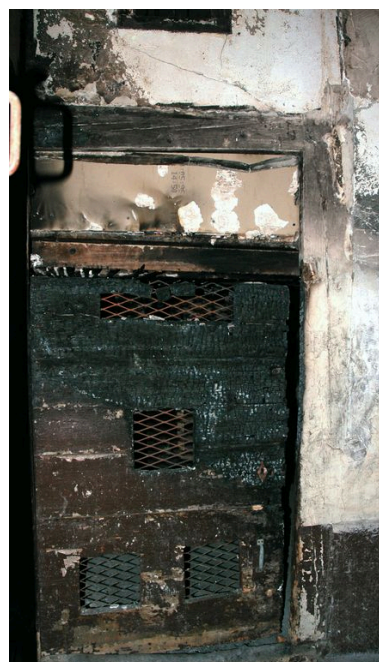
Porte donnant accès à la sous- pente au sud-est de l'allée IVR82_20066901362NUCA