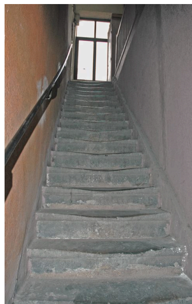
Volée droite permettant d'accéder au premier étage vue depuis l'est IVR82_20066901364NUCA