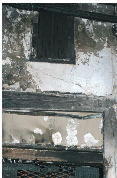
Lucarne au dessus de la porte donnant accès à la sous-pente IVR82_20066901258NUCA