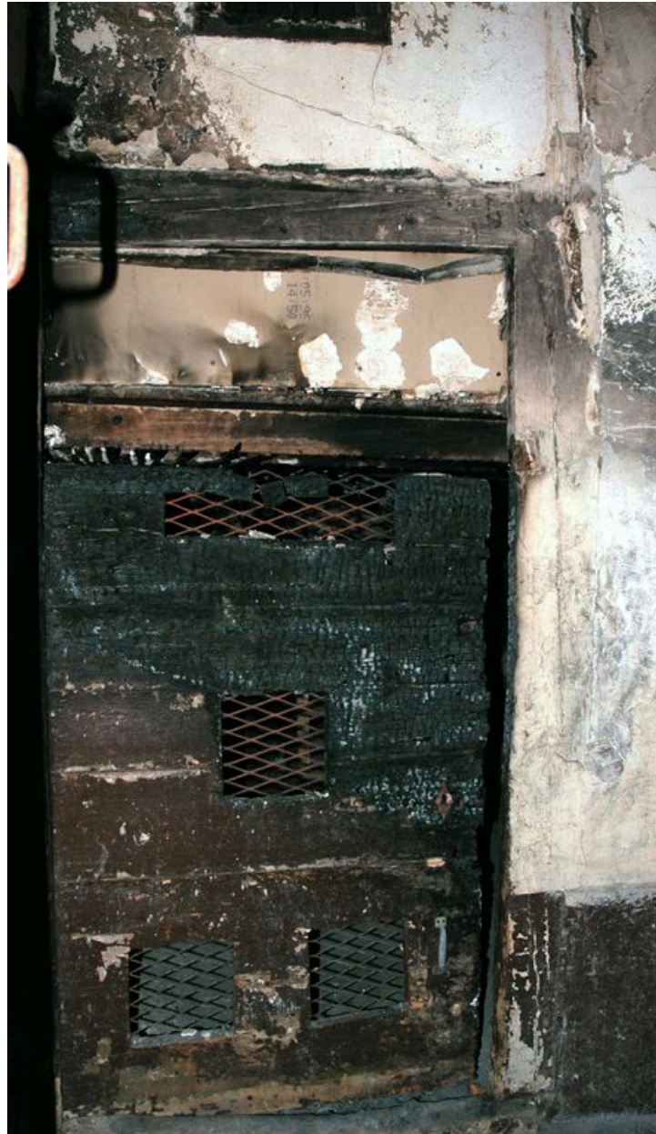
Porte donnant accès à la sous-pente au sud-est de l'allée