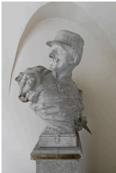
Vue de face IVR82_20126901973NUCA