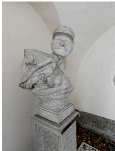
Vue générale IVR82_20126901974NUCA