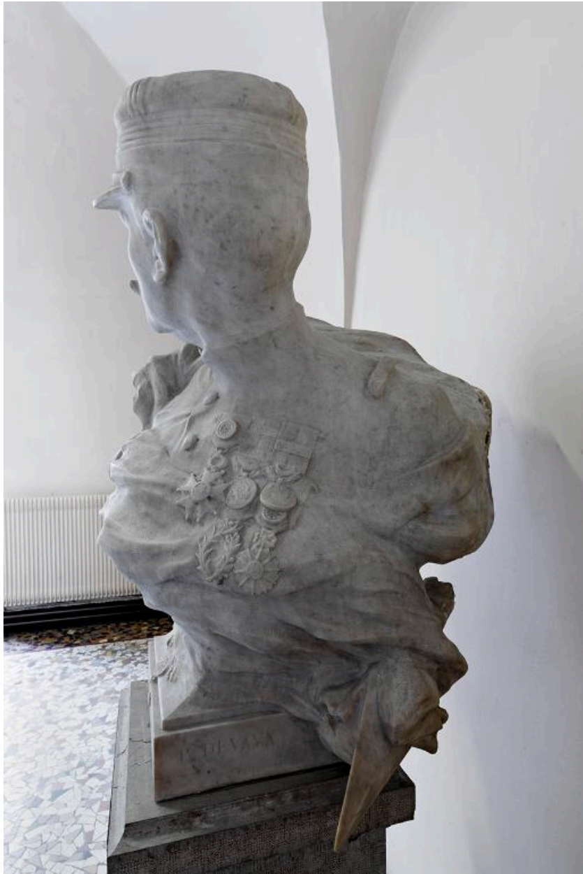
Vue du profil gauche