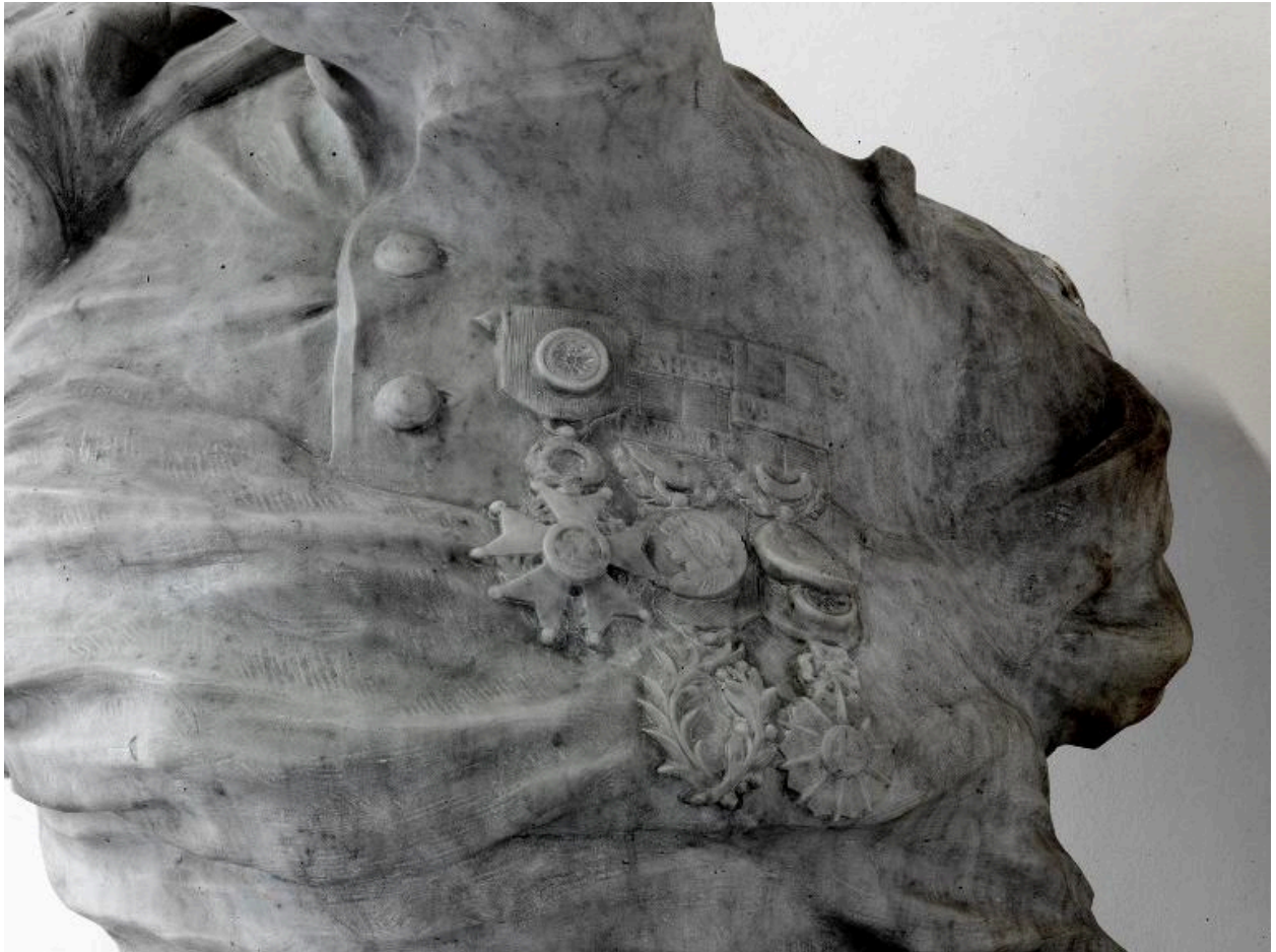
Détail des médailles