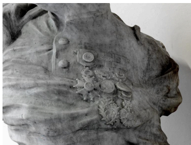
Détail des médailles