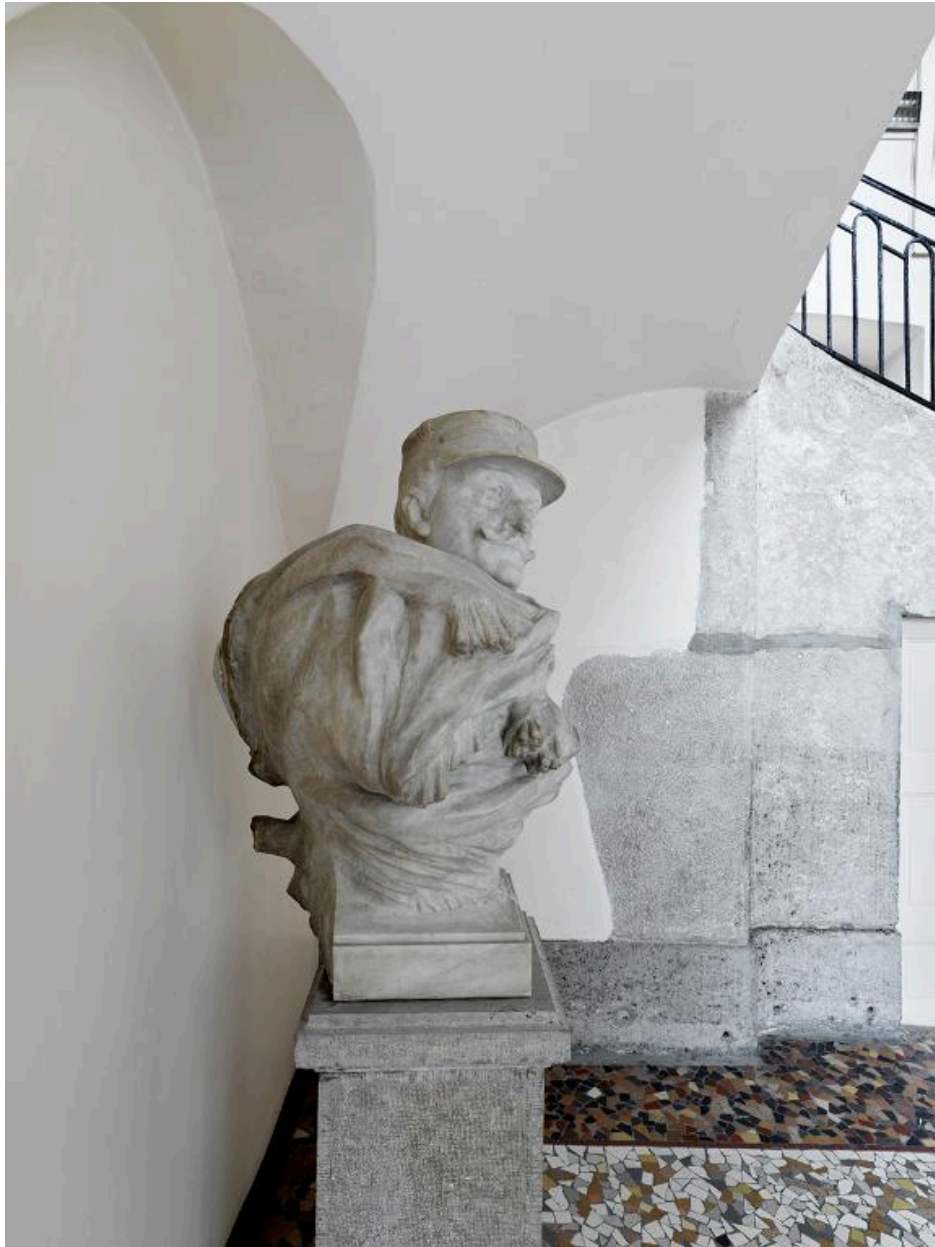
Vue du profil droit