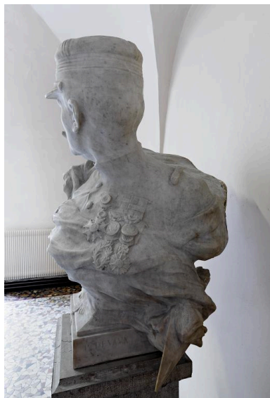
Vue du profil gauche