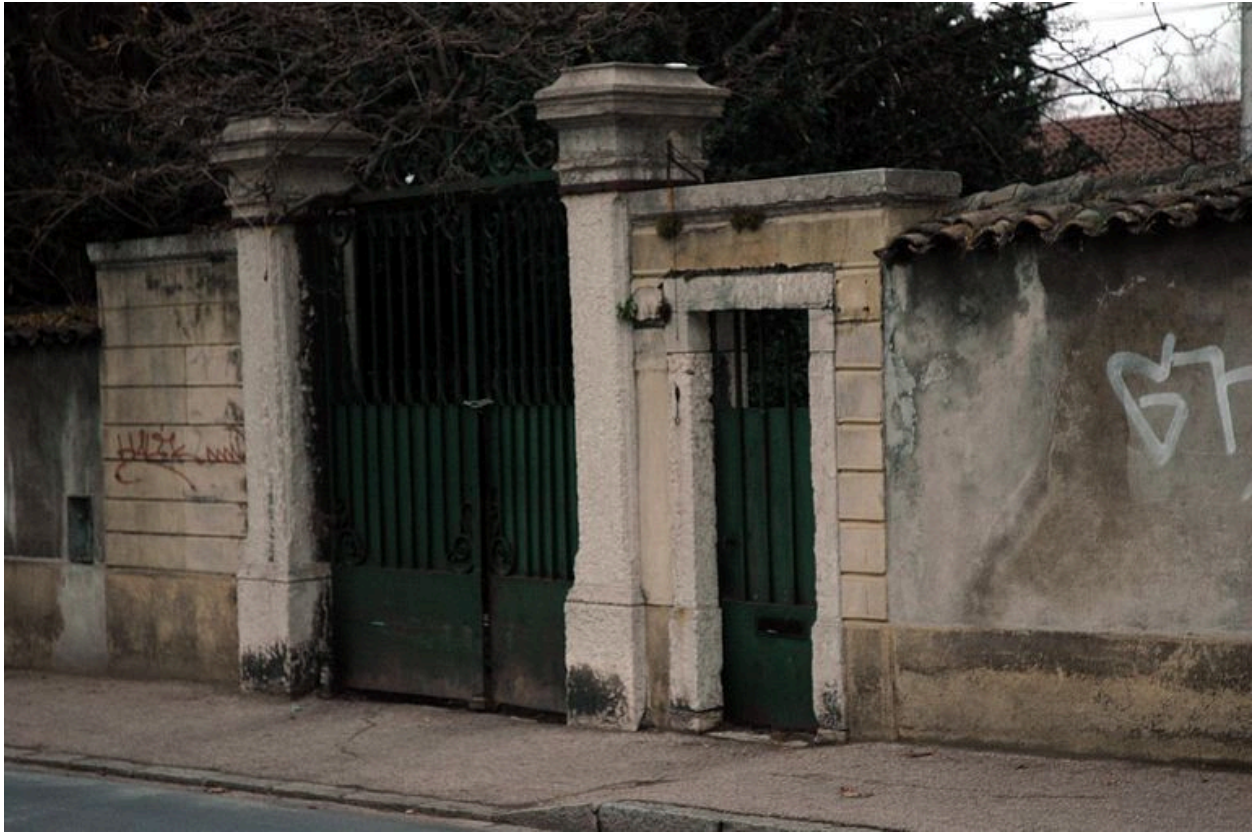
Détail du portail et de la porte piétonne