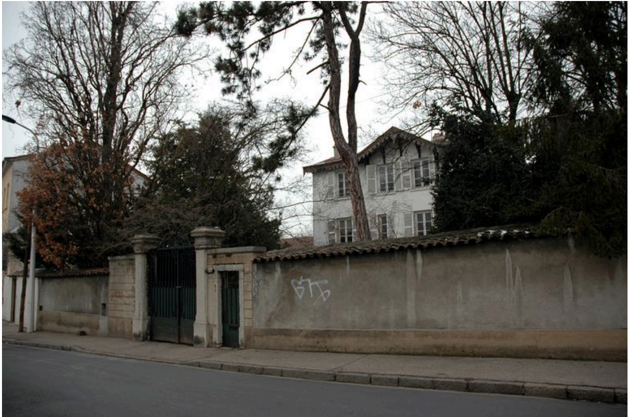
Vue d'ensemble depuis l'avenue