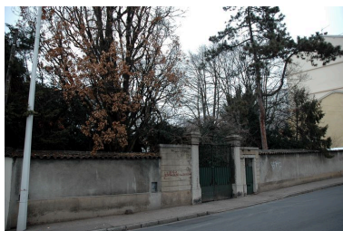
Le mur de clôture