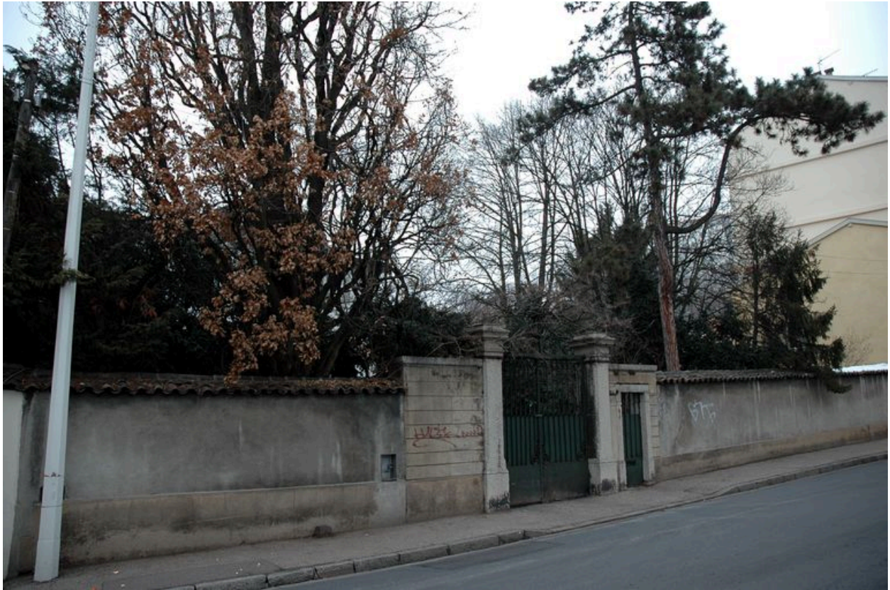
Le mur de clôture