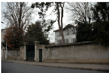
Vue d'ensemble depuis l'avenue IVR82_20066900820NUCA